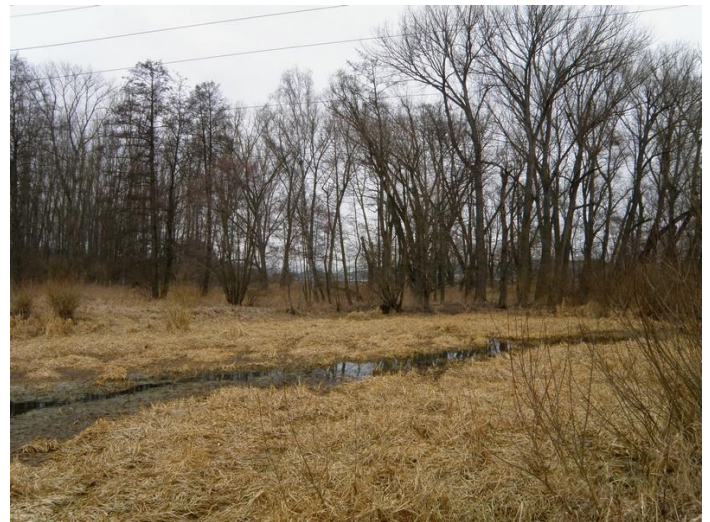
Zazemnění Staré řeky

tůně prostě nebudou. Vzpomínám si na obětavé rybáře, kteří se snažili ryby odlovit a přenášeli je do řeky. Nebo se ryby prostě snažili vychytat. Také si pamatuji na rybí kostičky na nepřírozené strusce a poslední tůň se skřehotajícími obožřivelníky. Dnes snad již nic takového neuvidím, je tu však jiná hrozba. Jsou to tůně, říční ramena a zálivy ponechané svému osudu. Mnozí rybáři asi vědí, o čem píši. Ke Strakonice se váže jedna taková lokalita, a tou je Stará řeka. Snad každý ze strakonických rybářů ji zná. Je místem, kam někteří z nich chodí, když se na řeku „nesmí“ z důvodu hájení některých, převážně kaprovitých druhů ryb. Ale Stará řeka už má pomalu předurčen svůj osud. A ten osud se jmenuje zazemnění. Pomalé a jisté. Co se vlastně děje? Voda ve Staré řece neproudí patřičně rychle, proto co do ní spadne, to tam zůstane, ať jsou to suché větve, listí nebo třeba to, co lidé nepotřebují. Zvláště to poslední by vydalo na samostatný článek. K tomu se přidává i biomasa, která zde každým rokem ve vegetačním období naroste a na zimu shnije. A tak dochází k tomu, že Stará řeka ve svém