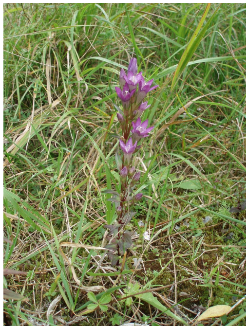
Hořeček český, foto Radim Paulič

V současné době patří tato krásná, na podzim kvetoucí rostlina – hořeček český – k velmi vzácným a vymírajícím druhům rostlin v celé ČR. V minulosti rostl na pastvinách, sečených loukách, výslunných mezích, na okrajích cest a na různých naru-