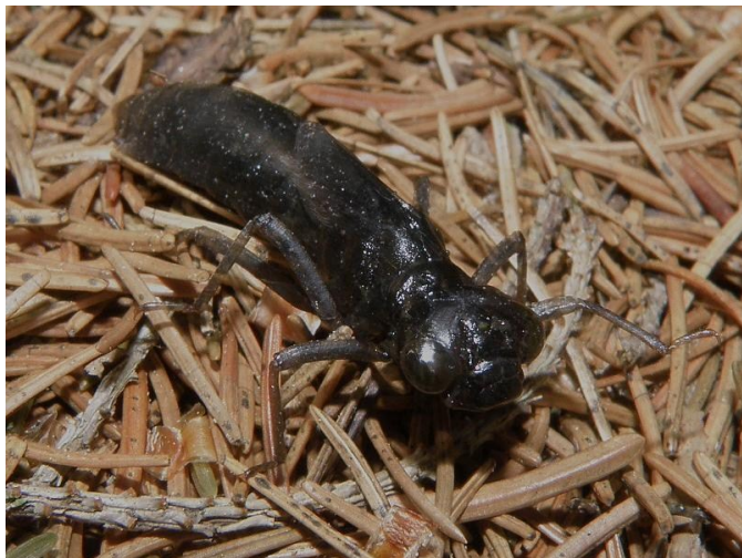
Larva z řádu vážek

Pokud i přesto chcete v oživení zavedené studánky pokračovat, doporučuji neprovádět žádné terénní úpravy a soustředit se pouze na to, aby studánka byla vyčištěná a bez bahna. Třeba se časem majitel sám ozve. I tak není vyhráno. Zapomenutá studánka má často své vodní obyvatele. Pokud není její voda určena k pití, doporučuji tomuto faktu věnovat pozornost. V opačném případě bychom mohli udělat více škody než užítku. Bylo by tedy vhodné začít s čištěním studánky právě v jarních měsících, kdy studánka neoplývá množstvím života, a svou aktivitu soustředit pouze na to, aby se studánka nezazemnila. Zachovat její přírodní charakter, bez vysypávání dna bílým vápencem, bez