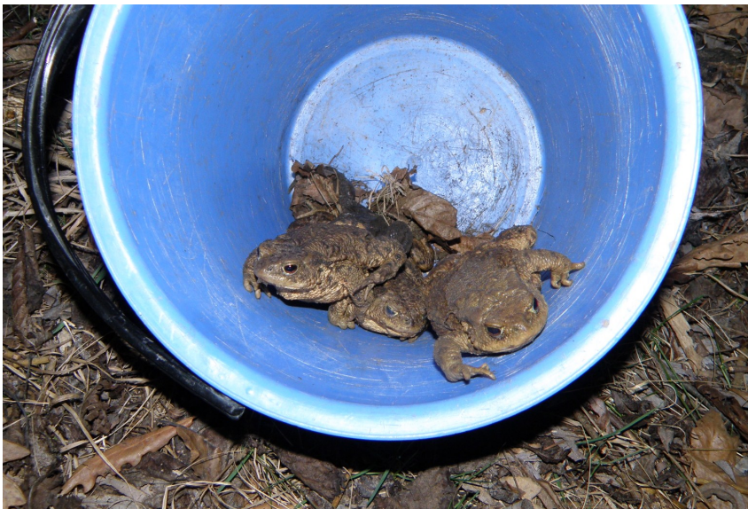
Přenášené ropuchy obecné, foto -jj-

Březen 2011 – Průběh počasí a s ním související nástup migrace se ukázal jako naprosto nevyzpytatelný. I když se s přípravami započalo hned po dokončení zimních ochrannářských činností (např. čištění budek), tak tak se stavba zástěn stihla. Teplé a vlhké období časného jara způsobilo bouřlivý tah o 14 dní dříve proti předcházejícímu roku. Podařilo se převést cca 400 žab (část putovala pod silnicí, část byla nasbírána a přenesena) a snůška v rybníce byla o objemu asi čtyř bramborových pytlů.