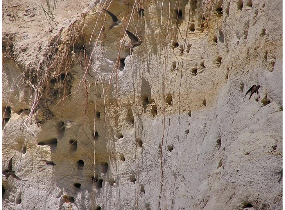
Nory břehulí říčních v pískovně V Holi

Dne 9. 3. 2012 se v pískovně V Holi setkali zástupci ZO 20/01 ČSOP Strakonice, OŽP MÚ Strakonice, Technických služeb a Báňského úřadu, aby se dohodli, jak pokračovat v těžbě písku v této lokalitě. Setkání bylo provedeno v souvislosti s výskytem chráněných a vzácných živočichů a plánovaným záměrem těžby písku. Mezi jednotlivými složkami došlo k dohodě, jak např. postupovat při odtěžení stěny, v níž se vyskytují a hnízdí břehule říční. Jak šetrně postupovat při těžbě písku v okolí malé tůňky, kde se každým rokem nalézá několik kuněk obecných, nebo jak bude pro četné vzácné obojživelníky zřízena mělčí plošina, popřípadě ostrůvek z nekvalitního písku uprostřed zatopené části pískovny. Bylo rovněž konstatováno, že přejíždění těžké techniky přes zarůstající dno pískovny je pro lokalitu a chráněné druhy hmyzu příznivé a že výskyt živočichů a techniky se nevyklučuje. Jednání všech zúčastněných složek bylo velmi tolerantní a vstřícné a zdá se, že bude přínosem zejména pro faunu a flóru, která v pískovně je.