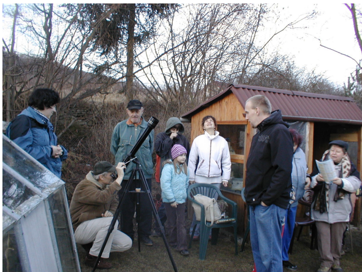
Momentka ze schůzky MOP 2. 3. - pozorování večerní oblohy, foto -ah-

A zaspívat další písničku, kterou se od nás MOPíci naučili už první jaro hned po založení kroužku, tj. v roce 2008: „Vítám tě, voděnko, o Veliké noci...“ Známe ji z filmu Karla Zemana „Čarodějův učeň“ vytvořeného v roce 1977 ploškovou animací. Úplně malým dětem není radno ho pouštět, protože je tak působivý a strašidelný, že by to na ně bylo moc, ale jinak je to jedna z podivuhodných ukázek, co všechno bylo vytvořeno českými tvůrci pro milovníky animovaných filmů. -ah-