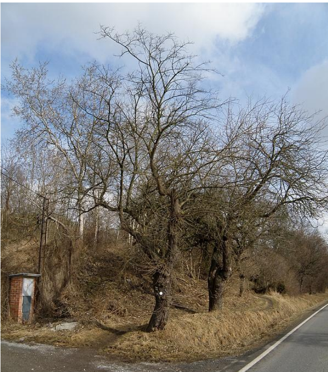
Morušovník černý při Radomyšlské ulici

Druhý strom, o kterém se v tomto čísle Kompostu zmíním, je morušovník černý. Je tu určité sepletí exotična a užitekosti, které tento druh naplňuje. Morušovník černý se do Evropy dostal zřejmě ze Střední Asie a stal se stromem starých venkovských sídel a zahrad. Zde naplňoval svou exotickou funkci a zároveň poskytoval tmavočervené nebo purpurové plody, které se hodily k přímé konzumaci i k přípravě marmelád, želé nebo past. Strom, zejména jeho plody, je oblíben také ptáky. Ti člověku ve sběru velmi rádi konkurují a požírají tyto plody až do prvních mrazíků. To si mohou ověřit třeba návštěvníci botanické zahrady v Liberci, ale také obyvatelé Strakoníc. A právě o strakonických morušovnících budou následující řádky.