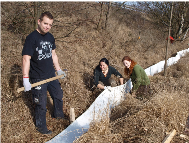
Dobrovolníci při stavbě zástěn, foto Pavla Maradová

Jedním z nejkritičtějších míst tahu žab na Strakonicku je bezesporu úsek komunikace I. třídy ze Strakonice do Volyně za odbočkou na Kapsovou Lhotu ve stoupání pod místem zvaným Vlčiny. Dvě vodní nádrže, představující místo pro rozmnožování, kam se stahují obojživelníci ze širokého okolí, zde přímo sousedí se zmíněnou silnicí. Mnoho set jedinců se v tomto místě koncentruje v době jarního tahu. Zvířata ovládaná pudem se snaží dosáhnout cíle, v cestě jim však stojí silnice. Provoz je zde tak silný, že doba několika minut, potřebných k překonání vozovky, je pro drtivou většinu z nich osudná. Ve většině případů se jedná o ropuchy obecné, méně také o skokany hnědé a okrajově ostatní zástupce obojživelníků. Pomalým tempem putují k místu snůšky, a to často v amplexu - tj. v tandemu samičky nesoucí samečka. To, co se děje na místech nijak člověkem neošetřených, je asi nasnadě.