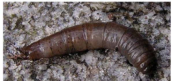
Larva z rodu tiplic

A ta třeba může znít: o studánky je nutno se starat. To je důležitá věc, někdy důležitější než samotné hledání. A tak si každým rokem pravidelně alespoň dvě vyčistím, a když vidím, že je někde některá studánka, která prožila počáteční publicitu a upadla v zapomnění, tak se jí také snažím ulevit. Není to moc, ale lepší něco než nic. Zase na druhou stranu ono to čištění studánek není jen tak. Předně je dobré vědět, komu pozemek se studánkou patří. A zda majitel s naší aktivi-