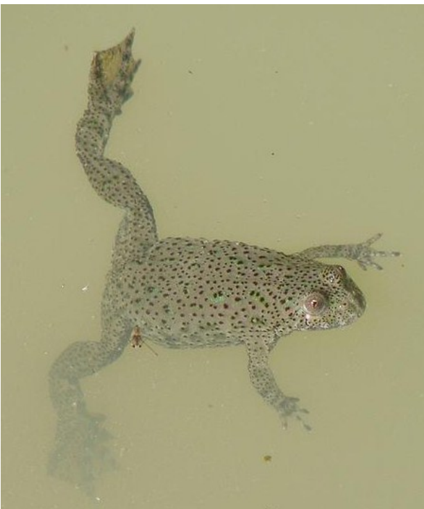
Kučka ohnivá