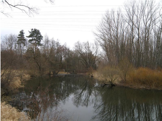
Stará řeka

S přicházejícím jarem stoupá u většiny z nás chuť vydat se do přírody. Pro zahrádkáře je to doba, kdy netrpělivě plánují, jak rozmístí své záhonky. Tu něco zasejí, tu vsadí, tamhle stříhnou větvičku nebo opraví to, co zima nenechala bez povšimnutí. Jiní z nás zase vyrazí do přírody jen tak se potěšit prvními zelenými větvičkami nebo prorážejícími květy krokusů, sněženek a petrklíčů. Určitá skupina lidí, jež se nazývá rybáři, pozoruje ustupující led a začínající hemžení rybek pod hladinou. A právě