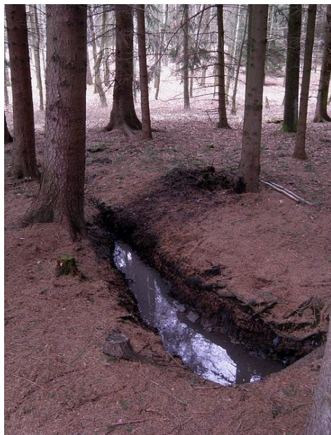
Studánka mezi Skočicemi a Dvorci

betonového ostění či skruže a složitých střešních konstrukcí. Nalezené studánkové živočichy, případně rostliny pouštím do studánky zpět. Vybraný materiál ze dna většinou v tomto případě ponechávám poblíž odtokové stružky. Když nějakého tvora přehlédnu, dávám mu tím šanci se do vody opět dostat. Věřte, že pokud voda studánky není určena k pití, udělali jste snad vše potřebné, aby studánka nějaký měsíc zase žila svým životem. Závěrem doporučuji se na studánku dojit během roku několikrát podívat, sledovat její život před a po zásahu. Někdy se člověk hodně dozví a naučí, nejsme tu sami.