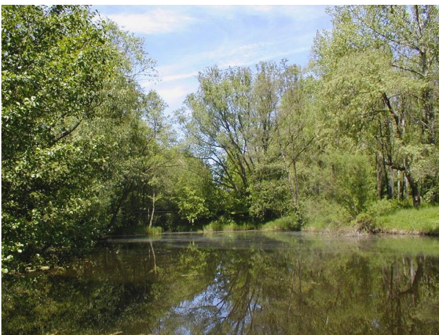
Stará řeka podruhé, v letním období, foto -vh-

výtoku do řeky Otavy má v období sucha jen pár centimetrů vody. Pobřežní rostlinstvo dostupnost bahna rádo využije a postupuje hlouběji a hlouběji do přirozeného odtoku. Časem může dojít k tomu, že se oba pásy pobřežního rostlinstva spojí,