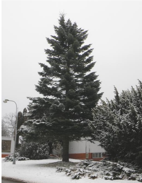
Jedle obrovská ( Abies grandis ) před budovou Madety, foto -vh-

druhem jedle. Tato dřevina pochází rovněž ze Severní Ameriky. Roste ve Skalnatých horách a vystupuje až do výšky 3000 m. n. m. Do Evropy byla dovezena v roce 1872. V našich podmínkách se dokáže vměstnat mezi ostatní jehličnaté stromy, ale může růst i jako solitér. Svým vzhledem je předurčena pro použití v parcích jako ozdobný strom. Ve Strakonících je jedle ojíňená asi zastoupena více než ostatní druhy zde popisovaných jedlí. Najdeme ji třeba mezi domy u ulice prof. A. B. Svojsíka nebo jako dvoják na pokraji ulice Erbenovy. Zajímavě tvarovanou korunu má strom u budovy Policie v ulici Plánkové. Dokonce, když jdete po Husově ulici k semaforu řízené křižovatce u nákupního centra, je možno spatřit tuto jedli v zahradách soukromých majitelů. V dolní části města se vyskytuje nedaleko popisované jedle bělokoré u ulice Ellerovy a návštěvníci Strakoníc se s touto jedlí mohou setkat poblíž chodníku u autobusového nádraží.