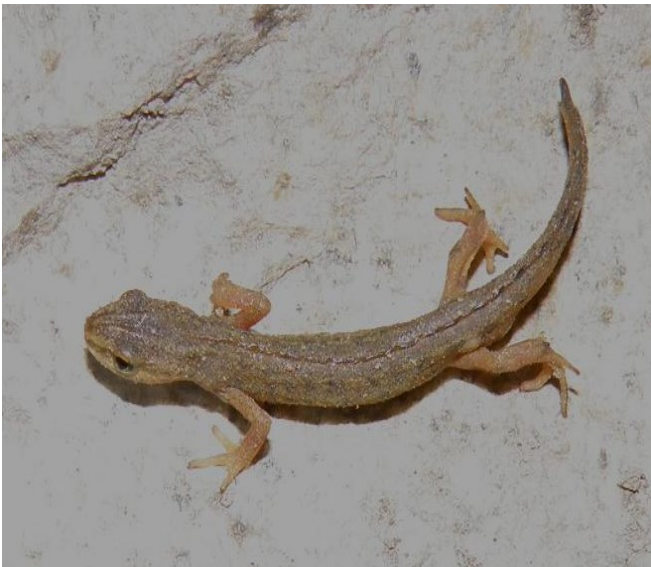
Čolek obecný u zástěn na Volyňské silnici za křižovatkou Radošovice - Kapsova Lhota, foto -vh-

Termín sběru: zástěny byly napnuty ode dne 10. 3. 2012 a sejmuty dne 1. 5. 2012. První tah žab začal dne 23. 3. 2012.