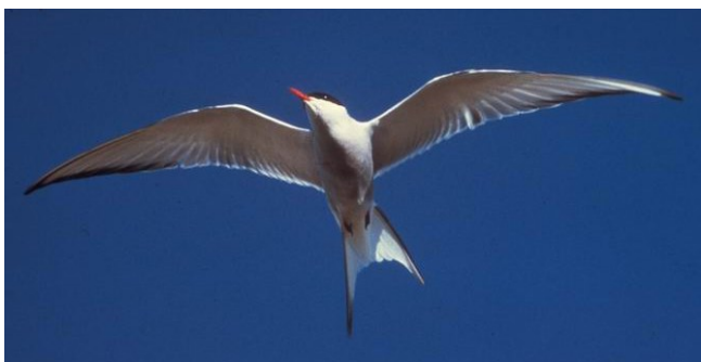
Rybák dlouhoocasý

„...Ale když se v polovici března začínalo šerit po smutné polární noci, vycházel jsem před jeskyni na skálu, odkud jsem se díval na tmavou ohromnou ledovou plochu oceánu před sebou. Tehdy už bouře usnula, vycházeli jsme, navštěvovali jsme se a z vrcholků zasněžených skal jsme se dívali k obloze, kdy poletí artic bird, pták polárního jara. Arctic bird je bílý pták jako holub, přiletí znenadání od jihu a letí přímo na sever směrem k točně. Letí prý až nad 89. stupeň, kde se obrátí. Vidáme ho také, jak letí zpátky. Ten podivný pták letí vždycky sám a sám, nikdy v hejnech. Letí velice vysoko a tiše a je ozářen sluncem, třebaš my dole slunce ještě nemáme. Tak první paprsky jarního slunce vidíme na křídlech tohoto ptáka, který jasně svítí do našeho soumraku. Domorodci si počínají jako zbláznění, když ten zářící pták táhne pod tmavou oblohou. Uznávají ho za největšího boha, který je na severu, protože přináší slunce. A opravdu, když se za několik dní vrací, je už slunce na obloze. A my, staří, vousatí otužilci, stojíme potichu na skále a díváme se za ním, dokud nezmizí, a chápeme Eskymáky, kteří k němu vztahují ruce a jásají. Nikdy jsem toho ptáka zblízka neviděl a pochybuji, že by se našel člověk, který by dovedl zastřelit tohoto hlasatele slunce. Nechci ani myslit, co by se stalo tomu, kdo by ho zabil...“