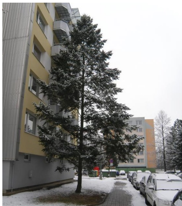
Jedle bělokorá ( Abies alba ) před panelovým domem u Ellerovy ulice

Jedle bělokorá je jeden z jehličnatých stromů, který u nás vyvolá překvapení, když se s ním v lese setkáme. Je považována za něco vzácného, co není často vidět a skrývá se na neočekávaných místech. Mnozí po ní touží při vánočních svátcích, ale často ji nahradí nějakým cizokrajným druhem jedle, aniž by to tušili. Samotná jedle bělokorá se honosí dlouhým věkem (až 600 let) a mimořádně pěkným růstem. Může dosáhnout výšky až 60 m. Její vrcholek bývá často sesazen nějakým povětrnostním jevem, a tak vytváří útvar, kterému se někdy říká „čapí hnízdo“. V našich lesních porostech se jedle často vyskytuje smíšená se smrkem a bukem. Na půdu je náročnější než smrk. Stejně tak je náročná na čistotu ovzduší a spíše vyžaduje lesní klima. Prvotně jedli poznáme od ostatních jehličnanů (např. smrku) podle hladké borky. A potom se již musíme nechat vést jehlicemi, pupeny a utvářením šiškových šupin. Samotnou šišku nalezneme málokdy, protože se ještě na stromě rozpadá. Lehké a měkké dřevo jedle bělokoré se používá ve stavebnictví, zejména ve vodních stavbách. V samotných Strakonických mnoho exemplářů jedle bělokoré není. Jednu z nich můžeme vidět u restaurace Ráj a druhou uprostřed města při Ellerově ulici naproti Lidlu, schovanou za panelovým domem.