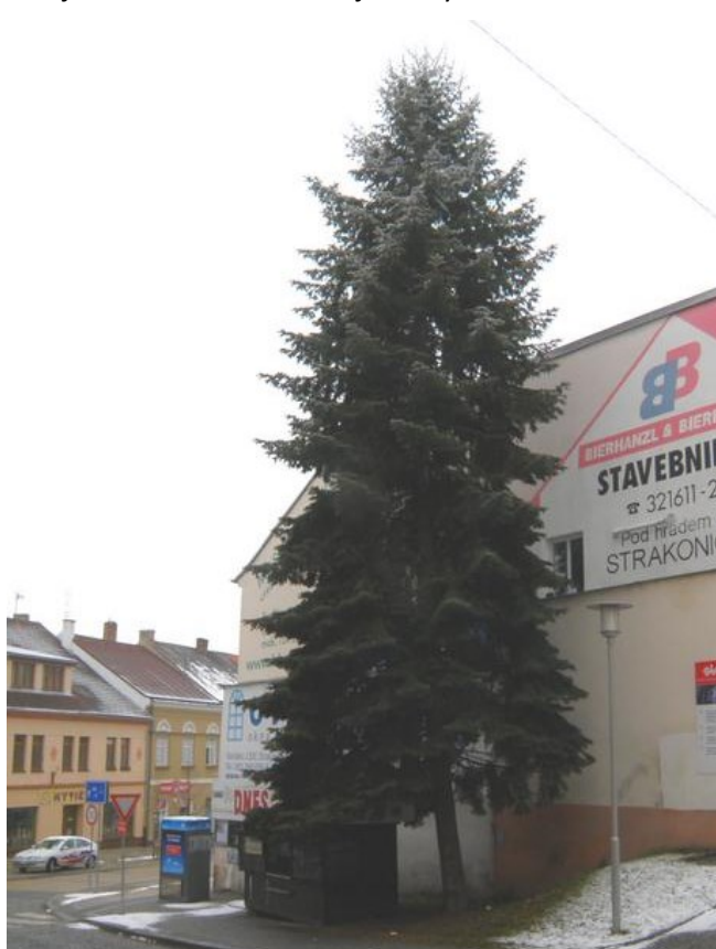
Jedle ojíňená ( Abies concolor ) před domem v Hrnčířské ulici

Je další z hojnějších druhů jedlí. Většinou nás zaujme svým vzrůstem a delšími, ojíňenými jehlicemi. Když uvidíme hladší borku, máme takřka jistotu, že stojíme před tímto