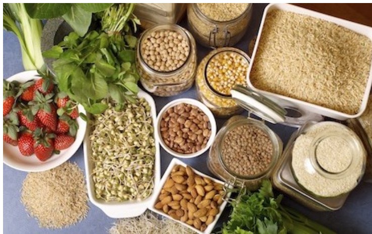
Rostlinné potraviny bohaté na železo

Rostlinné zdroje železa mají přirozeně nižší vstřebatelnost, neboť se v nich prvek vyskytuje ve složitějších chemických vazbách. Důležitou roli zde hrají vysoké objemy těchto potravin (zvláště u lidí, konzumujících stravu na rostlinném základě) a také některé postupy v úpravě potravin, které mohou dostupnost železa výrazně zvyšovat. Patří sem např. kvašení, namáčení nebo klíčení. Významným a opomíjeným faktorem pro vstřebatelnost železa je vitamín C. Pokud doprovází pokrm s obsahem železa, může vstřebávání minerálu zvýšit až v řádu několika desítek procent. Čerstvé ovoce nebo zelenina ke každému jídlu tak může zasahovat do konečné podoby zásoby železa významným způsobem.