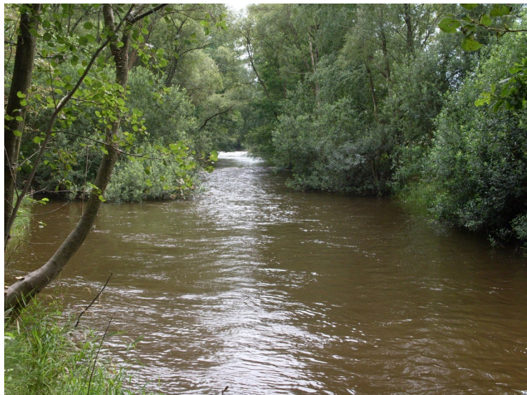
Řeka Blanice nedaleko Vodňan

vém, památném perspektivu. My jsme skrze jeho sklo nikdy mnoho neviděli, ale on pomocí své fantazie viděl výborně. Krakov viděl jako na talíři s Radhoště, i do Lvova, a daleko ještě na Rus rozeznával vesnice... Básníkem byl Otakar Mokřý opravdovým, hlubokým a zůstal jím do smrti. Nejen tím, co psal, ale vším, co myslel, co cítil, v co věřil...“