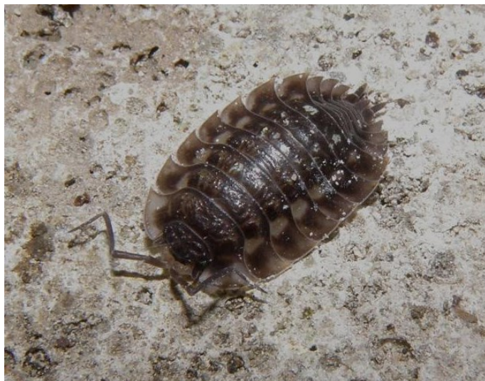
Stínka zední (Oniscus asellus) v jednom z radomyšlských sklepů