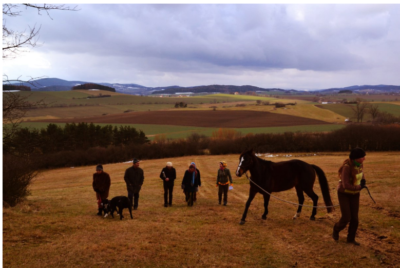
Při procházení budoucí stezky, foto Tereza Břeňová

Cílem „Stezky stromů“ je zvelebit prostor a vytvořit příjemné místo pro odpočinek i vzdělávání se. Obohatit krajinu o výsadbu stromů. Vysadit původní či zajímavé stromy a keře, které do volné krajiny patří. Ovocné stromy a keře budou sloužit jako potrava nejen kolemjdoucím lidem, ale také v krajině žijícím zvířatům, a tím vytvářet a podporovat jejich přirozené prostředí k životu. Do stezky zahrneme i stromy, které v krajině již rostou a jež jsou ukázkou pestrosti přírody či její zajímavostí a dominantou. Vytvořením kruhového stromového kalendáře inspirovaného keltskou tradicí zkusíme procítit spojení se stromy a jejich kvalitami pro život. Společným sázením stromů, do kterého jsou všichni zváni, chceme rozvíjet kreativitu, lidskou tvořivost a vztah lidí k místům, jež obývají. Doufáme, že zapojením široké veřejnosti do výsadby stromů zvýšíme jejich zájem o stromy a zeleň.