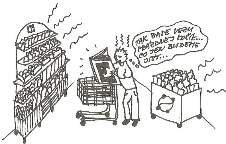
Kresba Ivana Jonová