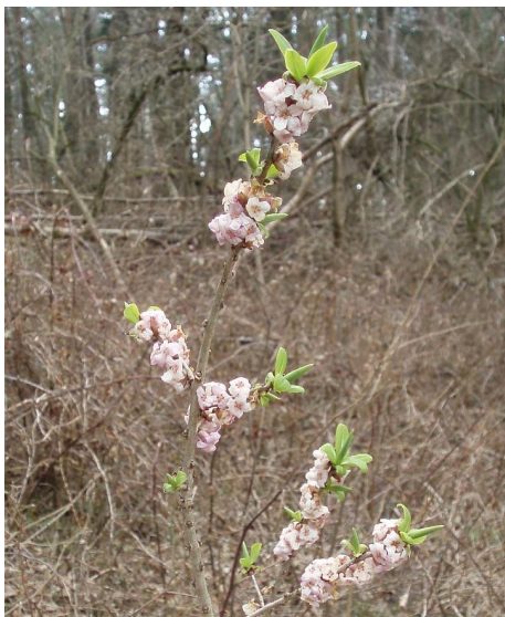
Lýkovec jedovatý