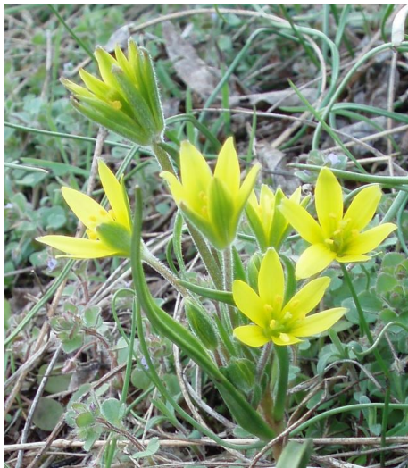
Křivatec rolní

V přírodě na Strakonicku toho v březnu kvete teprve poskrovnu: v lesích kolem Strakonice začíná rozkvétat lýkovec jedovatý (např. v lese Ryšovy a na vrchu Tisovníku), jaterník podléška, sasanka hajní, hrachor lecha, bika jarní, violka chlumní, kolem řeky Otavy a Volyňky můžeme koncem března pozorovat rozkvétající orsej jarní, devětsil lékařský, dymnivku bobovitou, mokryš střídavolistý, pupkovec pomněnkovitý, hluchavku skvrnitou. Koncem března se začíná kolem Strakonice objevovat také kvetoucí devětsil bílý, osívka jarní, huseníček rolní, mochna jarní, podběl lékařský či různé druhy rozrazilů (např. rozrazil laločnatý, rozrazil břechtanolistý, rozrazil trojklaný). Mezi jedny z nejkrásnějších rostlin můžeme na Strakonicku koncem března spatřit rozkvétající křivatec (křivatec luční, křivatec rolní a křivatec žlutý). V dubnu se objevují v přírodě již desítky kvetoucích druhů rostlin a začíná to pravé jaro pro milovníky květin... Ing. Radim Paulič