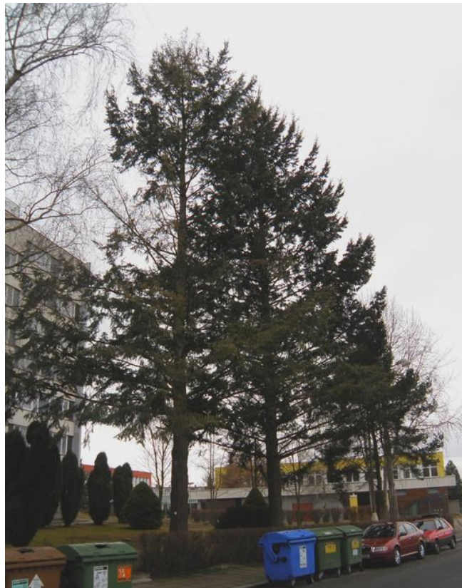
Douglaska tisolistá před panelovými domy v Máchově ulici ve Strakonících

glasku tisolistou spatřit různě po městě. Mohutné stromy jsou před panelovými domy v Máchově ulici nebo v parčíku neda-leko pošty u vlakového nádraží.