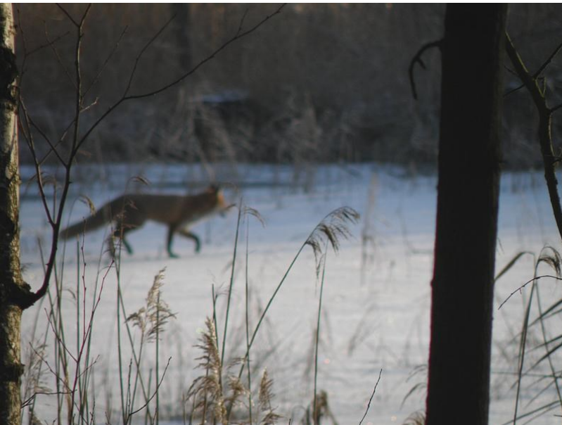
Liška obecná – PR Řežabinec – 28. 2. 2013

Když jsem čítával první pohádky, narazil jsem často na příběhy o lišce a jejích přátelích. Většinou byla liška prezentována jako vypečený tvor, který svou prohaností přechytračil ostatní zvířátka. Kdo nevěří, ať si přečte třeba nějakou starou knížku. Ostatně ve středověku označení „liška ryšavá“, napasované na lidskou osobu, bylo jednou z těch horších nadávek. Postupem času jsem se pobytem v přírodě naučil lišku poznávat a občas i nenadále spatřit. Liška obecná ( Vulpes vulpes ) je tvorem, který mnohdy žije blízko nás. Dovede se svými požadavky přizpůsobit jak světlému lesu, tak háji, pískovně nebo volné krajině, ale také blízkosti lidského sídla. Její potravou jsou většinou zajáci, králíci, hlodavci, drobní ptáci, hmyz. V nouzi nepohrdne ani zdechlinou. Uvádí se, že občas pozře i ovoce. Nyní, při odchodu zimy, se s ní můžeme setkat ve volné krajině častěji, protože probíhá její říje. Ostatně mnohdy v krajině při svých procházkách ucítíme na některých místech podivný zá-