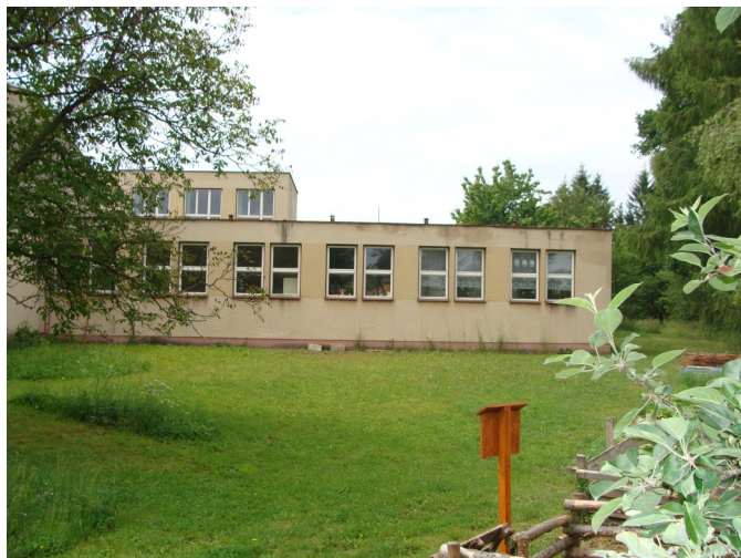
Lokalita zvolená pro výstavbu tůně

mosti v praxi. Budou zde zkoumat a pozorovat živočichy, kteří se v dnešní přírodě vyskytují poměrně vzácně, současně budeme monitorovat postupné změny a vývoj celé této lokality. Toto stanoviště se zároveň stane nedílnou součástí naučné stezky budované na školní zahradě našimi žáky. Marie Linhartová