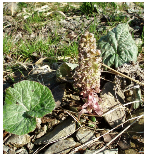
Děvetsil lékařský, foto Radim Paulič