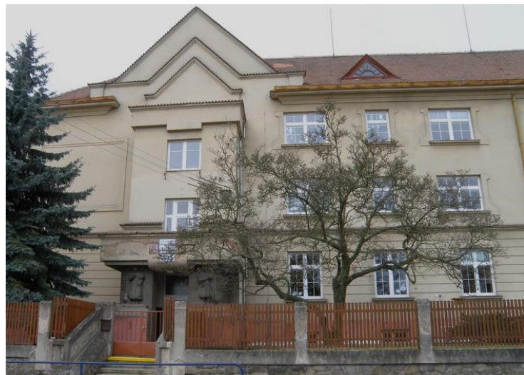
Šácholan Soulangeův před budovou Zvláštní školy v Plánkově ulici ve Strakonících