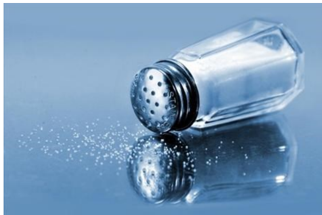
Sůl - potřebná i nebezpečná

Hořčík - podobně jako ostatní probírané minerály má i hořčík v organismu celou řadu rozmanitých funkcí. Jeho zásoby v potravinách jsou do velké míry závislé na způsobu jejich pěstování a zásobení půdy tímto minerálem. V systémech intenzivního zemědělství, při kterém dochází k vyčerpání půdy, je hladina hořčíku v potravinách nižší než v extenzivnějších systémech ekologického zemědělství. Nedostatek hořčíku ve výživě může způsobit komplikace v metabolismu jiných prvků, svalové křeče, slabost apod. V rostlinné stravě jsou jeho hlavními zdroji ořechy, celozrnné obiloviny a čerstvá zelenina. Živočišné potraviny obsahují hořčíku méně než celá řada kvalitních rostlinných pokrmů.