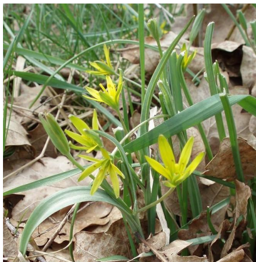
Křivatec luční