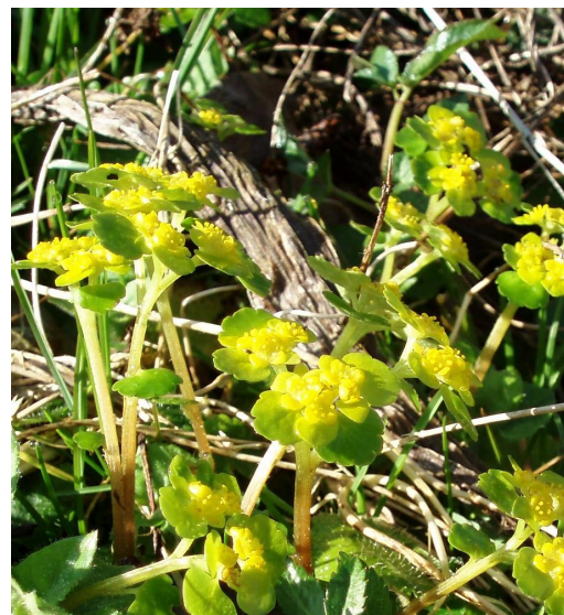
Mokryš střídavolistý