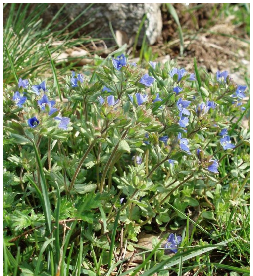
Rozrazil trojklaný, foto Radim Paulič