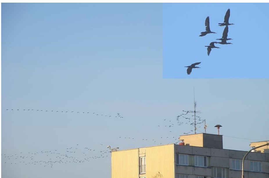
Kormorán velký ( Phalacrocorax carbo) – Strakonice, nad Heydukovou ulicí – 20. 3. 2013 – cca 250 jedinců