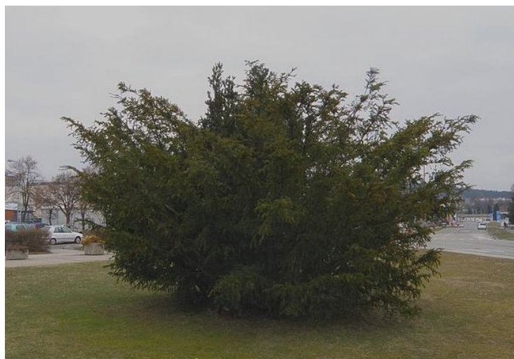
Tis červený před jídelnou Stravbytu ve Strakonících

Tis červený je jedna z původních domácích dřevin, která se u nás dříve vyskytovala hojněji. Dnes se většinou jeho rozšíření omezilo na parky a háje. Ve volné krajině jej najdeme málokdy. Velmi často se s tisem setkáme jako s dlouhověkovou dřevinou. Za zmínku stojí 500 let starý tis u Kropáčova v Lužických horách nebo seskupení tisů v PR Netřebské tisy. Samotný tis může vystoupit až do výšky 1000 m. Jeho dřevo se často používalo na výrobu luků a pružných dřevěných součástí, protože je ohebné. Samotný tis snese silné ořezávání, je schopen obrazit i z pahýlů, ale trvá to dlouho a výsledkem je něco zmrzačeného. Jeho plody, tisinky, jsou požitelné. Ptáci je v zimě po namrznutí zobou, ale pokud tyto plody zakvasí, mohou být pro zvířata opojné. Viděl jsem holuba, který se po nich pěkně motal, neschopen létat. Jinak celý keř, případně strom, je vyjma zmiňovaných tisinek jedovatý.