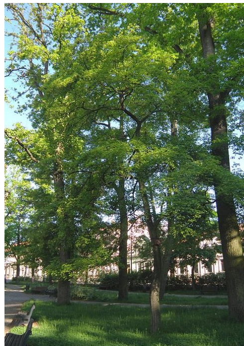
Javor babyka v Rennerových sadech ve Strakonících

Javor jasanolistý je u nás cizincem. Jeho původním kontinentem je Severní Amerika a je stromem, který se intenzivně šíří. Do Čech byl introdukován v roce 1835. Není stromem velkým. Dosahuje výšky asi 15 m. Starý strom má rozložitou korunu. Borka je šedá až šedohnědá, zbrázděná. U mladého stromu je kmínek světle šedozelený, jakoby voskovaný. Stejně tak větvičky. Nažky visí na dlouhé stopce v seskupeních přetrvávajících i přes zimu. Listy jsou podobné listům jasanu, vstřícné, lichozpeřené, pilovitě obroubené s konečným lichým listem. Ten je se třemi laloky,