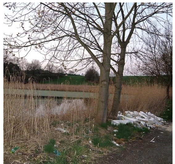
Stavební suť u rybníku Rakovák – vleklá rakovácká skvrna