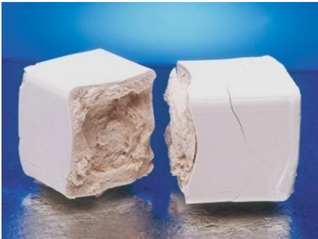
Droždí - významný zdroj vitaminů skupiny B

Vitamin velmi důležitý pro krvetvorbu a správné fungování nervové soustavy. Je zvláštní svým specifickým působením v organismu a také miniaturními množstvími, kterými se těchto pochodů účastní. Nedostatek se projevuje snížením duševní výkonnosti a poruchami krvetvorby. Informace o tomto vitaminu (zejména v souvislosti s jeho absencí v potravinách rostlinného původu) se v mnoha zdrojích rozcházejí. Někteří autoři uvádějí jeho určité zastoupení v bakteriálně kvašených rostlinných potravinách, jiní jeho vstřebatelnost z produkce vlastní střevní mikroflóry. Zásoba vitaminu v játrech zaručuje jeho zdroj přibližně na dobu 5 – 10 let. Do hry zde také vstupuje různý metabolismus tohoto vitaminu a možnost velké adaptace na jeho nedostatek. Přes všechny tyto argumenty se pro lidi, žijící se striktně rostlinnou stravou, doporučuje konzumace vitaminem B 12 obohacených potravin nebo suplementace (tzn. doplňování z dnes už většinou přírodních preparátů). -jj-