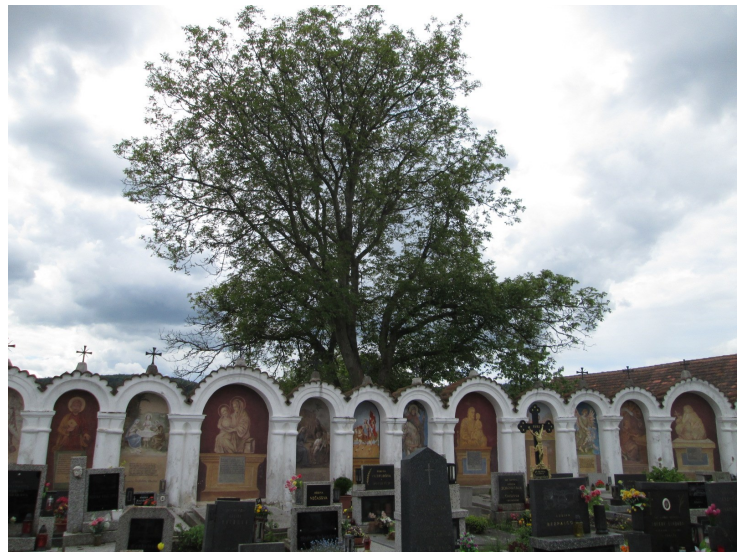
Výklenky s obrazy a verši, Albrechtice n. Vltavou