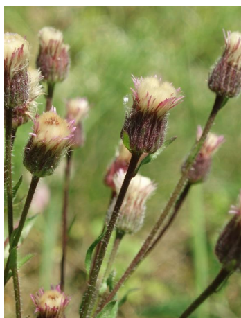
Turan pozdní