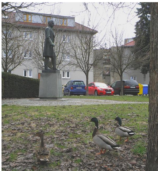
Kachna divoká a parčík u sochy F. L. Čelakovského

Dnes se pouštím do psaní o druhu živočicha, který vyvolá u mnohých úsměšek nebo otázku: to si snad jiného tvora vybrat nemohl, pisálek jeden? Mohl, ale možná nechtěl. Píší o kachně divoké ( Anas platyrhynchos ) z obdivného důvodu. V našich Strakonících je takřka všude. Na jaře se prochází hluboko ve strakonických ulicích. V létě vyvádí svá kachňata například na Podskalí. Na podzim prchá z rybníků před myslivci na soutok Otavy a Volyňky a zima je poznamenána její přítomností na plácku před obchodním centrem Labuť a na parkovišti u Billy. Takže se nám skutečně plete všude. A lidi si jí všímají. Někteří jen projdou, jiní občas něco utrousí a hlavní těžiště zájmu o kachny se přesune na děti. A děti pozorují a krmí rády. Zejména na jaře a v létě je barevný kačer pro ně přitažlivý. A co teprve malá, promenující se kachňata na zeleném trávníku.