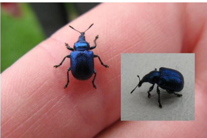
Zobonoska révová, foto Eva Legátová

V nejnovějším čísle přírodovědného časopisu Živa ( 2/2013 - lze půjčit v ŠK Strakonice), je článek o zajímavých nosatcovitých broucích zobonoskách. Minulý rok jsem psala v Kompostu č. 10/2012 na str. 8 o setkání se zobonosku lískovou ( Apoderus coryli ). 28. 12. 2012 jsem náhodou našla pod listím u zdi chano- vického zámeckého parku jinou krásnou zobonosku – zobonosku révovou ( Byctiscus betulae ). 1. května 2013 jsem ji potkala opět – tentokrát na louce poblíž PP „Kozlovská stráž“ (PP „Kozlovská stráž“ – viz článek Ing. Radima Pauliče v Kompostu č. 5/2012 ).