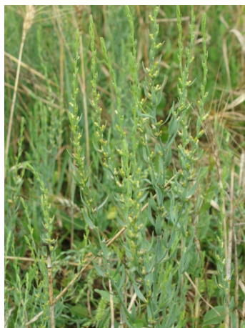
Vrabečnice roční

obecnou ( Lacerta agilis ). Pravidelně zde hnízdí jeden pár ťuhýků obecných ( Lanius collurio ). V několika částech této cenné lokality expandují agresivní druhy dřevin (trnka obecná) a druhy trav (třtina křovištní, ovsík vyvýšený). O chráněné území je však dobře pečováno dobrovolníky z řad ČSOP Strakonice a třtina křovištní je několikrát ročně kosena a likvidována. Trnka je odstraňována především na svazích opuštěných vápencových lomů a v hraničních částech území. Ing. Radim Paulič, ZO ČSOP Strakonice