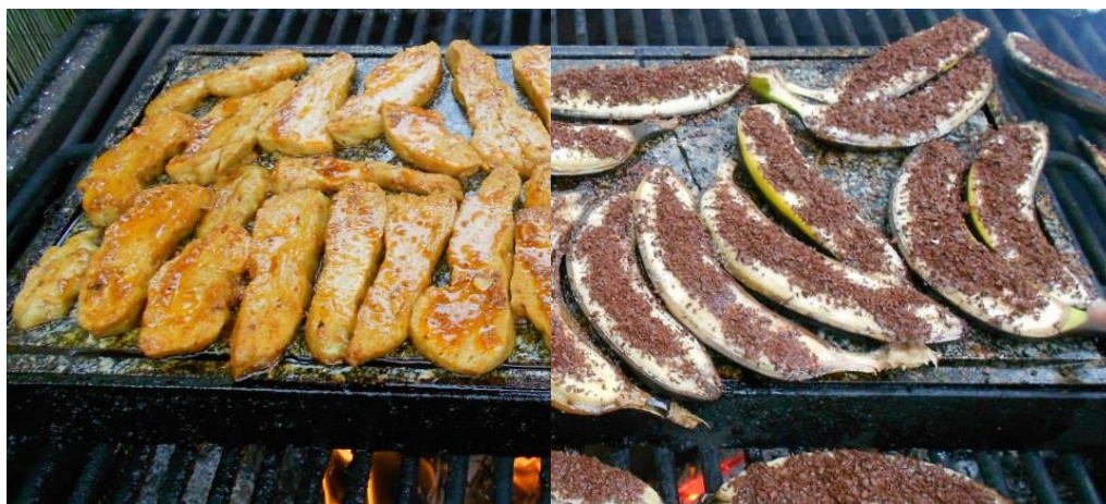
Seitan (pšeničné „maso“) s hořčicovou marinádou a banány v čokoládě

Při grilování rostlinných potravin můžeme zapojit fantazii a grilovat vše, co v kuchyni tepelně upravujeme na pánvi nebo v troubě. Kromě obligátní zeleniny tak můžeme využít všechny rostlinné alternativy masa, které jsou na trhu k dostání. Dále nejrůznější placky, plátky, karbanátky, bramboráky, topinky, špízy a mnoho dalšího. Potraviny můžeme nakládat, balit dolobalu. V receptech jsme se zaměřili hlavně na způsoby ochucování a doprovodné omáčky, neboť se surovinami použitými ke grilování už jsme se setkali (na kurzech i v receptech). Objevili jste během léta zajímavost z oblasti zdravého grilování? Podělte se s námi a s ostatními čtenáři!