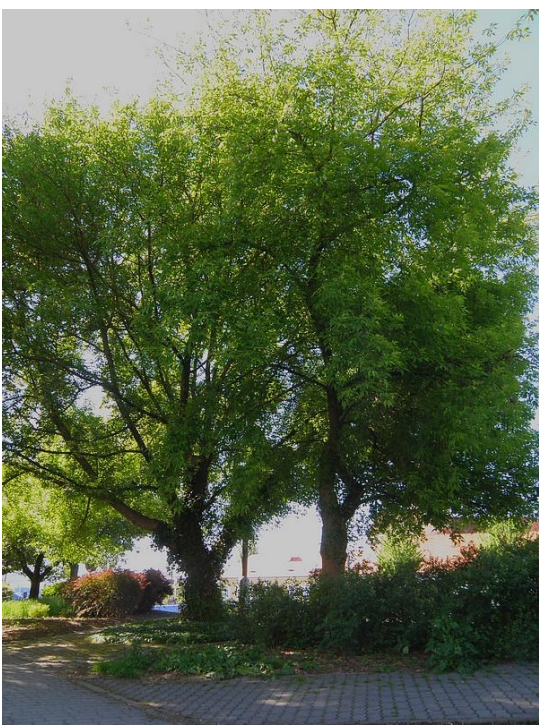
Javor jasanolistý v parčíku u kostela sv. Markéty ve Strakonících

V době psaní tohoto článku byly javory ve vrcholu svého kvetení. Javor babyka své květy nenápadně ukrýval mezi malými, pětilaločnatými listy, takže spíše vypadaly jako drobný světlý hmyz na zelené stopce. Javor babyka je naším původním druhem. Vyskytuje se spíše v nižších polohách, ale může vystoupit do výšky 900 m. n. Má rád jílovité nebo sypké půdy, ale v městském prostředí snese i hrubší zacházení. Jeho plody jsou podobné nažkám javoru mléče, ale jsou drobnější a více rozevřené. Borka je jemněji rozbrázděná než u javoru mléče. Podle druhového latinského názvu by měl javor babyka být v naší krajině druhem běžným. Snad možná v podobě různých kultivarů. Pak bývá použit jako nepříliš vzrostlý strom do ulic a parků. Ale „pravověrných“ javorů babyk v našem městě moc není. Jednu z nich naleznete v Rennerových sadech, v jeho spodní části na úrovni bývalé „hasičárny“.