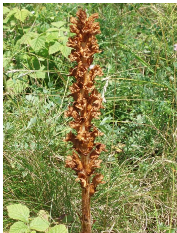
Záraza zardělá