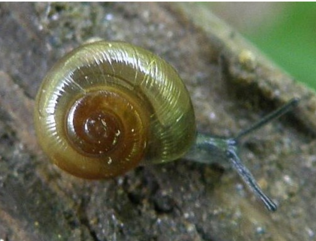
Blyštivka rýhovaná - méně známý drobný měkkýš (3 - 4 mm)

Na části skály vedoucí do vody je možno najít některé zástupce měkkýší fauny jako např. vlahovku narudlou, jantarku obecnou, páskovku keřovou ale i všude přítomného hlemýždě zahradního. Vlhčí partie jsou občas protkány květy slézu lesního. Řeka je zde silná, prudší, ale plynulá. Naproti této skále, kde se kdysi nalézala velká tůň, je dnes naplavenina písku mezi stromy a keři, a tak zaniklo jedno z míst, kde se nechali chytat líni, plotice, cejni, „protivní“ ježdíci a v době větší vody i kapříci. Zmizela tak také lokalita, kde se vyskytovali okružákovití a plovatkovití šneci.