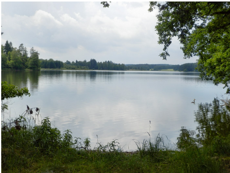
Rybník Velká Kuš

SEKYRA, Jiří: Rybníky na Blatensku, Blatná, 2000.