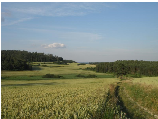
Ohlédnutí doslovné - PP Sedlina a vrch Zbuš

Dne 17. 7. 2013 to bylo s účastí na brigádě na PP Pastvina u Přeštic lepší. Kromě tří členů naší ZO 20/01 ČSOP Strakonice přišli i tři nečleni. Naše navýšené pracovní síly jsme hned využili k rozšířenému ručnímu trhání invazní třtiny křovištní na dně lomu a hlavně k odstranění nepříjemně se šířící komonice bílé. Závěr brigády byl po uskladnění „zelené hmoty“ zakončen třešňobraním v aleji u Slaníku. -vh-