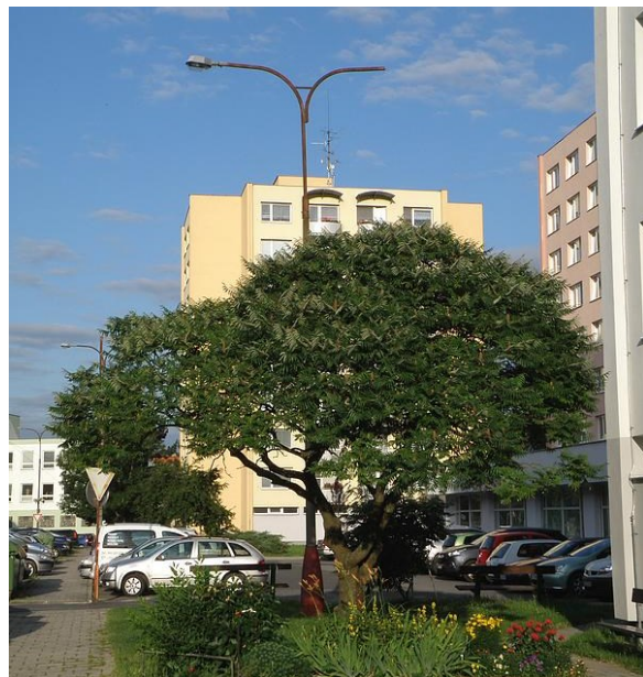
Škumpa očetná v Tržní ulici ve Strakonících, foto -vh-

Šetřil jsem si popis tohoto stromu původně na zimu. Je stromem natolik typickým, že je možno jej poznat snadno i bez listů. Ale když jsem sekal zahradu a díval se po okolních pozemcích, všiml jsem si, jak škumpa vystrkuje své pomyslné růžky ze země. Přišel její čas množení a s ním i možnost určitého lidského soucítění a otázky, kam s ní. Mladých stromečků škumpy je lidem líto, a tak je občas ponechají růst jen tak nebo je i zasadí někam do svého okolí. Dokonce jsem viděl i zasazení škumpy v oblasti jedné přírodní památky na Sušicku.