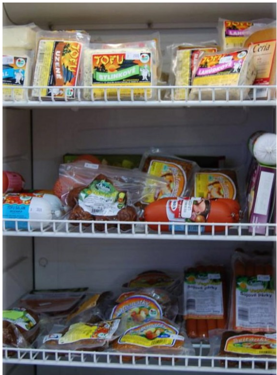
Chlazené zboží v nabídce jednoho z obchodů zdravé výživy

Osobně nejsem příliš velkým zastáncem vaření podle receptů. Při znalostech několika základních gastronomických postupů a fantazii při kombinování surovin vytvoříme nepřeberné množství zajímavých jídel. Proto se ani při nákupu nedržím předem daných seznamů. Snažím se, abych měl v zásobě co možná nejrozmanitější přehledku surovin (tak říkajíc od každého něco), aby se v každé chvíli dal vytvořit libovolný pokrm s řadou možností úprav. Zbytek ponechávám na aktuální nabídce, sezónnosti některých produktů, náladě atd.