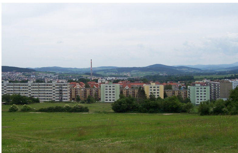
Strakonice od severu s částí panelové zástavby