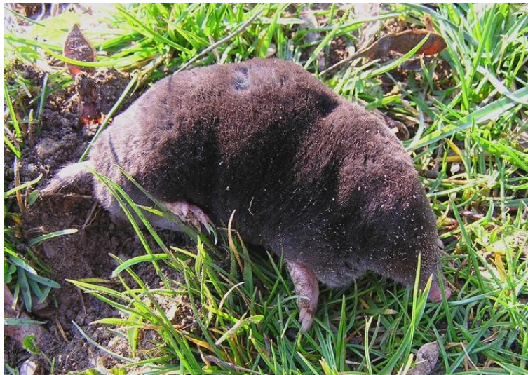
Krtek obecný v Bavorově

krtek nevědomky škodí svým rytím, tak jej chytit, odnést několik stovek metrů dál na podobné stanoviště a tam pustit. Mimochodem krtek velmi dobře plave, takže překonat drobnou vodní plochu pro něj není problém. Vyfotografovaný krtek byl zastížen při zdolávání železničního svršku.