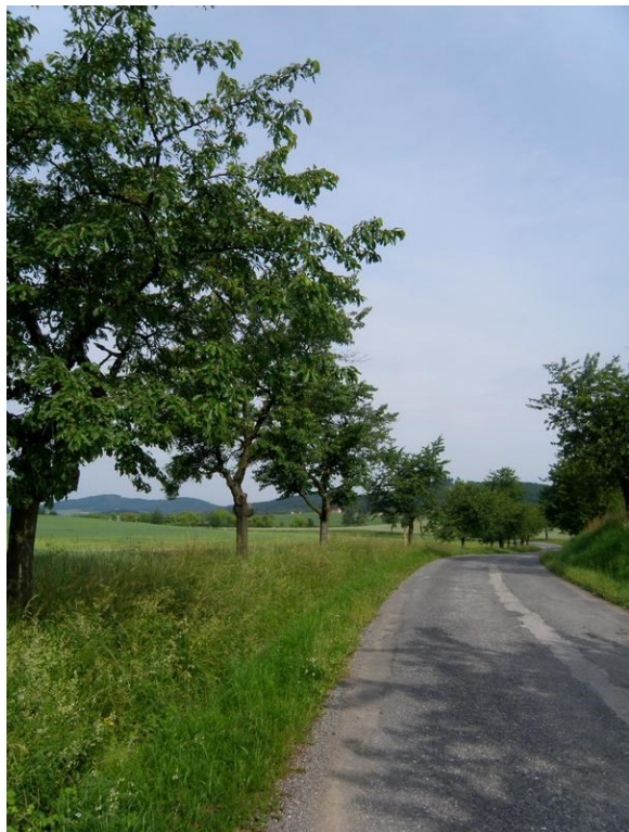
Třešňová alej od Písecké silnice ke Slaníku, foto -vh-

Škumpa sama o sobě roste v našich přírodních podmínkách dobře. Kde je světlo a trochu vlhko, daří se jí. Její lichožpeřené listy a plstnaté větvičky působí ozdobně a dojem je ještě umocněn na podzim, kdy se strom rozsvítí sytými červenými a žlutými barvami. Někdy na přelomu podzimu a zimy škumpa upustí své oříšky umístěné v červených latách. A pak se z nich začne množit.