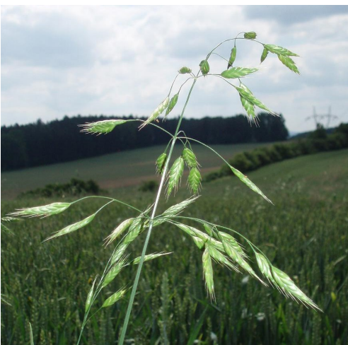
Sveřep stoklasa

Sveřep stoklasa – také zvaný sveřep žitný či sveřep obilný ( Bromus secalinu L.) – je jednoletá ozimá tráva, vysoká až 120 cm.