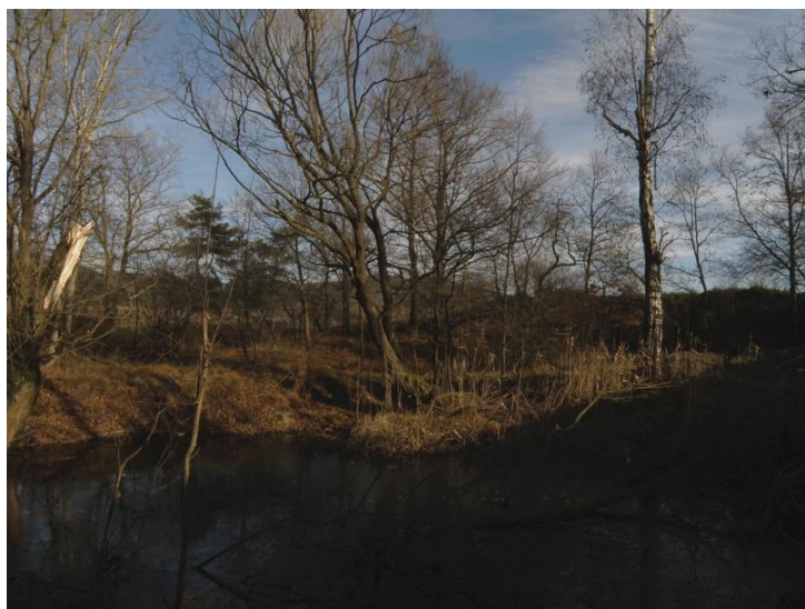
Lomeček u polní cesty do Řepice

Někdy se mně zdá, že naše strakonická kotlina bývá uzavřená slunečnému počasí více než okolí našeho města. Potvrzují to i zkušenosti z výletů na Volyňsko, Sušicko a snad i Blatensko. O to více většinou vítám dny, kdy se krajina prosvětlí sluncem a je lepší možnost vyjít si do krajiny. Někdy stačí jít jen krátce, třeba do údolí Řepických rybníků. Už jen cesta z města po Radomyšlské silnici může být zajímavá, pokud si všimneme dvou moruší černých u lomu v úpatí Šibeničního vrchu, nedalekých božích muk nebo v jedné ze soukromých zahrad statných kaštanovníků setých. V ohybu zmiňované silnice se nám náhle