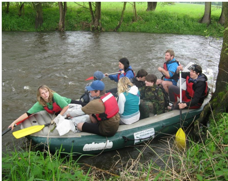
Uklidme Volyňku - květen 2013

su povolování kácení dřevin rostoucích mimo les. Snažíme se, aby byl velký důraz kladen zejména na ekologické funkce dřevin ve městech, ale nepodceňujeme ani otázku bezpečnosti pohybu lidí pod korunami stromů. Řízení probíhají v období vegetačního klidu od 1. 10. do 31. 3. Pro účast na nich je podmínkou členství v naší organizaci, protože o přítomnost na těchto řízeních musíme žádat jako občanské sdružení dle příslušného zákona.