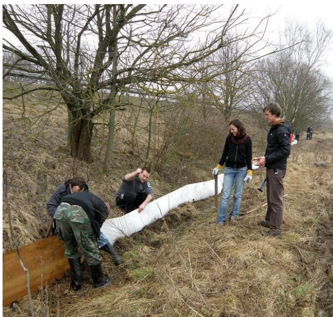
Ochrana obojživelníků - stavění zástěn při Volyňské silnici

Jaro je ve znamení migrace obojživelníků a naší největší akce – transferu žab na Volyňské. Pro základní představu viz článek v Kompostu č. 4/2012 str. 2. Akce na stavění zástěn bude zorganizována dle průběhu jarního počasí někdy na počátku března. Zabere několik málo hodin, a pokud se vydaří počasí, je i příjemná. Po započítání tahu je pak nutno zástěny každý den při soumraku obcházet, žáby sbírat a přenášet za silnici k „pářícímu“ rybníčku. Časová náročnost je 1 – 2 hodiny. Co a jak, to se dozvíte od nás přímo na místě. Domlouváme jednotlivé dny, abychom síly dobrovolníků účinně rozložili. Pokud bude dostatek zájemců, budeme vyjíždět i na některé další vytipované lokality (u Nebřehovic, Řepice, Kapsovy Lhoty...) a žáby zde (už bez stavby zástěn) za soumraku přenášet. Pro více informací se nám ozvěte nebo sledujte naše informační cesty. Pomoci nám můžete také nahlášením lokality, kde probíhá tah žab přes komunikaci.