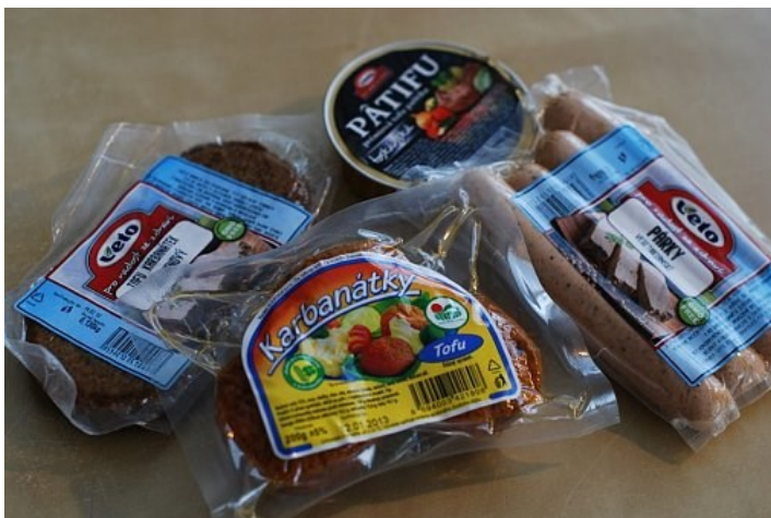
Rostlinné alternativy masa - ideální pro rychlou přípravu jídel náctiletým

Přibližně od dvou let věku se děti dostávají do důležité fáze, která formuje jejich pozdější stravovací návyky. Stejně tak důležitá jako složení jídelníčku je i schopnost rodičů děti jídlem zaujmout a motivovat je ke spolupráci v kuchyni. Základem by pro ně měl být vzor ve správně se stravujících rodičích s ohledem na osobní preference každého dítěte. V dnešní době je již možné využívat nepřeberné množství rostlinných alternativ masa a masných výrobků, které mohou zabránit vyčleňování specificky se stravujících dětí z kolektivů. Pro sestavování jídelníčku platí některé všeobecné zásady probírané již v minulých částech seriálu i některé zvláštnosti týkající se stěžejních živin.