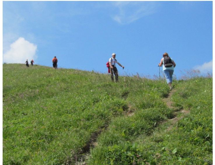
Pravidelný pohyb ve vyšším věku - základ pevného zdraví