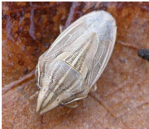
Kněžice nosatá z lomečku u Řepice

Čas na zmiňovaném místě utíká rychle, a to i v zimě. Co teprve za tepla na jaře či v létě. Přemýšlel jsem tam, jak asi ten čas utíkal lidem, kteří zde lámali kámen. Možná ještě rychleji než mně, jak se to většinou při práci děje. Co napsat závěrem? Lomečků v krajině ubývá. Dělo se tak skoro s každou dírou do země. Lid má podivnou vlastnost, vzít si ze země, co potřebuje, a potom se „odvděčit“ tím, co nepotřebuje. I toto má svá pro a proti. Nebýt zasypaných hradní studní, středověkých příkopů či dolů, věděli bychom toho o našich předcích méně. Naštěstí naši předkové používali většinou přírodní materiály, které se chovají k prostředí lépe než naše ropné, nerostné a umělohmotné produkty. Vlastně ještě jedna poznámka na konec: k lomečku není udělaná cesta - pokud tam půjdete, choďte za sebou. Jdete přes živé pole, byť krátce, a také zřejmě i přes soukromý pozemek. -vh-