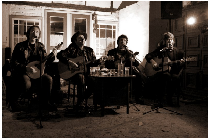
Two dollar bash

Dívám se na Strakonice méně kriticky než Petr, ale musím uznat, že něco na jeho tvrzení je – už jen proto, že pokus vytvořit kulturní prostor Mravenčí skála se tehdy nepovedl, i když se o něj skoro tři čtvrtě roku poctivě snažila opravdu velice sympatická parta převážně mladých schopných lidí a nabízená představení patřila k tomu nejlepšímu, co bylo jen možné si přát. Bohužel, kromě nedělních akcí pro děti bývalo hlediště většinou zaplněné jen zčásti nebo dokonce poloprázdné. Co se dalo dělat... Něco dělat se ale může vždycky, a tak se každou chvíli něco nadějného objeví a třeba se povede i to, že zájem veřejnosti bude postupně lepší a lepší. Možná zrovna tenhle rok, co právě začíná, bude přelomový – co my víme... Jestli na tom záleží i vám, na následující stránce si přečtěte, co pro vás Petr Kalaš napsal o kulturním magazínu „Semtam“ a uvidíte, že se zase jednou někde něco rozběhlo, z čeho můžeme mít radost. -ah-