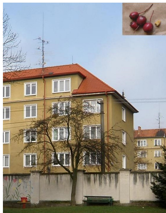
Hloh jednosemenný nakukující přes zeď do Smetanovy ulice ve Strakonících