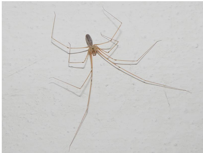
Třesavka obecná z domácího chovu

flíčků. Pouze její střed je zabarven větší skvrnou, která má v sobě světlou linku. U třesavky sekáčovitě jsem vyzpozoroval blízkost složených oček s očky umístěnými ve středu. Ta je menší než průměr oček. Skoro se dotýkají. Centrální skvrna v hlavohrudí je užší a hlavohrud' je s více flíčky. Zadeček je protáhlý, většinou více válečkovitý. Velikost tělíčka je do 6 mm a u třesavky obrovské do 11 mm. Tolik o pozorování shora. Zesponu jsem tyto druhy nepozoroval, maje úctu k jejich dlouhým křehkým nožičkám, nechuti ležet na zádech a nervozitě projevené třesením při vyrušení. Uvádí se, že tento druh třesavky se může vyskytovat ve volné přírodě (na rozdíl od třesavky obrovské). Žije zde v zavádajícím listí a loví navíc třeba chvostoskoky. Naproti tomu třesavka obrovská je imigrantem, žijícím pouze v našich domácnostech. Takže až tohoto pavouka doma nebo v práci potkáte, věřte, že pracuje třeba pro vás. -vh-