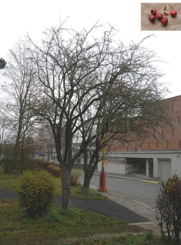
Hloh obecný při budově soudu ve Strakonících