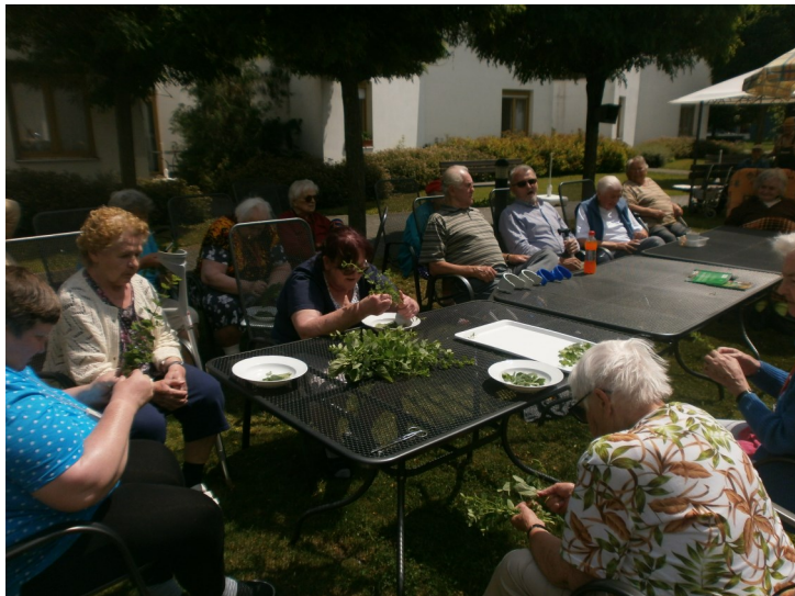
Zahrada s klienty při sběru bylin

Po těchto zkušenostech a potřebě mít takovýchto dobrovolníků více jsme na počátku roku 2013 poprosili média, aby nám byl uveřejněn článek, kde jsme vyzývali občany našeho města o pomoc v podobě dobrovolnictví. Dokud se neudělá tento krok, není možné zjistit, kolik okolo nás žije spoluobčanů ochotných zasvětit svá srdce službě ostatním.