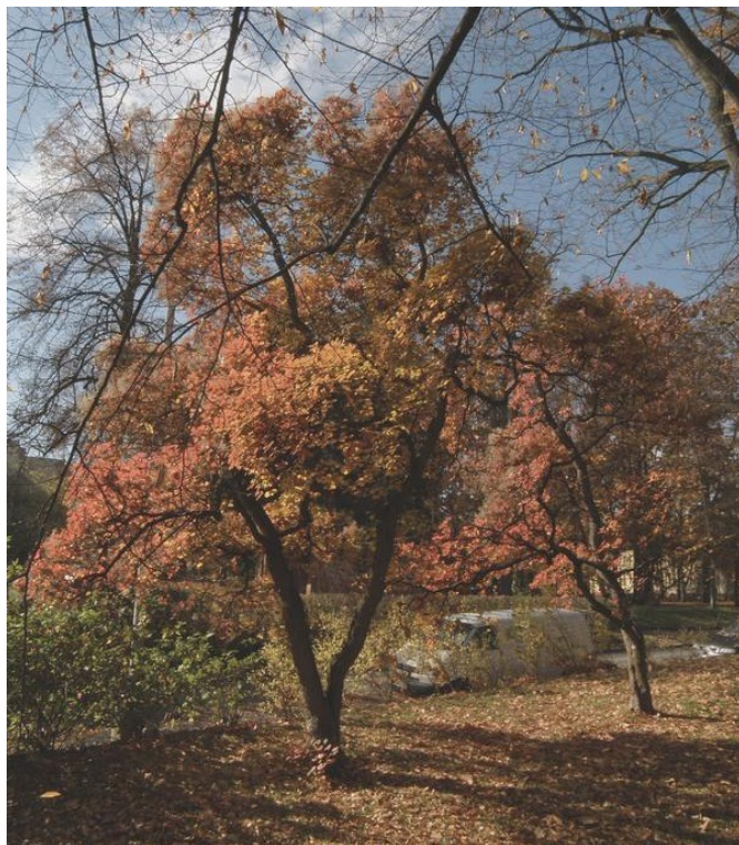
Ruja vlasatá při Sokolovské ul. ve Strakonících

Abych odlehčil zimní pochmurné období, vpustím do něj trochu květů, třebaže převážné umístění těchto stromů je v našem městě na místě málo navštěvovaném, ale často potřebném. Tedy u veřejných záchodků v Rennerových sadech při ulici Sokolovské. Zde nedaleko zmiňované užitkové stavbičky najdeme v létě čtyři kvetoucí stromy. V jižních šířkách a délkách je v květu na výsluní obletován většinou skvostným hmyzem, v noci halasí vrzáním cikád. Bohužel u nás nic. Jeho zelenožluté (nebo narůžovělé) vlasovité květy zlatohlávků a otakárky nepřivábí. Tento strom je rozšířen po Evropě a zasahuje až do Číny. Borka tohoto stromu je hladká, koruna je většinou rozložena pouze v horních partiích kmene. Větvení je řídké a jemnější než u našich stromů. Listy jsou vejčité oválné s výraznými žilkami. Ale hlavně, co nás zaujme, je květ, který na podzim přejde do červeně zbarveného plodenství, jehož zbytky přetrvávají až do zimy. Takže i při ojnění mrazíkem a osvětlení slabým zimním sluncem vypadá koruna tohoto stromu svátečně. Pro tuto vlastnost je ruja vlasatá používána v parcích či na veřejných prostranstvích již od 17. století. Ve Strakonících ji nalezneme na zmiňovaném místě. -vh-