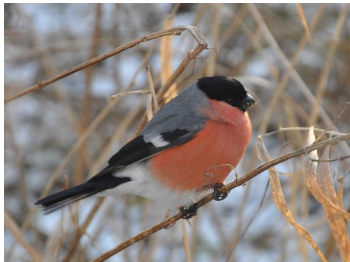
Hýl obecný u náhonu ve Strakonících

Hýl obecný není zpěvným ptákem, který je v blízkosti našich domácností běžný. Avšak chladné zimní měsíce nemění jen zvyky lidí, ale i ptactva. A tak se s tímto ptačím krasavcem můžeme setkat třeba na krmítku, blízkých dřevinách, ale také vysoko v korunách vzrostlých stromů. Přes vegetační období tento pěvec žije raději v rozvolněné krajině, v remízcích v polích protkaných vysokými stromy, odkud má patřičný rozhled. Taková místa mu splňuje třeba krajina v okolí zahrádek pod Šibeničným vrchem, u Droužetic nebo třeba hned za tratí u Staré řeky. Zde jej dříve uslyšíme, než máme šanci ho uvidět. Jeho vysoký a příjemný flétnovitý hlas je nezaměnitelný. Potom už stačí hledat červeně svítícího samečka nebo popelavější samičku. Hnízdo je postavené z trávy, mělké, umístěné v jehličnatých stromech, ale také i třeba vysoko v křovinách. Málokdy na něj narazíme. Pro mě je zajímavé sociální chování hýlů, kteří mezi sebou občas „vstřebají“ dlaska tlustozobého ( Coccothraustes coccothraustes ). To je jev velmi častý