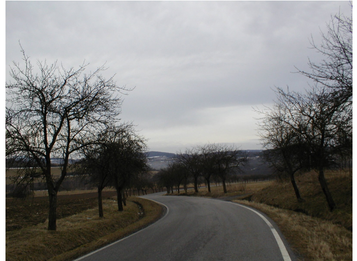
Alej u Hoštic, foto -ah-

Ve stejném duchu se snažil i sám pokračovat. Při letních táborech, které jako mladík vedl, vymýšlel pro děti stezky odvahy a výpravy za poklady, jako brigádník pomáhal v Ústavu sociální péče v Oseku, jistě by byl dobrým učitelem, kdyby se dal na pedagogickou dráhu. Odmala chtěl ale být režisérem – rozhodl se pro to v páté třídě, kdy byl vděčným divákem při promítání filmů na hoštické faře a kdy také pravidelně účinkoval ve všech možných ochotnických představeních. V devítce potom dostal jako dárek kameru – Admiru osmičku. A tak to všechno začalo... -ah-