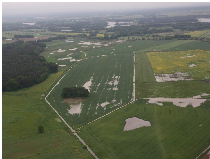
Regulovaná geometrická vodoteč na Českobudějovicku