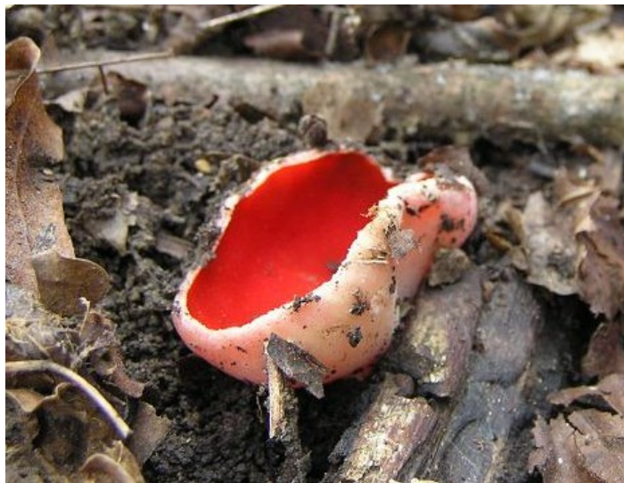
Ohnivec rakouský na vrchu Kuřidlo u Strakonice

Ohnivec rakouský jsem našla u obce Hradiště v okrese Plzeň-jih v dubnu 2013. Podle Ing. Radima Pauliče roste tato houba nejbliže od Strakonice na vrchu Kuřidlo. Ohnivec rakouský není jedlá houba. Eva Legátová