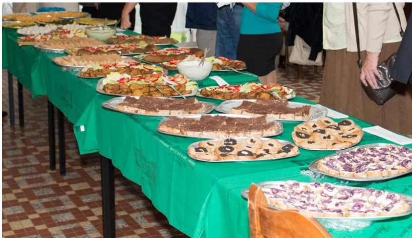
Rozmanitost rostlinné tabule, foto -jj-

Velmi podobný efekt se týká zdravotních změn po přechodu na některý z těchto alternativních způsobů stravování. Subjektivně většina lidí popisuje celkové zlepšení zdravotního stavu, pocit lehkosti, ztrátu nadbytečných kilogramů, zvýšení odolnosti, zlepšení fyzické kondice i psychického zdraví. Osobně si myslím, že označování stravy na rostlinném základě jako něčeho nedostatečného je hluboce zakořeněné paradigma, které ve společnosti přetrvává z dob dávno minulých, kdy byla konzumace živočišných potravin základním měřítkem blahobytu. Vegetariáni a vegani jsou podstatně méně sužováni nejnebezpečnějšími chorobami dneška (které ve většině případů souvisejí se způsobem stravování). Poněkud tvrdě parafrázováno – nemocnice jsou dnes plné především pacientů, kteří onemocněli důsledkem konvenčního způsobu stravování. A to nejenom z toho důvodu, že je jich několikrát více než vegetariánů. Tato skutečnost je však v našich očích zkreslená právě snahou neoznačovat pravé příčiny původu nemocí. Přesněji řečeno civilizační choroby úzce vázané na stravu jsou vnímány spíše jako něco (zejména ve vyšším věku) běžného a odmítáme si připustit, že jsou poměrně snadno ovlivnitelné změnou stravování. -jj-