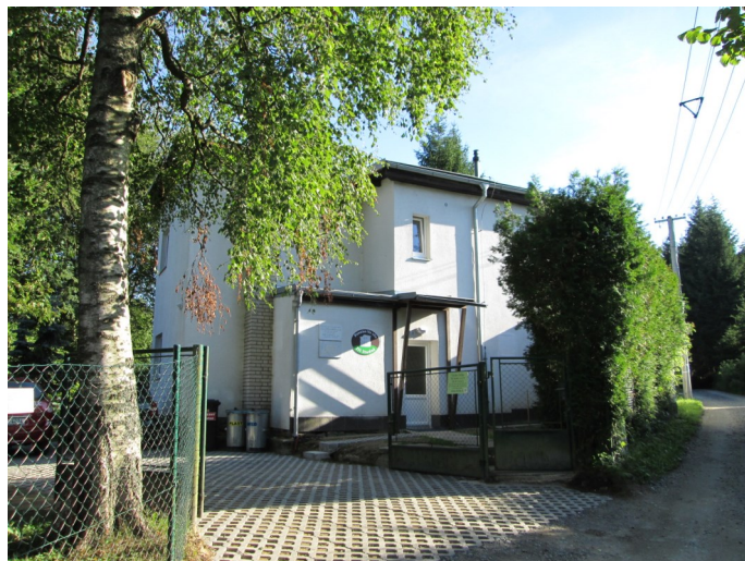
Vilka postavená pro Kaprálovy na Vysočině

Kdyby jí nebylo, o zem by se rozbilo... Miloslav Bureš