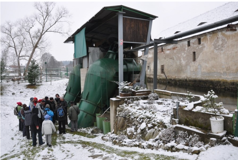
Účastníci vycházky u MVE v Katovicích

Malá vodní elektrárna vznikla přestavěním vodních kol původního mlýna. Historické záznamy o něm sahají do roku 1505 a jeho poloha je zachycena také na barevné mapě řeky Otavy z roku 1797. V průběhu staletí jej vlastnilo několik majitelů, z nichž poslední představitel rodu Polanů osadil v roce 1905 mlýn dvěma Francisovými turbínami. Ty nahradily původní vislá mlýnská kola. V současné době je jedna z nich exponátem v muzeu malé vodní elektrárny v Písku. Rodina Polanů