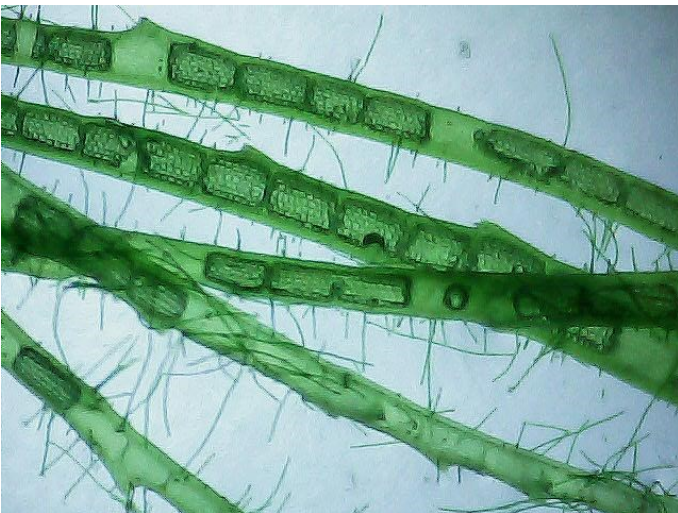
Růžkatec ostnitý, úlovek ze studeného akvária, 20 x zvětšeno

ŠPAČEK, Josef: Svět pod mikroskopem: pro kluky, holky a jejich rodiče, 1. vyd., Grada Praha, 2008