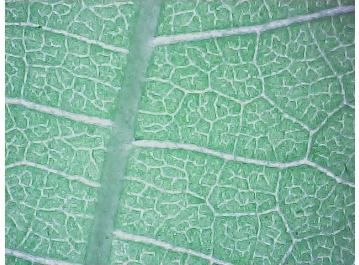
Abutilon megapotamicum - žilnatina spodní části listu, 20 x zvětšeno, foto -vh-

Pokud bychom se vrhli na podobnou tematiku přes svět knih o digitální fotografii, zcela určitě bychom dosáhli také kvalitních výsledků. Otázkou je, zde mladý čtenář unese „vědečno“,