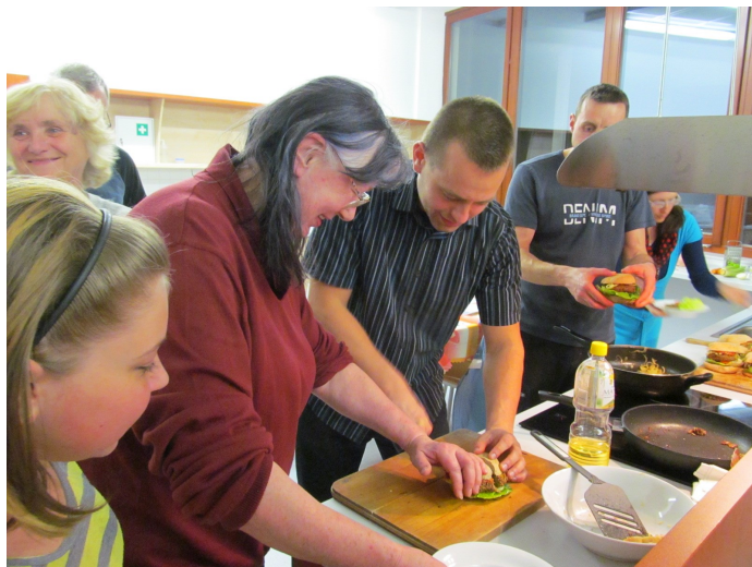
Příprava vege burgerů

malé kuchyňce v patře nad bylinkárnou U Lva a díky velkému zájmu se za čtyři sezóny rozrostly do celkem pěti kurzů s měsíční frekvencí na čtyřech místech strakonického okresu. Strakonické lekce, které jsem mohl rozdělit do dvou akcí ("začátečníci" a "pokročilí") se přesunuly do dobře vybavené cvičné kuchyňky ZŠ Povážská. Obě skupiny může navštívit kdokoli, bez jakýchkoli předchozích znalostí - rozdíl je pouze v jejich náplni - začátečnické lekce řeší jednotlivé potraviny racionální a bezmasé kuchyně, pokročilé pak konkrétní gastronomické postupy nebo tematické okruhy. Postupem času jsem byl osloven zájemci z Blatné, Volyně a Čestic a pomohl tak kurzy rozběhnout i na těchto místech. Přehled o listopadových termínech pro všechna tato místa získáte zde . Za cenu 80 Kč si krom receptů a praktických dovedností odnesete i něco málo z teorie v oblasti tvorby zdravějšího jídelníčku. Pro představu náplně kurzů pro pokročilé nalistujte str. 16. Při první letošní lekci jsme se věnovali vaření ze sezónní zeleniny.