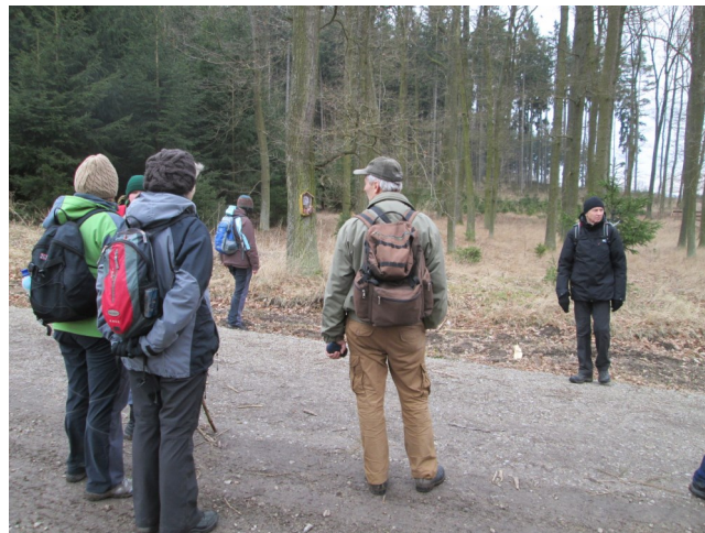
Z akce Buteo, konané na Strakonicku s účastí širší veřejnosti