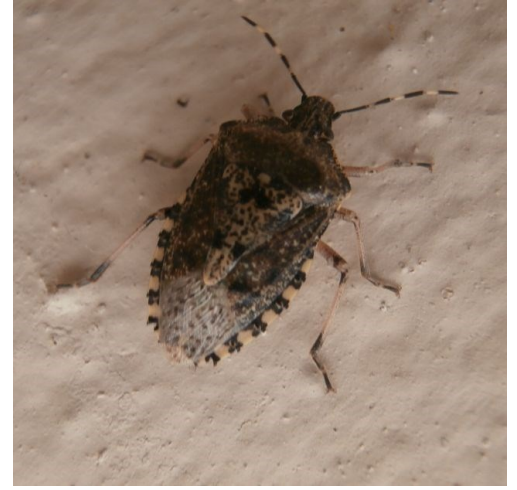
Kněžice mlhovitá

V Kompostu č. 9/2015 jsem na str. 9 v článku o kuklici Phasia aurigera zmínila kněžici mlhovitou ( Rhaphigaster nebulosa ). Tuto kněžici jsem pozorovala 27. 9. 2013 ve Strakonících v Bezděkovské ulici, 2. 10. 2013 v Plzni v Karlovarské ulici, 3. 6. 2014 v Nymburce a 21. 9. 2015 v Horažďovicích na náměstí a v Žižkově ulici. Jedná se o šedohnědou velkou ploštku s tmavými skvrnami. Vysává rostlinné šťávy, ale i hmyz nebo ptačí trus. Rozšířena je hlavně v teplých oblastech ČR. V létě žije nenápadně převážně na ovocných stromech (v Nymburce se vyskytovala v zahradě), na podzim se ukrývá do lidských sídel. Přezimuje dospělec a nová generace se objevuje od července. Dospělec se brání zápachem. Z báze zadečku vybíhá dlouhý trn, který dosahuje až k předním kyčlím. Jestli jím může kněžice bodnout člověka, jsem se bohužel nikde nedočetla a ani jsem to nezkoušela. Podrobnější literaturu o plošticích pro laiky jsem zatím neobjevila. Eva Legátová