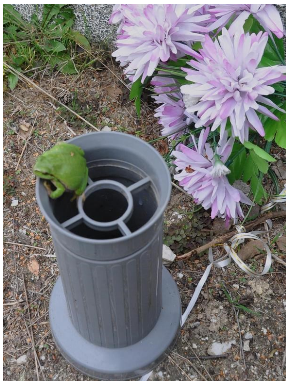
Rosnička zelená bytem ve váze na hřbitově u sv. Václava ve Strakonicih

určitě mají mrtví povyražení. Toho jsem pamětliv, a snad proto nehledím na hřbitov jen jako na místo posledního odpočinku, ale občas také místo skrytě šprýmovné a poučné. Výměna hřbitovního kvítí, zvláště toho umělohmotného, není věcí poutavou ani nijak zvláštní. I když musím připustit, že myšlenky tvůrců takových květin se ubírají zajímavými kombinačními cestami, kdy vzniknou parostliny, které jsou ve světě nevidané. A tak, když podle babiččinych instrukcí něco podobného umístíte do vázy a po čase to vyjímáte ven, pomyslíte si: „Taková paráda, a jak jí čas setřel PVC pel“ a přemýšlíte, kde nejbližší najdete popelnici na umělohmotný odpad. Jenže u míst s přídechem smrti se netřídí. Tady už je světské setříděno. O to větší překvapení, když v tomto poloprimitivním zadumání zaznamenáte koutkem oka na váze pohyb. A když se podíváte, ejhle - pod tím umělohmotným humusem rosnička zelená ( Hyla arborea ). Sedí na rantlíku vázy a mžourá do denního světla,