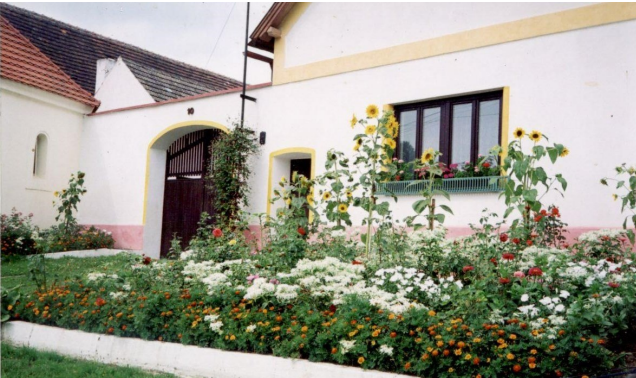
Pastva pro oko i pro včely

Je obtížné udržovat kvetoucí předzahrádky od jara do podzimu? Je to krása nejen pro pěstitele, ale pro celou vesničku, tak jako se to daří na několika místech v chráněné obci Zechovice u Volyně. Historické štíty, upravené pečlivou rukou pana Krále, různobarevné květiny – to vše potěší srdce každého návštěvníka. Jen ještě ohrazení kapličky a památníku padlým z I. světové války, kterých bylo na tak malou obec neuvěřitelně mnoho, čeká na dobré lidi, aby na tomto pozemku rozšířily krásu květin. Ti, co se nevrátili a zahynuli v cizině, by si to jistě zasloužili.