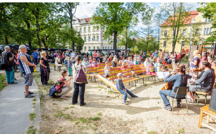
Veget Fest 2015

Pokud se vám líbily první dva ročníky festivalu zdravé výživy a ochrany zvířat Veget Fest nebo byste jej rádi navštívili poprvé, označte si v diáři sobotu 17. září. Pro třetí ročník jsme sehnali skvěle padnoucí lokalitu – Ostrov na strakonickém Podskalí.