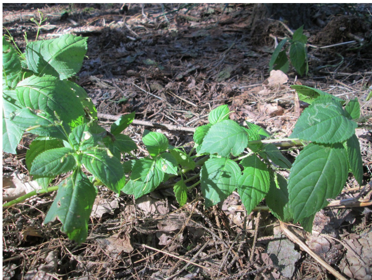
Wytržená netýkavka po 14 dnech - znovu zelená