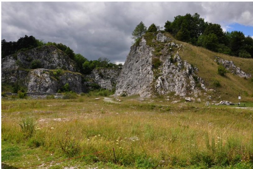
Botanická zahrada u Štramberka, foto -vh-