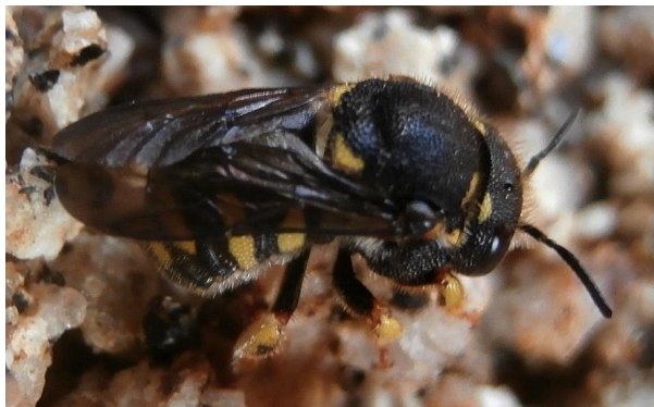
Smolanka skvrnitá

V Kompostu č. 8/2014 jsem psala o pozorování samotářské včely vlnařky obecné ( Anthidium manicatum ). K tomuto druhu bych chtěla doplnit, že letos jsem viděla samičku vlnařky obecné, jak kusadly seškrabává chloupky z čistce byzantského. Vy-