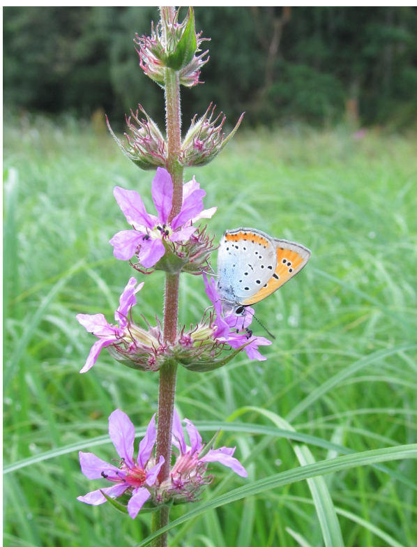
Sameček ohniváčka černočárny na kypreji vrbici

Řeka se za tímto místem stáčí prudce doleva a zakrytá podemletými, místy i padlými stromovými velikány, se dostává až k jezu s náhonem vodní elektrárny. Zde je bohužel patrné, jak málo je kontrolována distribuce vody pro výrobu energie a do zbytkového toku. Při nižším stavu se prodírá balvanitým jezem zhruba čtvrtina celkového průtoku a dost možná je tím znemožněna jakákoli migrace ryb. Přesně v tomto místě nad pravým břehem je v hustém porostu náletových dřevin skryt zaniklý lom, který by se mohl díky zajímavé poloze stát po případné revitalizaci útočištěm zajímavých druhů živočichů a rostlin.