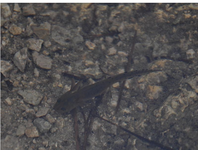
Domácí obojživelník, tamtéž – v duchu článku zcela anonyrní

Důležité je opět připomenout, že se jedná o botanickou zahradu, která je sice pod širým nebem, ale je řízeným seskupením rostlin a živočichů. Tudíž je tak trochu odlišná od okolní přírody, což se týká rozšíření rostlin a živočichů v jiných, podobných lokalitách. Nenajdete tu exotické orchideje, vzácné cizokrajné stromy ani křiklavé, řvavé papouchy a safarijní savce. Jezírka neobsahují barevné rybky, želvy ani líné krokodýly... Pro fotografy a nevěsty jsou ozdobena jen lekníny. V každém případě je však možno návštěvu této botanické zahrady doporučit. A možná nejen tu návštěvu. Řekl bych i příklad. Pro mě je důležité srovnání s krajinou, ve které žiji. Vzpomenu-li na opuštěné lomy a lomečky v blízkém i vzdálenějším okolí Strakonice, trnu nad jejich osudem. V lepším případě jsou postiženy sukcesí, zarůstáním vegetací, rostlinami, keři a stromy. V horším případě je jejich dno obšastně divokou skládkou. A ten horší případ znamená zavezení bez ohledu na flóru i faunu a třeba pozdější využití na stavební parcelu. Myslíte-li, že takové pozemky neznáte, pak se podívejte okolo. Začíná to od malých lomečků, kam se s bídou vešly dva povozy vedle sebe, a končí to třeba lomem, kde rejdlily těžební stroje, střílelo se a rubalo jako o život. Pokud by bylo potřeba příkladů: třeba Kalný vrch, vápencové lomečky při lesní cestě mezi Šibeničným a Holým vrchem, zaniklý lom na hlínu u již neexistující cihelny u Mutěnic nebo zasypaný lomek na zajímavou „písmenkovou“ žulu nedaleko