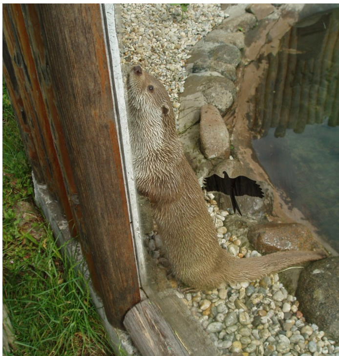
Vydra říční ze záchranné stanice Makov

Vydra říční je lasicovitá šelma, přizpůsobená životu ve vodě. Vydří srst je jemná a hustá. Jemná podsada zadržuje mikroskopické bublinky vzduchu a působí jako velmi účinná izolační vrstva. Tím může být vydra mnohem mrštnější než jiní na vodu orientovaní savci, protože nemusí vytvářet přílišné tukové vrstvy. Je skvělým plavcem, mezi prsty jí rostou plovací blány. Krk i nohy má krátké, ocas u kořene je silný, kuželovitý. Boltce nevyčnívají z husté, přiléhavé srsti, oči jsou velké. Vydra se dokáže velmi dobře orientovat i v kalné vodě a také umí přesně odhadnout prostupnost různých otvorů, protože k tomu, podobně jako kočka, využívá dlouhé hmatové chlupy na čenichu. Kořist vydra pronásleduje asi 2–3 minuty. Lov bývá úspěšný na