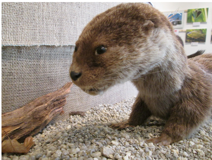
Vydry už málem skončily jako exponáty muzeí, foto -ah-

Nechybělo mnoho k tomu, aby se hrozba vyplnila. Dnes už je snaha uvažovat jinak a vytvořit takové podmínky, aby se původní druhy ohrožených zvířat včetně predátorů mohly v přiměřeném množství do krajiny vrátit. Je to vidět třeba na tom, že pan Václav Chaloupek představil dětem i rodičům večerníčkového Vydrýska , že vznikají environmentální centra doplňující hravou formou školní výuku a šířící informace o funkci vyvážených ekosystémů nebo že vedle zažitého uvažování typu jídlo/škodná se prosazuje i snaha nějak rozumně sladit zájmy lidí s právem zvířat na jejich existenci (viz např. zde ). Není snadné to zařídit, ale je dobře, že se na tom už aspoň začalo pracovat. -ah-