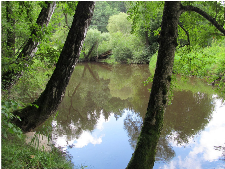
Blanice nad Svinětickým mostem