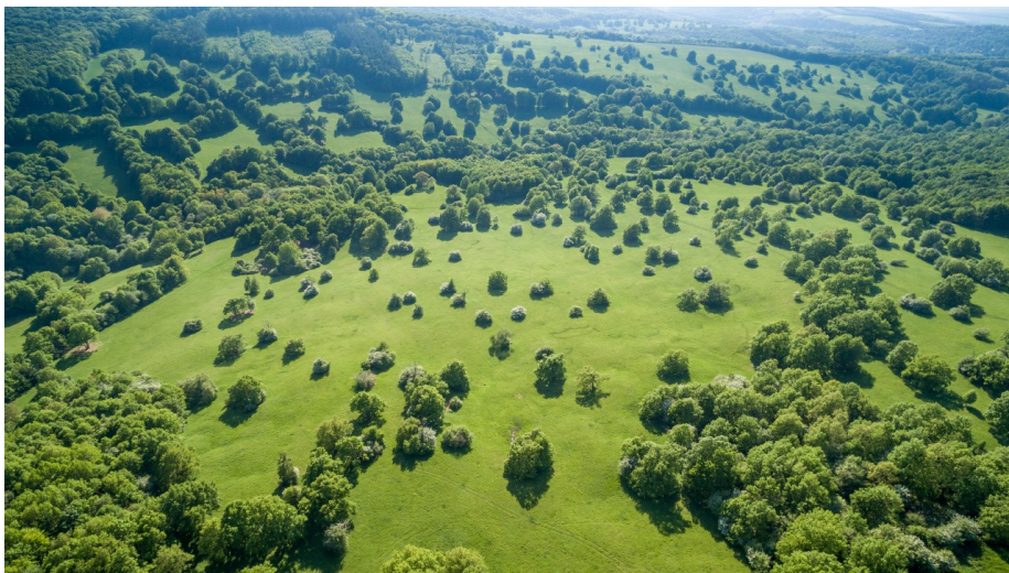
Orchidejové louky Bílých Karpat, foto Petr Krejčí

Pokud by měla existovat reklama na to nejhezčí, co máme nebo spíše co zbylo z české přírody, vypadala by podobně jako dokumentární cyklus „Krajinou domova“. Reklama ne příliš kýčovitá, a přesto vystihující to, na co můžeme být pyšní... a co bychom měli opatrovat jako oko v hlavě. Televizi jsem ze zjištěných důvodů odstranil již před mnoha lety. Nedoufal jsem, že by mohla nabídnout ještě něco, co by stálo za její zapnutí. K tipu na televizní seriál ČT Krajinou domova jsem tedy přistupoval s určitou nedůvěrou. Hned po prvních minutách jsem si uvědomil, jakou jsem ve svém soudu udělal chybu. O málo snímcích můžeme říci, že forma se vyrovnává obsahu, a ještě méně často, že nevíme, co má z těchto dvou atributů v danou chvíli větší hodnotu. Určitá pompéznost (místy trochu vyvedená do extrému) je snad jedinou slabinou tohoto materiálu. I když je na subjektivním posouzení každého z nás, nakolik je při sledování rušivá. Kdo již přivykl obdobným dokumentům z dílny BBC, toho snad ani nepřekvapí. Pro mě osobně přispívá ani ne tak k monumentálnosti tohoto filmařského díla, jako spíše k podtržení monumentálnosti zobrazovaných artefaktů naší krajiny. Těžko více přibližovat zdařilost filmařského řemesla, aby to nevyznělo jako holé naneběpění. Každý nechť posoudí sám... otevře si láhev vína nebo jiným způsobem zpříjemní okamžiky při sledování.