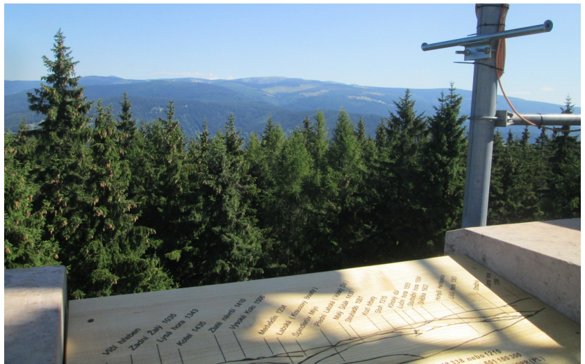
Krajina v okolí Benecka, foto -ah-

Tyto srazy jsou určeny nejen členům organizace, a tak se může přihlásit kdokoli, kdo se chce blíže seznámit buď se zkušenými dobrovolníky, pracujícími dlouhodobě na ohrožených lokalitách, nebo s daným regionem, nebo to vše spojit... Obrovskou výhodou je zde skutečnost, že můžete obdivovat přírodní zajímavosti i kulturní památky v doprovodu místních znalců – těch, kdo ke kráse své obce a jejího okolí aktivně přispívají a o to více o tom všem vědí. To, že v naší kulturní krajině ještě tu a tam zbyla místa s vlastnostmi aspoň relativně zachovalých ekosystémů, totiž není nic samozřejmého. Na většině z nich je nutno nějakým způsobem pracovat. Týká se to hlavně kontroly a případného hubení invazních druhů, protože přírodní mechanismy s nimi nepočítají a nevyrovňávají se s nimi dostatečně rychle, tak aby nehrozilo riziko zániku menších (a tedy více zranitelných) lokalit. Většina aktivních členů ČSOP se na těchto snahách podílí a při srazech mají možnost vzájemně si poradit, podělit se o radost z úspěchů a zároveň i o starosti, kterých je pořád víc než dost. Plynou často i z dobře míněných počinů, protože z auta, z letadla nebo v televizi vypadá krajina pěkně a utěšeně, nepůsobí dojmem, že se v ní dějí nějaké nepravosti. Na úřadech apod. často nevzniká dostatečně silná potřeba konzultovat konkrétní rozhodnutí a opatření s ekology, přírodovědci, starousedlíky a dalšími lidmi, kteří vidí důležité souvislosti a ochotně se o ně dělí, pokud mají tu možnost.