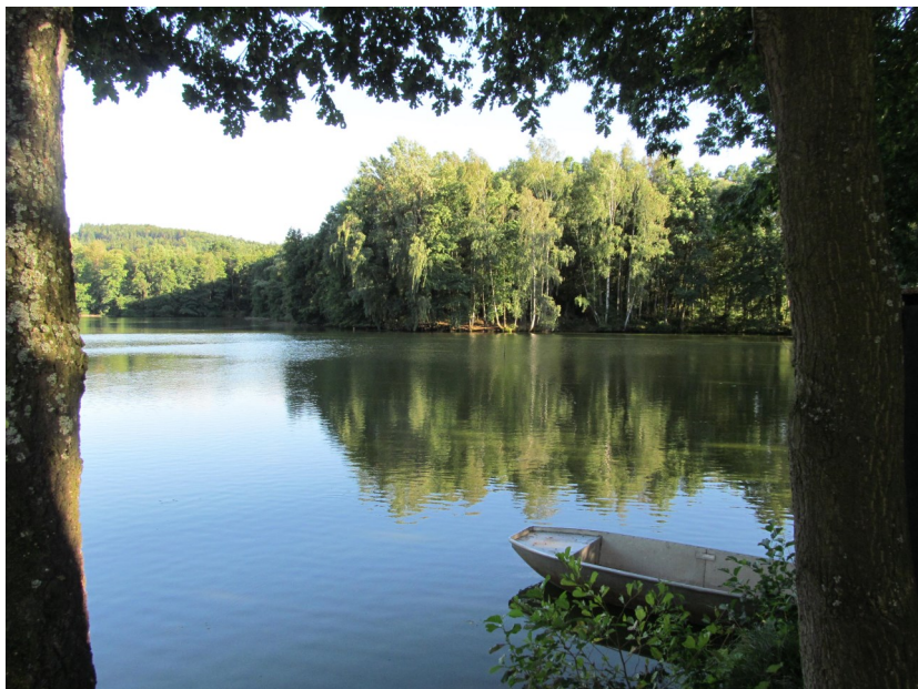
Rybník Kačírek, v pozadí vrch Koráz

Porosty rákosin a vrb směrem k rybníku Kačírek přecházejí v podmáčené komplexy olše lepkavé s bohatou vlhkomilnou květenou. Jedinou možností, jak překonat tuto část suchou nohou, je pěšina při severovýchodním břehu Kačírku. Z této spojnice můžeme obhlédnout jádrovou oblast zblízka. Jinak můžeme pokračovat dále po cestě a dostaneme se na hráze zmiňovaného druhého rybníka. Toto místo si také zahrálo ve známém filmu. Konkrétně hned v první scéně druhého dílu Princezny ze mlejna. Kromě dubů letních byly do hráze vsazeny rovněž břízy i nepůvodní dub červený. Rybník Kačírek je takřka celý obklopen podmáčenými porosty olší a bříz. Jeho břehy často navštěvuje a k lovu využívá volavka popelavá, mrtvé ve vodě ležící dřevo je shromaždištěm pro kachnu divokou.