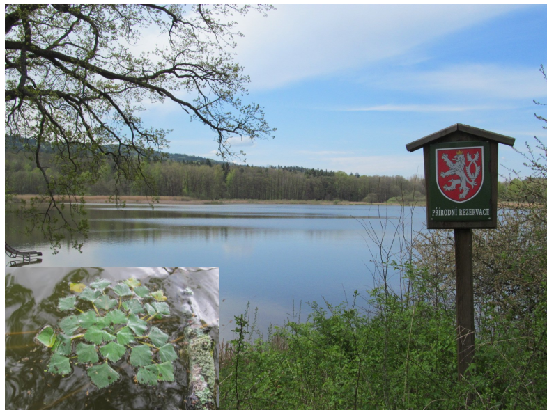
Záhorský rybník s větvemi Zeyerova dubu a detailem kotvice plovoucí

mokřadní společenstva, na severní straně oddělující Záhorský rybník od řeky Blanice, na opačné straně vstupující poloostrovitými formacemi do mělčin rybníka. Pouze z člunu nebo satelitního snímku je patrné, jak složitou mozaiku vytvářejí porosty rákosu a vrb popelavých v místech, kde voda přechází pozvolně v souš. Tato bažinatá zákoutí jsou hojně využívána vodními ptáky (labutí velkou, kachnou divokou, lyskou černou...) jako běžné útočiště i jako prostor k vyvádění mláďat. Čas od času je v této části aktivitou rybí násady odtržena část břehového porostu a putuje za pomoci větru po rybníce. V posledních letech se však daří držet hustotu rybí obsádky právě díky zvláštnímu režimu ochrany na přijatelné úrovni, což prospívá i celkové kvalitě vody.