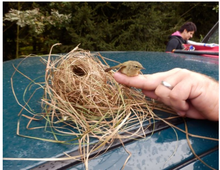
Budníček a jeho hnízdo, foto Eva Legátová