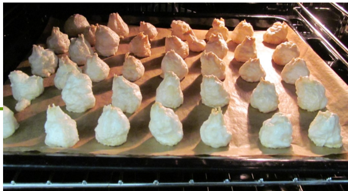
Kokosky z cizrnové vody

Postup přípravy: Cizrnu uvaříme dle základního postupu (viz výše). Připravíme si směs sójové omáčky a krémového balzamika v poměru 1:1, kterou vmícháme do uvařené cizrny. Ochucenou cizrnu vsypeme na olejem vymazaný plech a zapékáme na 230 °C dokřupava. Občas promícháme. Případně opékáme na pánvi.