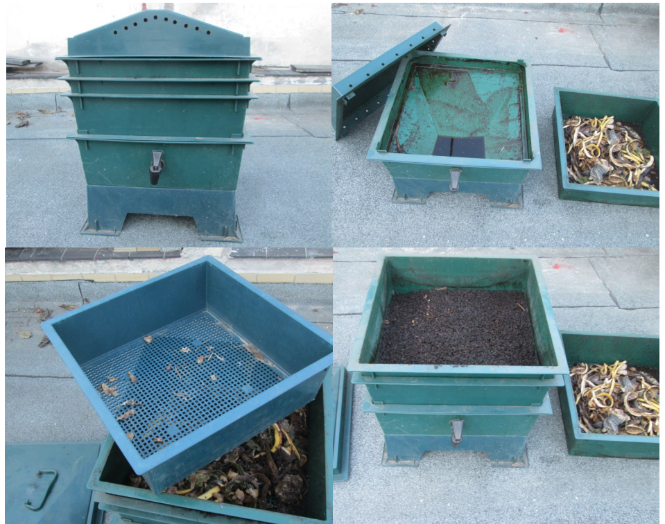
Plastový kompostér a jeho díly - do horního se dávají odpadky, do spodních propadává jemný humus, v nádobě s kohoutkem je tekutina

V prodejně zahradních potřeb je možno najít různé květináky, které by se daly sesazovat. Vyzkoušel jsem koš na vodní rostliny. Dají se sehnat v různých velikostech, tvar může být čtyřhranný nebo i kruhový. Koš je potřeba zasadit do větší nádoby (ale jen nepatrně větší) – například do takové, která měla původně sloužit jako obal na květináč. Dá se použít i květináč, pokud je podložený miskou (aby neunikala tekutina). To vše je potřeba zakrýt i svrchu, aby byly žížaly ve tmě. Je to velmi dobrá možnost a není tak drahá. Vzniklý kompostér sice není víceposchodový, takže žížaly postupně vytvoří vysoký sloupec humusu, ale to nevadí – jednou za čas se všechna hmota vybere, žížaly a hrubé části se oddělí a vrátí zpět, jemný humus se použije a čeká se na vznik dalšího. Je dobré mít alespoň dvě sestavy – v jedné z nich pak převládá již hotový kompost, v druhé začínající. Můžeme využít i podlouhlé květináky a biokompost přikládat. Žížaly si samy prolézají do nového materiálu a za sebou zanechávají biohumus. Je vidět, že možností je poměrně dost.