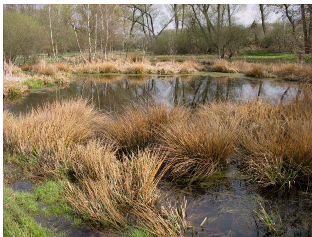
Menší tůň s porostem sítiny rozkladité

Mnoho tisíc let ukládala řeka Otava podél svých břehů štěrkopísky s obsahem zlata. Toto zlato získávali Keltové rýžováním už v 5. století před naším letopočtem. Největší rozvoj těchto aktivit nastal ve 13. - 14. století. V prohlubních po rýžování zlata vznikaly tůně. Charakter dnešní přírodní památky Tůně u Hajské ovlivnila kromě rýžování zlata i pozdější těžba štěrkopísků. Jámy po těžbě se přirozeně zaplnily podzemní i srážkovou vodou, zatímco okolní prostor pokrývají travinobylinná společenstva, stromy a keře.