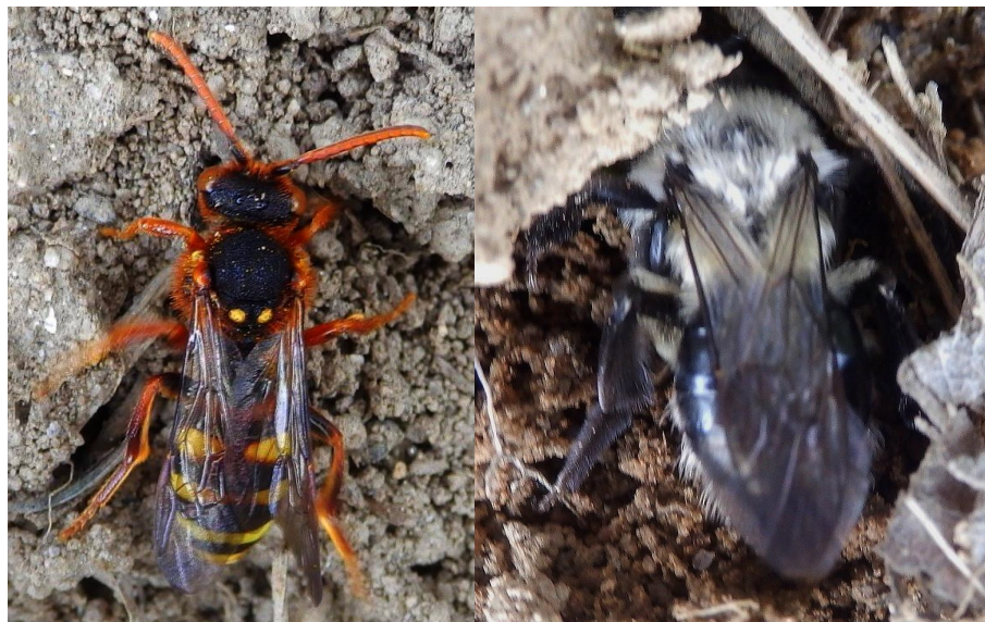
Nomáda ryšavá, pískorypka potulná, foto Eva Legátová

Včelky nomády ( Nomada ) jsou nápadné svým výstražným zbarvením v barvě černé, červené a žluté, kterým napodobují vosy. Mají zakrnělý pylosběrný aparát, redukované tělní ochlupení a naopak zesílenou kutikulu, jež je chrání před útokem hostitele. Jsou to totiž kukaččí včely, parazitují v různých, i nepříbuzných druhů samotářských včel. Samičky nomád pronikají do dočasně opuštěného hnízda samotářské včely, kde umístí své vajíčko. Larva pak odstraní hostitelské vajíčko nebo zabije vylíhlou larvu hostitele a dokončí svůj vývoj na přinesených zásobách potravy. U nás žije asi 70 druhů nomád. Dospělci se živí na květech. 7. 5. 2017 se mi podařilo vyfotit na Vysočině u obce Sněžné samičku nomády ryšavé ( Nomada lathburiana ). Je to jeden z větších druhů. Na stanovišti si hrabala noru hostitelská pískorypka potulná ( Andrena vaga ). Je zajímavé, že při páření postříká sameček nomády samičku feromonem hostitelské pískorypky, a tato vůně ochrání nomádu v případě setkání s pískorypkou v jejím hnízdě. Hodně zážitků při pozorování nomád i jejich hostitelek přeje čtenářům Kompostu Eva Legátová .