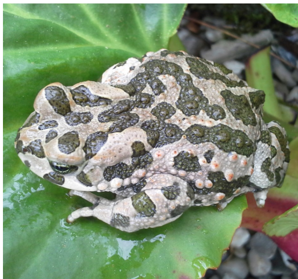
Ropucha zelená, foto Petr Valenta

Dozvíte se například to, že početnost obojživelníků a plazů vypovídá o zdravém životním prostředí a i k jeho čistotě přispívá. Že k lepší ochraně některých druhů by stačilo lépe načasovat vypouštění rybníků. Nebo že dráždivé látky vylučované ropuchou obecnou, určené přírodou na sliznice v ústech predátorů, nejsou nijak nebezpečné pro člověka a nemusíte se tedy bát, pokud uvažujete o své aktivní účasti při transferu (to můžeme potvrdit i my, kteří jej provádíme). Atd. atd.