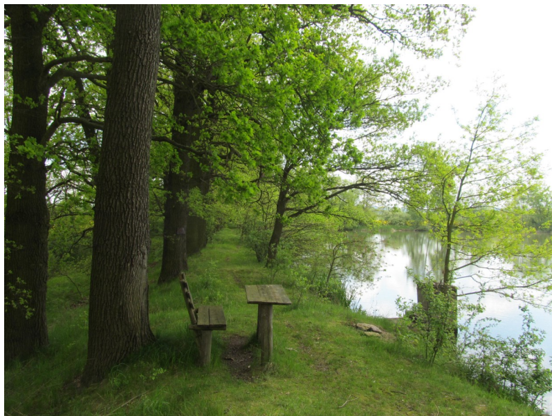
Na hrázi Radčického rybníka

skokanů slyšitelných z velké dálky. Střední pasáž lesů ozvláštňují světliny a drobné louky s rozptýlenou zelení.