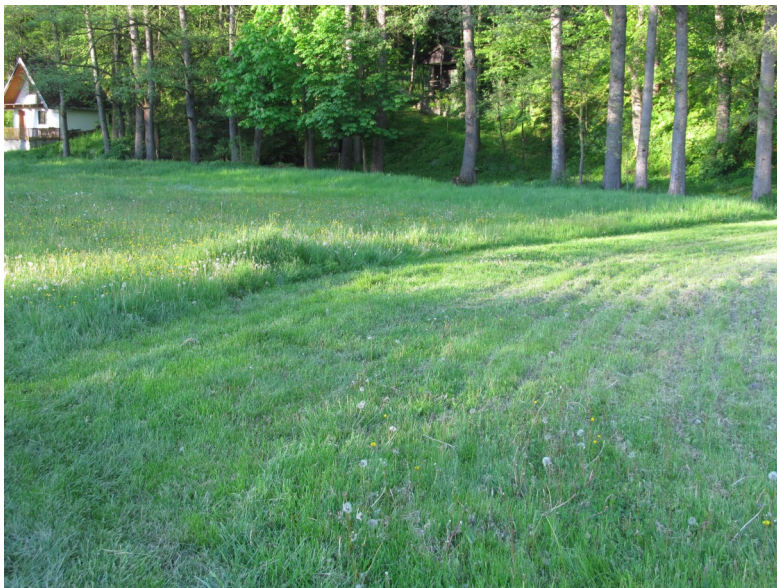
Zkoumané pozemky

V uvedeném místě se nachází pro dobré srovnání ještě část lučního porostu, která je s největší pravděpodobností sečená