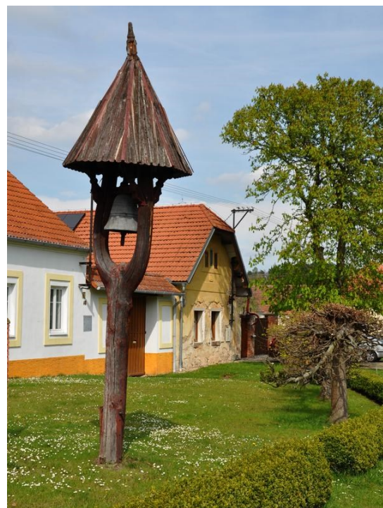
Zvonička ve Vítkově

Návesní rybník za návsi se stromy ve Vítkově byl kromě ryb prostředím pro pulce ropuchy obecné, kteří využívali k úkrytu škvíry mezi sypaným hrázovým kamenem. Po vystoupení z Vítkova s blízkostí vrchu zvaného Borovice a Hrochovy studánky jsme stanuli v obci Slatina, kde manželka objevila několik vyhánějících rostlinek měsíčnice, zřejmě utečence z některé zahrady. Rozloučení se Slatinou obstarala husa velká, odpočívající na chuchvalci pobřežních rostlin Silničního rybníku. Potom už jen cesta přes nedaleký Slaník se zastávkou u dominanty blízkého okolí, Slanické lípy, a první sváteční májový den byl za námi. Tak nechte to, když je v lůnu naší krajiny tak krásně. -vh-