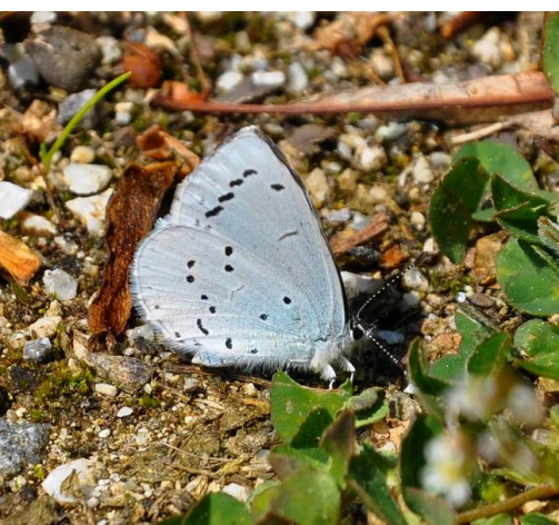
Modrásek krušinový - zámecký park ve Štěkni

Polní cesta vinoucí se mezi loukami a drobnými křovinami nás dovedla na silnici vedoucí k Nebřehovicím, kde jsme čejky chocholaté zaznamenali také a jsou opět evidovány na zmiňovaném webu ČSO. O