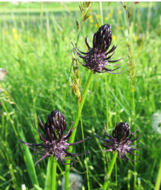
Ohrožený zvonečník černý

nárazově (tedy zhruba 1x za sezónu) a také část sečená nahodile, přesněji řečeno jednou za několik let (zatím ještě nevykazuje známky dalšího stupně sukcese – výskytu náletových dřevin). Rozhodl jsem se všechny tři pozemky porovnat na základě pestrosti společenstev. Vycházel jsem z prostého součtu rostlinných druhů (vyjma mechů) provedeného ve čtvercích 10 x 10 m v květnovém aspektu. Vedlejším ukazatelem byla rovněž životodárnost porostů pro nejrůznější druhy hmyzu (zejména motýly) – tedy množství viditelně kvetoucích rostlin. V celkovém počtu druhů jsem ještě zaznamenal počet nalezených druhů trav.