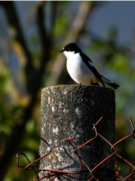
Lejsk černohlavý - Kapsava Lhota

Asi každý rád přivítá májové svátky, které bývají předzvěstí příchodu teplých dní. Mnohdy je lidé využijí k cestování po krajině blízké i vzdálené. V tomto směru napaříme s manželkou mezi výjimky a zmiňovaný odchod letošního dubna a příchod května jsme i letos užili po našem.