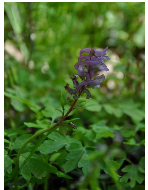
Dymnivka dutá - zámecký park ve Štěkni

Nalezl jsem například mohutnou pijavku koňskou nebo měkkýše lištovku lesklou