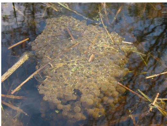
Snůška vajíček kuňky obecné (silně ohrožený živočich)

V tomto nerušeném prostředí se daří obojživelníkům, vodnímu hmyzu i vodním rostlinám. K nejvýznamnějším druhům patří masožravá vodní rostlina bublatka obecná, která v současnosti roste jen na 3 lokalitách v ČR. Životnost tůní je omezena postupným zameškováním a zarůstáním v řádu desítek let. Od roku 2005 realizovalo Město Strakonice v několika etapách jejich obnovu.