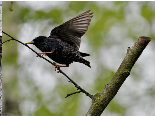
Brhlík lesní u dutiny, špaček obecný, Podskalí, foto -vh-