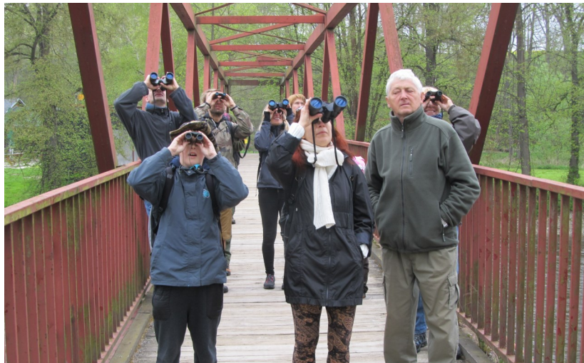
Účastníci akce na Podskalí ve Strakonících, foto Jiří Pykal

Tato akce, organizovaná Českou společností ornitologickou (ČSO) pro všechny, kdo mají zájem o poznávání ptačích hlasů a života ptáků všeobecně, se stala na mnoha místech již dlouholetou tradicí. Ve Strakonících se po dlouhé době „vítání ptačího zpěvu“ uskutečnilo v sobotu 6. května. Celkem 22 účastníků se sešlo u Domu dětí a mládeže nad Podskalím v 8 hodin