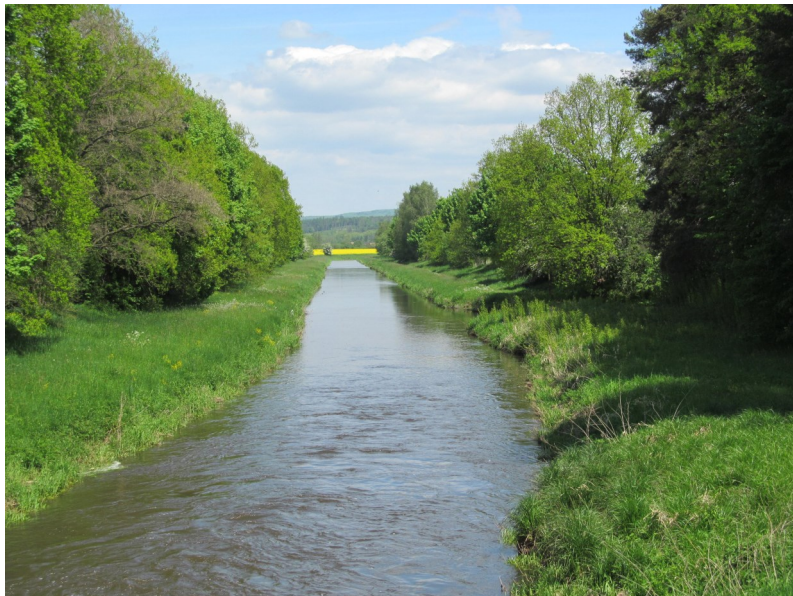
Zregulovaná Blanice u Louckého mlýna

V úseku Blanice pod rybníky Velká Podvinice a Velká Okrouhllice se do řeky ze své obchůzky městem vrací Blanický náhon, aby se v jiné podobě o několik metrů dále od řeky opět oddělil. V tomto místě byl vystavěn Mostecký mlýn, kde můžete zhlédnout expozici muzea mlynářského řemesla. O několik set metrů dále po proudu náhonu se pak nachází mlýn Dubských zásadně poznamenaný rukou kolektivizace. A do třetice mlýn U Kulhánků těsně za hlavní silnicí na České Budějovice. Za ním náhon vytváří zákoutí s dvěma slepými rameny a porostem olší a topolů s lužním charakterem. Místo je obýváno nejrůznějším ptactvem, ukázali nebo ozvali se mi budníček menší, pěnice černohlavá, špaček obecný, konipas bílý a poštolka obecná. Dále po cyklostezce se dostaneme k poslednímu mlýnu této skupiny – Louckému. Ten po rekonstrukci slouží klientům Alzheimercentra. Za mlýnem se otevírají nehostinná místa mezi rozsáhlými intenzivně zemědělsky obhospodařovanými pozemky. Můžeme zde po polní cestě uhnout směrem k osadě Čavyně. Ze smíšeně zalesněného návrší nad vískou vystupuje při západním okraji skála a vytváří zde zajímavý osluněný biotop. Podmáčený zemědělský pozemek pod ní přiléhající až těsně k řece je útočištěm pro čejky chokolaté, které při mé návštěvě ochotně zapózovaly v poli i při letecké akrobacii pro můj fotoaparát.