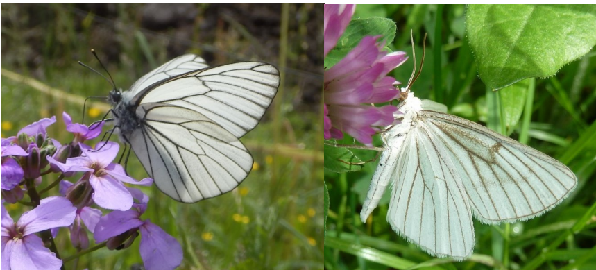
Bělásek ovocný