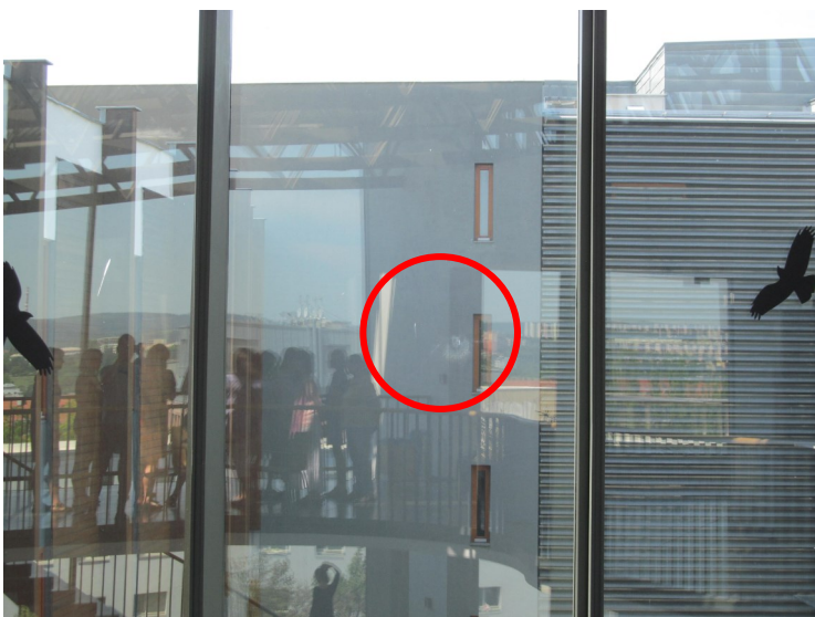
Důkaz nefungující ochrany řídké lepenými siluetami dravců - otisk nárazu ptáka, foto -jj-

Pro samotné ošetření skleněné plochy je nezbytné takové opatření, které zaručí, že pták bude sklo vnímat jako celistvou překážku. Při letu totiž zaznamenává jenom poměrně úzký perimetr. Samostatné nebo řídké umístěné polepy tak svou ochrannou funkci téměř neplní. Naopak při dostatečně hustém polepení se jedná o ochranu velmi efektivní - a vůbec nerozhoduje tvar ani barva. Velmi účinné jsou pruhové polepy, dá se využít i takřka neviditelných UV polepů (většina ptáků vidí i v UV spektru), u školských zařízení se může stát jejich tvorba součástí výtvarné a ekologické výchovy. Konkrétní