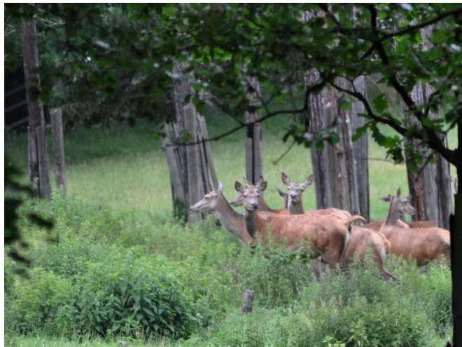
A za soumraku se laně změní na přeludy

majestátnější a tajemnější. V pohádkách přicházejí po půlnoci bytosti z jiného světa, zjevují se v přízračném "světle" noci, aby pak mizely neznámo kde a jak. Laně vyplouvaly z temnoty a neslyšně se s ní snoubily. Bludičky soumraku a lesa. Stačilo natáhnout ruku a přízraky se rozplynou - duch noci promlouval svými dětmi. Divadlo stínů a mlhavých přeludů. Neskutečné postavy starých ság od Zeyera. Opary mlžných laní se ztrácely ve tmě, jakési zhmotnění Neurčitého, a přeci Rozeznatelného stálo v prostoru a procházelo časem a stěnami srubu.