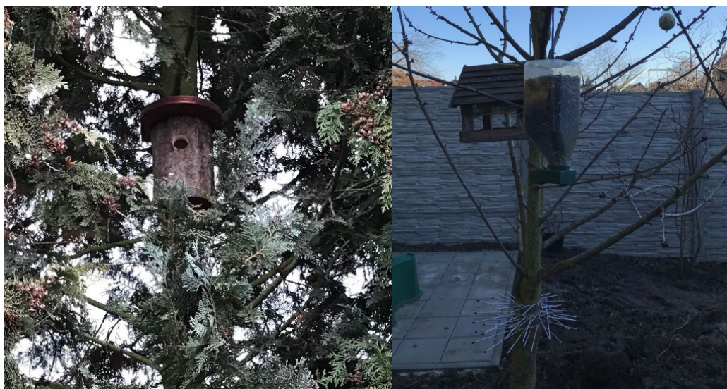
Budka na cypřišku Lawsonově, ochrana proti kočkám, foto Marie Jelínkové

Na jednom stromě jsme vyzkoušeli i instalaci drátěné ochrany krmítka proti kočkám a doufáme, že bude fungovat. Na cedru, kde použití takovéto ochrany na kmenu není možné, jsou po stranách budky nainstalovány drátěné sítě zabraňující kočkám do krmítka vniknout. Popisované produkty naleznete zde , zde a zde .