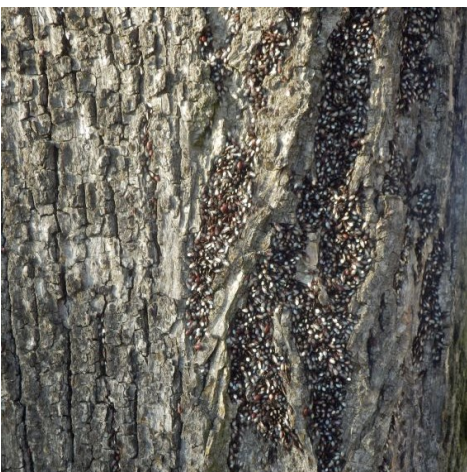
Blánatka lipová

O invazní plošticí blánatce lipové ( Oxycarenus lavaterae ) psal Kompost v č. 1/2016 . Tentokrát jsme se s blánatkou lipovou setkali opět v Písku během výletu ZO ČSOP Strakonice vedeného manželi Hrdličkovými 1. 12. 2018, ale na jiném místě – u waldorfské ZŠ Svobodná. Blánatky zde obsadily jednu lípu ve stromořadí. V Praze jsem však 4. 12. 2018 pozorovala mnoho lip za sebou obalených blánatkami, bylo to u Podolské vodárny a také na druhém břehu Vltavy na Smíchově. Vyhledala jsem si proto informaci o tomto novém „škůdci“ v časopise Zahrádkář č. 5/2018: