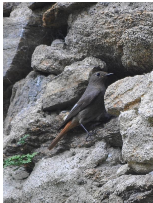
Rehek domácí

Jaký byl výsledek? V den, kdy byla pořízena u článku připojená fotografie, došlo k vylétnutí rehčích ptáčat někdy přes den nebo podvečer. A potom jsem je dva dny neviděl. Staří se občas vrátili ke hnízdu, resp. do jeho blízkosti, chovali se mírně neklidně a pokoušeli se mně. Už jsem měl obavy, že ptáčata sebrala straka nebo kočka. Ale třetího dne jsem se dočkal. Přilétlo to všechno, sýkory koňadry, uhonění brhlíci s ošoupanými ocásky, na zdi se rozesadili rehkové a vše bylo jako dříve. Radostné, zpěvavé a plné života. Jen nás tam bylo najednou víc. A to je dobře. -vh-