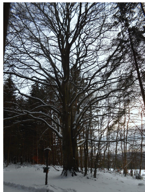
Král lesa (památný strom)