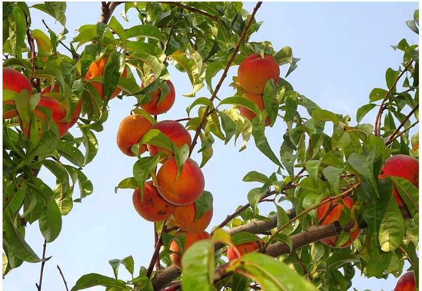
Úroda broskví z Horažďovic

Zima prosincová byla teplá (2,0 °C). Déšť střídal sněh, teplo nad 10 °C zase slabé mrazy do - 4 °C. Výrazná vánoční obleva s větrem dorazila už 22. 12. (10 °C) a vzápětí i vydatně zapršelo (26 mm). Prosincové srážky – celkem 64 mm - znamenaly cca dvojnásobek průměru.