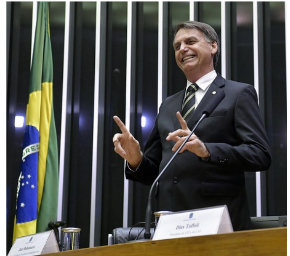
Jair Bolsonaro

I když je tento problém natolik rozsáhlý a v našich očích i vzdálený, musíme o něm vědět. A i přesto, že s politickou situací této země nesvedeme vůbec nic, dílčím způsobem můžeme přispět alespoň snižováním poptávky po produktech roztáčejících toto šílené soukolí. -jj-