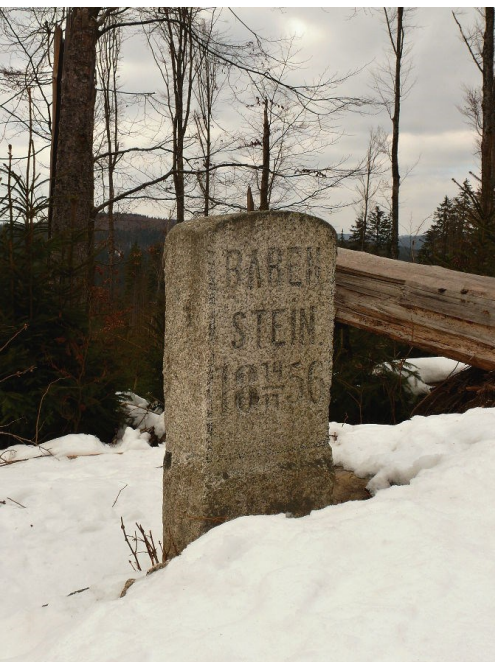
Medvědí kámen

Trasa medvědí stezky měří 14 km, je značena žlutou turistickou značkou a také bílým čtvercem s příčným zeleným pruhem a symbolem medvěda. Přibližně v polovině trasy se nachází osada Jelení Vrchy. Zajímavým zastavením na trase je památník poslední šumavské medvědice, která byla v těchto místech zastřelena 14. 11. 1856 synem schwarzenberského hajného. Cestou potkáte také technickou památku Schwarzenberský plavební kanál v délce několika desítek km, který sloužil k plavení dříví z nepřístupných šumavských míst až do Vídně. Podél Medvědí stezky prochází podzemní tunel kanálu (u osady Jelení Vrchy), uzavřený z obou stran kamennými portály. Dále narazíte na Jelení jezírko, které sloužilo jako retenční nádrž pro zvýšení stavu vody Schwarzenberského kanálu.