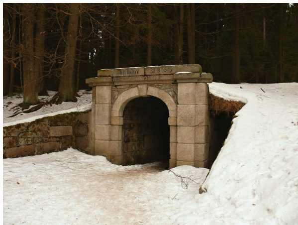
Portál podzemního tunelu Schwarzenberského kanálu