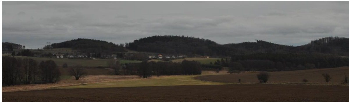
Krajina kdesi u Černíkova, foto -vh-

A dále cestičkou k nedalekým Kalenicím. Dřevěný vodník juká do průzračné vody na plácání rybích ploutví připomínající skutečnost, že zde možná smutný konec této skupiny živočichů nakonec nebyl. Cestou zapo-