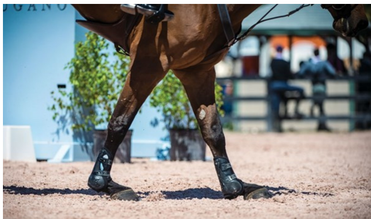
Přetížení sponkových kloubů při doskoku koně může vést k trvalému poškození

Fyzická zátěž ale není to jediné, s čím se koně v parkurové aréně potýkají. Jeden z hlavních problémů je jezdec sám. Ve snaze utrhnout si co nejvíc z dotace závodu a zvýšit svému koni výkonnost, která logicky zvyšuje prodejní cenu koně, nutí svého svěřence k výkonům, na které často není připraven nebo k nim vůbec nemá dispozice. Kůň, který skáče přes vyšší překážku, než na kterou stačí, se často bolestivě praští. Podle jezdců či trenérů je to výchovné. Příště si bude dávat větší pozor. Je to vlastně takové legální barování (záměrné zvedání skokové překážky během skoku koně), které je zakázané právě pro jeho krutost. Ačkoliv to na první pohled tak nemusí vypadat, lze uvažovat nad tím, že podle zákona se jedná o týrání. Přesto tomu ale lidi rádi přihlížejí, a ještě za to platí.