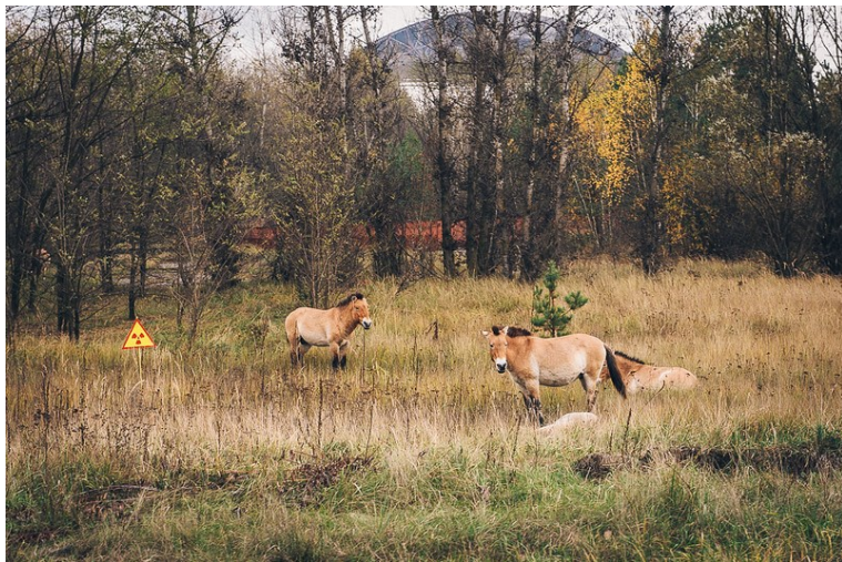
Koně Převalského v černobylské zóně

Nedlouho po radiální havárii v roce 1986 byla na části území Ukrajiny a sousedního Běloruska ustavena ochranná zóna o