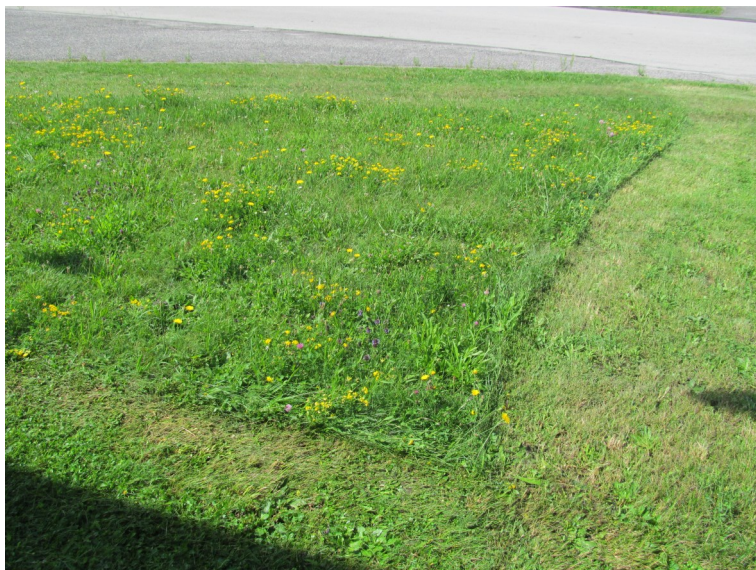
Mozaiková seč u Výstaviště v ČB, foto -jj-

Klíšťata. Poměrně silný evergreen v travních diskuzích. Ve skutečnosti však nebylo prokázáno, že by jejich početnost souvisela se způsobem ošetřování trávníků. Stejně (a veskrze nízké) počty byly nalezeny jak na krátce střižených, tak i v odrostlejších plochách. Podobné je to s "obávanými" včelami. Ano, kvetoucí plochy přitahují opylovače a kvůli nim to vlastně celé děláme. Na druhou stranu i nižší trávník s velkým zastoupením např. jetele plazivého láká určité množství včel. To určitě