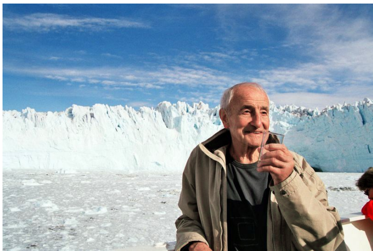
Claude Lorius

Již při první expedici v roce 1956 jsou načrtnuty některé metody zkoumání vývoje zemského klimatu v minulosti na základě fyzikálních vlastností sněhu a ledu v různých hloubkách. Tyto postupy jsou při dalších expedicích zdokonalovány. Nejprve je