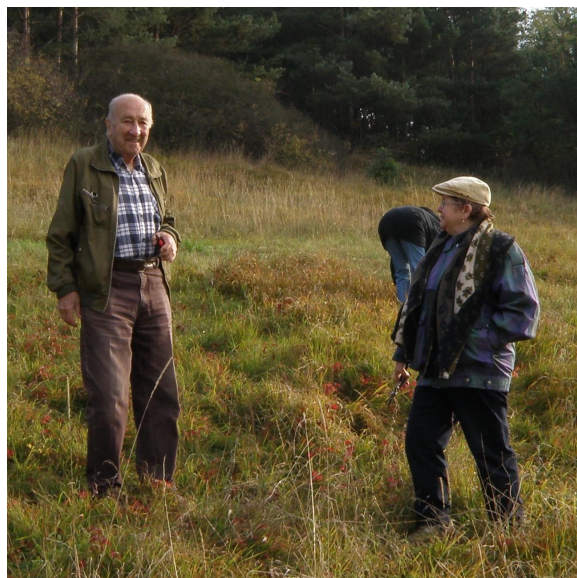
Na PP Přeštická pastvina