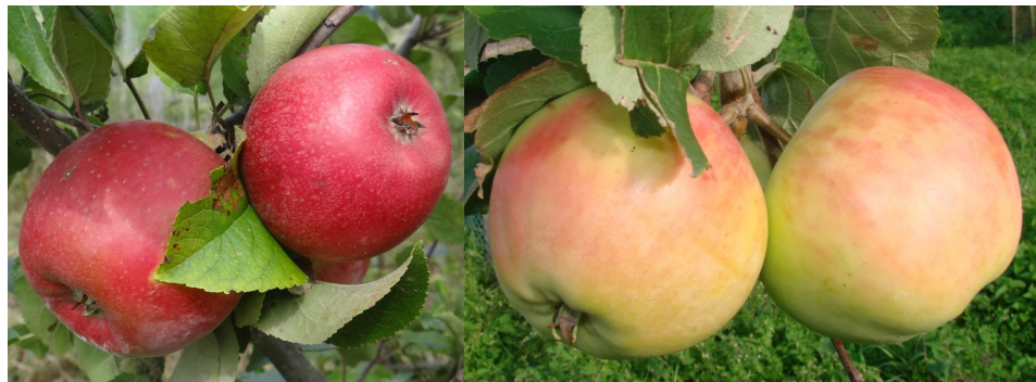
Breandův Imperial, Frassovo letní

velmi dobrou letní odrůdu vhodnou k přímému konzumu a pro pěstování v malých zahradách.