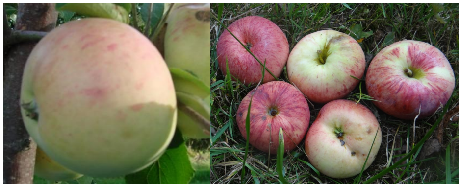
Astrachán bílý, Borovinka, foto Dana Kindlmannová

V první polovině minulého století byl nejrozšířenějším lením jablkem Astrachán bílý , byl ale více známý pod názvy Žitňák, Žitnavka, Ječné, Ječniště - podle obilí, které se v dané oblasti v té době sklízelo. Oblíbený byl pro svou nenáročnost na podmínky a odolnost jak proti chorobám, tak i proti mrazu a větru. Jako pravé ruské jablko má schopnost růst všude od nížin až po 800 metrů nad mořem. Dnes už se ale tato odrůda najde v Čechách jen vzácně. Jablko to není obzvláště krásné, chuti je navinulé, ale má jednu unikátní vlastnost – takzvané sklovatění, nebo zledovatění: slupka a dužnina vypadají jakoby namrzle – sklovitě. Když tato jablka jen lehce povaříme, udělají rosol, jenž pak stačí osladit a přidat šťávu z malin nebo borůvek – a je z toho vynikající pochoutka! Plody na stromě dobře drží – ani přezrálé nepadají.