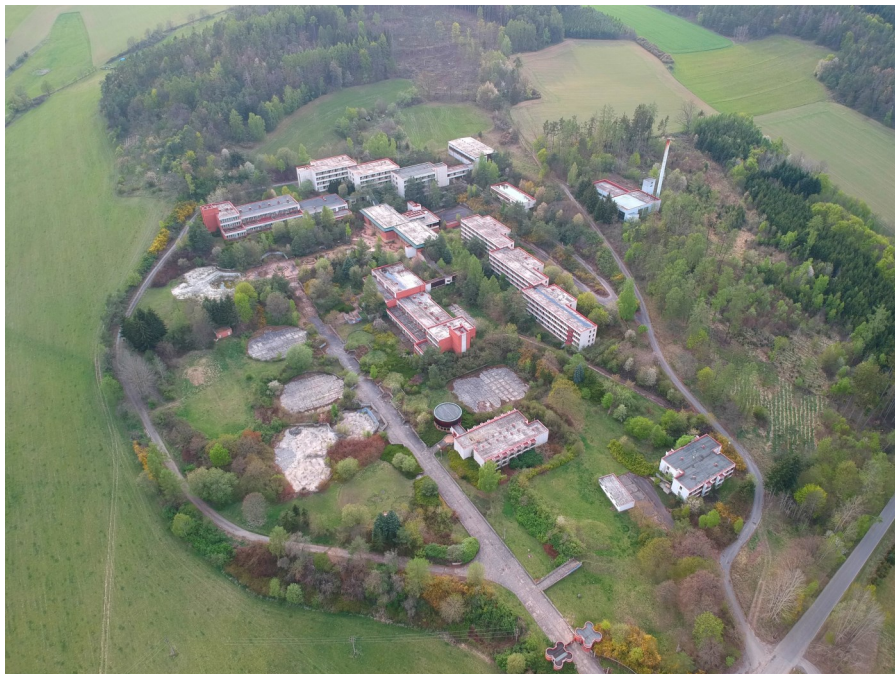
Areál volyňské školy v přírodě zachycený dronem

O areálu volyňské školy v přírodě se více dočtete na serveru prazdnedomy.cz (viz zde ). Jedna z budov v současnosti slouží jako turistická ubytovna. Proveditelnosti megalomanských plánů na zařízení pro seniory, ženskou věznicí nebo školící středisko Severoatlantické aliance už asi věří málokdo. Navíc každý další rok chátrání podobnou uvažovanou investicí rapidně prodražuje. A to je Achillova pata všech podobných případů. Celková rekonstrukce pro developerský záměr je finančně nedosažitelná, navíc vždy existuje možnost cokoli vystavět za zlomek ceny na zelené louce a v lukrativnějším místě. Naproti tomu na komunitní nebo sociální využití takových nemovitostí majitel nikdy nekývne, protože mu nepřinese kýžený profit. Tak raději volí pomalou agónii. Hlavně podobu a rozkladné procesy v místě nikde nestavět na odív - tak jako bylo sděleno mně. Pro přírodu přebírající nad areálem vládu zatím dobře. Jednoho dne se však může stát, že sem branami vjedou buldozery a pod jejich radlicemi zmizí vše přírodní i člověkem vytvořené. Protože to bude poslední zbývající možnost, jak s takovým místem naložit. -jj-