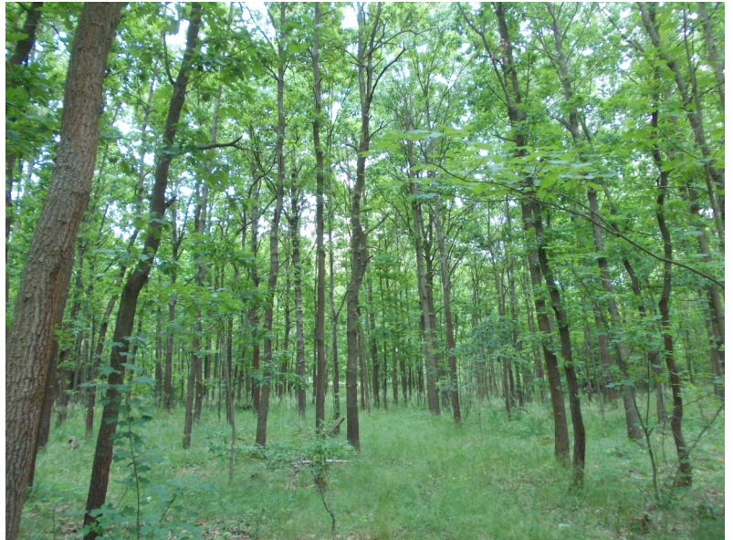
Mladší, převážně listnatý les v JZ části Hliničné, foto Alan Šturm

Severovýchodně od středu Strakonice se rozkládá městská část oficiálně označovaná Za Rájem, ale pravděpodobně daleko více známá jako Habeš. Podle všeho by mělo toto neobvyklé pojmenování opravdu souviset s východoafrickou Etiopií, dříve také nazývanou Habeš. Právě ve 30. letech 20. století, kdy probíhala válka mezi fašistickou Itálií a Habešským císařstvím, na poměrně odlehlejší místě za tehdejší okrajem našeho města, kde dosud stávala pouze hájovna, začala vznikat nová osada. Nejprve se jednalo o lokalitu obydlenou chudými lidmi, kteří si tady postavili v nejlepší případě dřevěné baráčky, někteří však brali zavděk i maringotkami nebo vyřazenými železničními vagony. A tato nuzná výstavba, komusi snad připomínající zaostalý africký venkov, pravděpodobně dala počátek jménu původně určitě posměšnému, jež se však navzdory všemu přesto ujalo a používá se až doteď. Ostatně poměrně brzy, ještě před 2. světovou válkou, začala být ona ubohá a často provizorní přístřeší nahrazována sice ještě vesměs skromnými, ale už přece jenom zděnými domky. Od 2. poloviny 20. století potom začínají rychle přibývat honosnější rodinné domy a vilky a v 90. letech získala předemětná městská část vyloženě ráz výstavné rezidenční čtvrti. Na starší časy tak nyní upomíná již jen pár prostších chaloupek dosud zachovaných především v Tisové ulici.