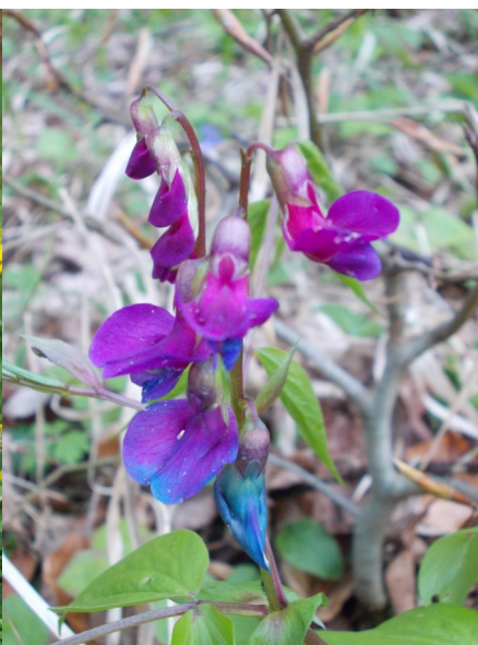
Čilimník černající, hrachor jarní, foto Alan Šturm

dubů a borovic, pokrývajícím celou mírně vyvýšenou ústřední partii dotyčného návrší. Zvláště za slunných dnů les působí na pohled velmi příjemně, ale jen do chvíle, než se tam rozhodneme proniknout. Postup vpřed velmi ztěžuje téměř kompaktní porost tuhých trav (především zase třtiny křovištní) a ostružiníků, pod nimiž se navíc ukrývají zrádné díry po dávno shnilých pařezech a kusy ulámaných větví, které nám mohou snadno přivodit nepříjemný pád. Každý by tedy měl nejprve dobře uvážit, jestli se sem vůbec vydá... Kromě agresivních travin a ostružiní tady už mnoho dalších kvetoucích rostlin nenajdeme. Prakticky jedině podél několika vesměs špatně