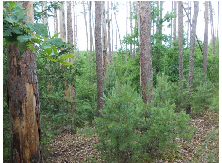
Les na západním svahu Hlaničné