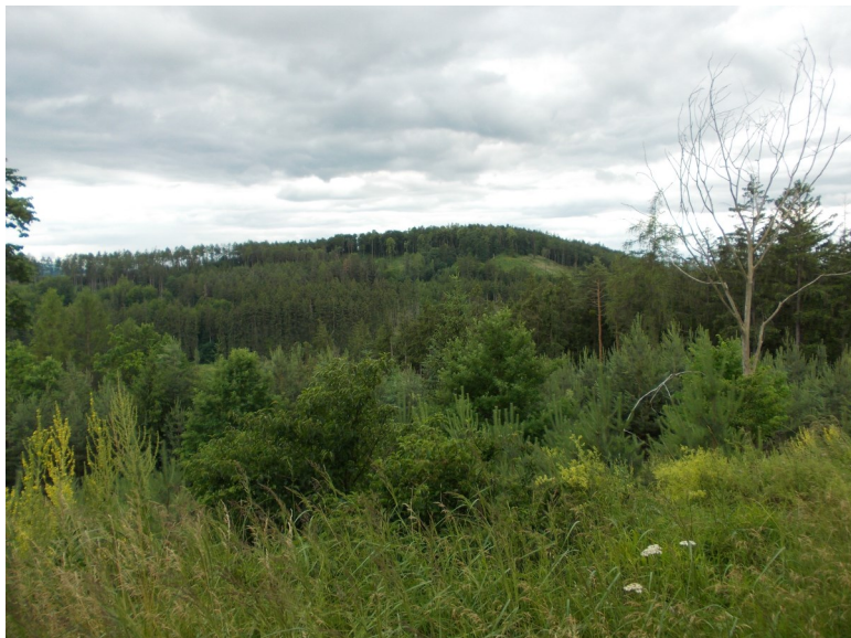
Pohled z vrcholku Hliničné na kopec Kuřidlo, foto Alan Šturm

převážně březový háj s mnoha již stárnoucími a postupně dožívajícími stromy. Mezi listnáči občas nescházejí ani smrky a ojedinělé modřiny. Dostí vlhké prostředí plné zvolna tlejících pařezů, spadlých větví a ležících odumřelých kmenů náramně svědčí dřevokazným houbám, jakými jsou březovník obecný ( Piptoporus betulinus ), hnědáč Schweinitzův ( Phaeolus schweinitzii ) či outkovka pestrá ( Trametes versicolor ), která zde často dosahuje klidně i rozměrů menšího talíře. Rostou tu vlhkomilné přesličky (rod Equisetum ) a příhodné podmínky k životu nacházejí také různé plži, zejména hlemýžď zahradní ( Helix pomatia ), plzák lesní ( Arion rufus ), poněkud vzácněji pak slimák popelavý ( Limax cinereoniger ).