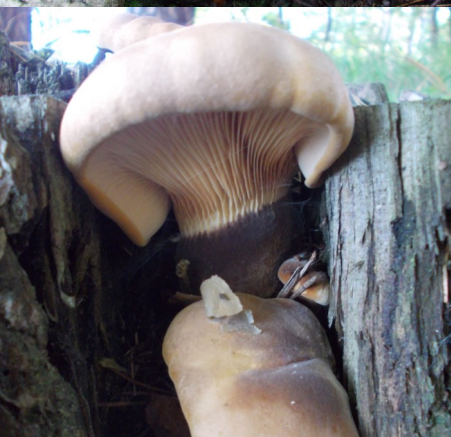
Březovník obecný, čechratice černoňatá

Kdo chce, může si poměrně velkou část lesa celkem pohodlně projít po několika širších cestách, z nichž páteřní trasa ve směru východ - jihozápad tvoří dokonce součást žlutě značené turistické "Naučné stezky Švandy dudáka". Napojit se na ni lze v ulici Pod Hliničnou v nejsevernějším zastavěném úseku Habeše, zhruba právě v místech, na kterých se kdysi rozkládala výše zmíněná cihelna. Ve východní části značené cesty budeme po obou stranách míjet stinný a letitý,