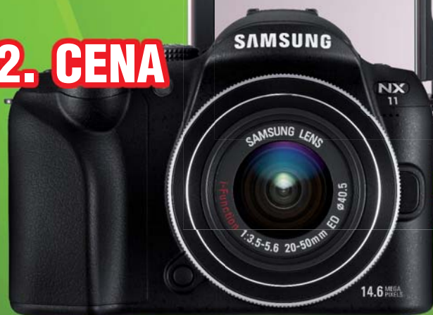
Fotoaparát s výměnnými objektivy a systémem bez zrcadla