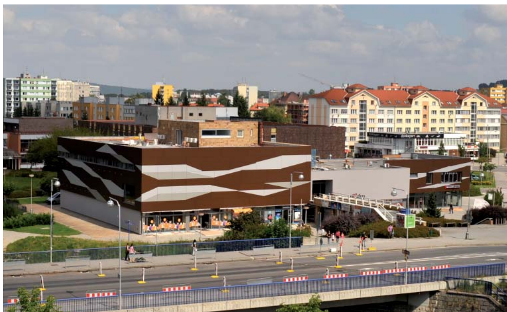
Rekonstrukce OC MAXIM pokračuje - PROVOZ NEPŘERUŠEN

Věříme tedy, že si najdete čas a navštívíte obchodní centrum Maxim i nyní v průběhu rekonstrukce, neboť přes všechny nesnáze přestavby je plně otevřeno a Vy budete moci sledovat obnovu v přímém přenosu. Navíc každým skutečným nákupem se můžete připojit do vyhlášené soutěže pro naše věrné zákazníky, která bude mít své vyvrcholení v průběhu slavnostního otevření zrekonstruované budovy. Proč tedy nevyužít účtenky za nákupy v obchodním centru Maxim a jednoduše se nepřipojit a nepokusit se získat velmi zajímavé výhry? Přesná pravidla soutěže si můžete vyžádat v každém z obchodů v OC Maxim nebo je najdete na webových stránkách www.ocmaxim.cz .