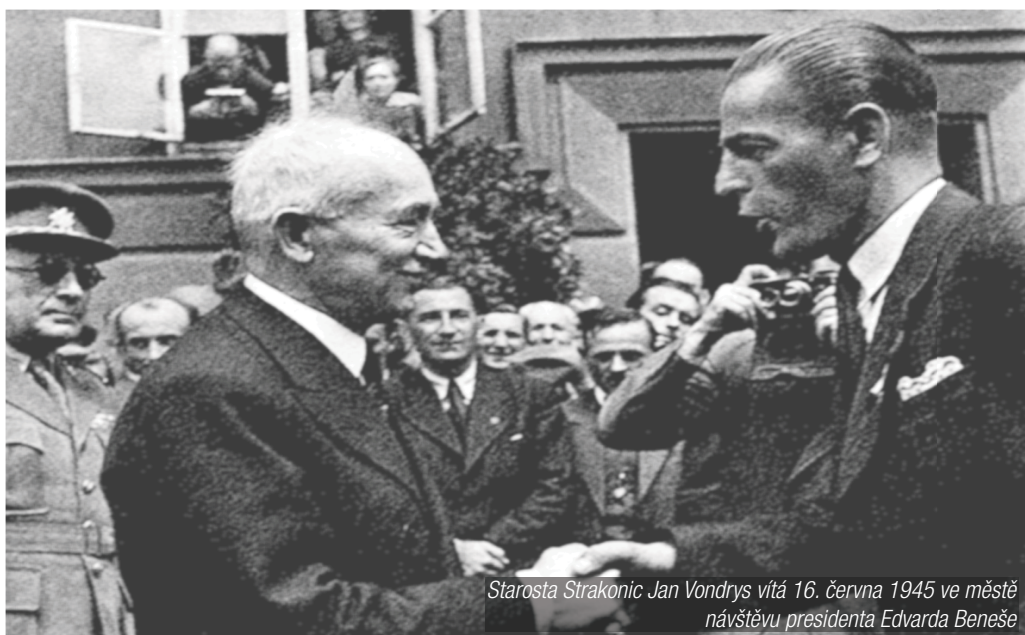
Starosta Strakonice Jan Vondrys vítá 16. června 1945 ve městě návštěvu prezidenta Edvarda Beneše