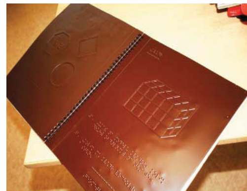
Foto nahoře: učebnice pro nevidomé ve 3D a s Braillovým písmem. Foto dole: učební pomůcky, které vyrábí Karlíkova asistentka Eva Marková. Tyto výtvory později slouží k učení dalším nevidomým dětem, se kterými jsou Leskovecovi v kontaktu a pomůcky jim předávají.

Život Karlíka budeme dál sledovat. Ti, kteří by jeho talent chtěli do budoucna podpořit, mohou kontaktovat jeho rodiče na mailu: leskovecovi.ujezd@seznam.cz