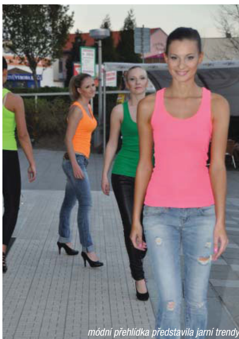
módní přehlídka představila jarní trendy