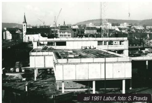
asi 1981 Labuť