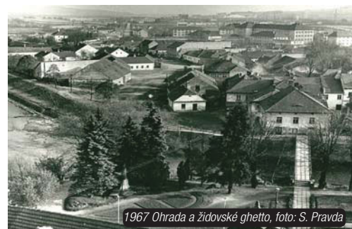
1967 Ohrada a židovské ghetto

volné prostranství, asi se přemýšlelo o tom, jak ho využít a předpokládám, že tak nějak vznikl nápad postavit obchodní dům Labuť. Dnešní podoba toho objektu mi připadá, jakoby esteticky lépe zapadala do té moderní části směrem od mostu, která se tam rozvíjí,“ vyprávěl muž, který