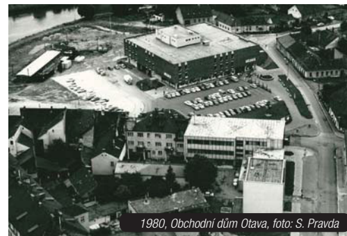
1980, Obchodní dům Otava

volné prostranství, asi se přemýšlelo o tom, jak ho využít a předpokládám, že tak nějak vznikl nápad postavit obchodní dům Labuť. Dnešní podoba toho objektu mi připadá, jakoby esteticky lépe zapadala do té moderní části směrem od mostu, která se tam rozvíjí,“ vyprávěl muž, který