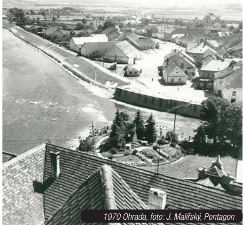
1970 Ohrada, foto: J. Malířský, Pentagon

„Jelikož sbírám věci kolem historie Strakonice a okolí 39 let, nahromadil jsem tolik věcí, že je těžké určit, kdo z nás je přesně dělal. Snímky od