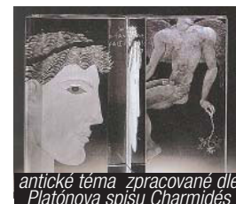
antické téma zpracované dle Platónova spisu Charmidés