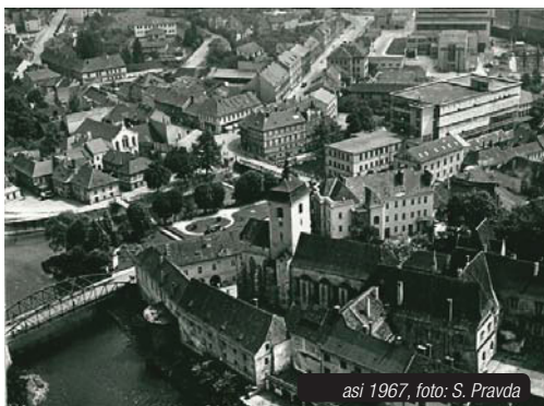
asi 1967

Čtenářům, kteří nás kontaktují se zajímavými náměty, děkujeme. Našel se mezi nimi jeden takový, jenž vedení redakce přivedl k myšlence poskládat mozaiku ze čtenářských střípků o historii budovy obchodního domu Labuť, nynějšího OC Maxim.