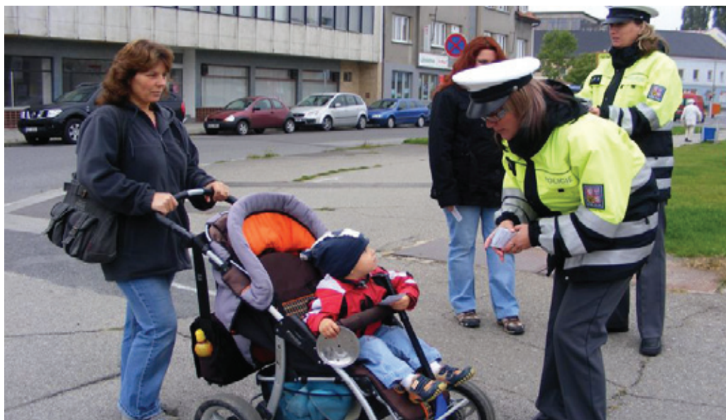
Zebra se za Tebe nerozhledne – dopravně preventivní projekt zaměřený především na chodce, celoročně policejní hlídky dohlížejí na bezpečnost v blízkosti přechodů základních škol. (foto PČR)

Fanty, zůstali a odvádějí práci v naprostém souladu s mými představami. Netvrdím, že se svými. Strakonický územní odbor zkrátka funguje jako tým a rozvíjí se.