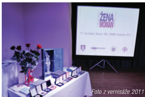
Foto z vernisáže 2011