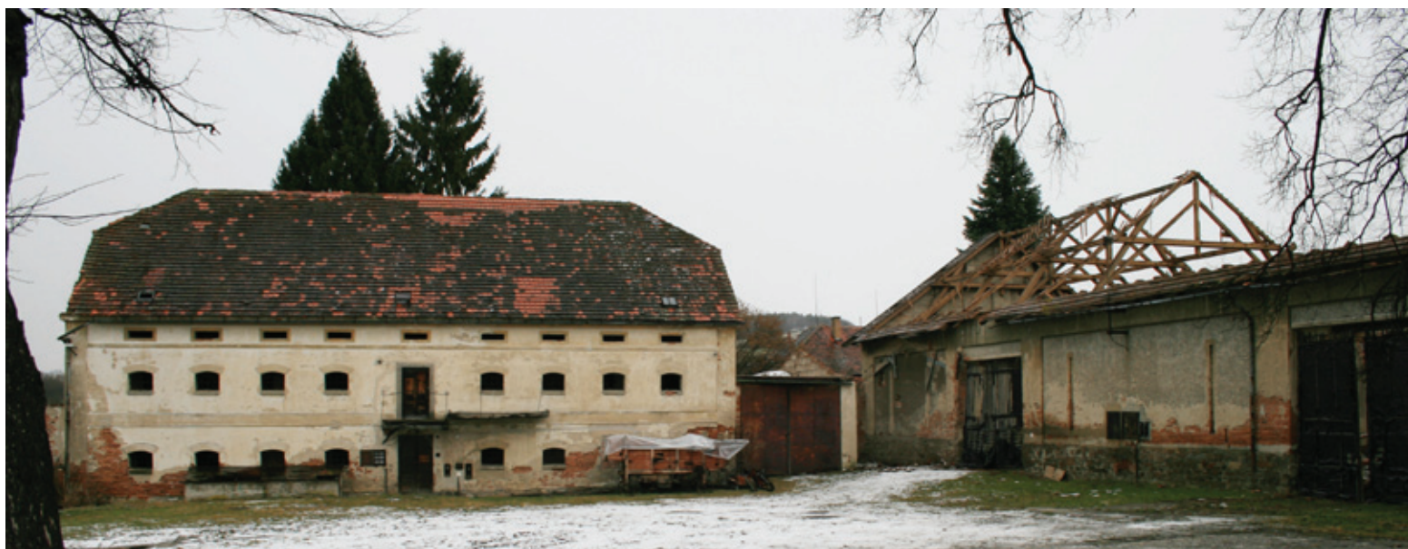
Historická sýpka (vlevo) potřebuje obnovu střechy za 700 000 Kč. Polovinu mají Volyňští zaplatit ze svého rozpočtu.