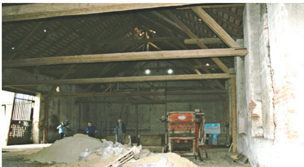
Snímek pořízený uvnitř stodoly bude brzy pouhou vzpomínkou, tato budova se právě bourá.

její rekonstrukce bude tím pádem specifická a nákladná. Nicméně příznivci volyňské historie a umění teď mají o čem přemýšlet. „Jednu ze stálých expozic by mohla tvořit například galerie bratří Boháčů. Další zajímavou představou by jistě bylo i zřízení víceúčelové síně v podobě, kterou má Maltézský sál strakonického hradu. Síň by posloužila při různých slavnostně kulturních událostech nebo pro potřeby divadelní přehlídky,“ nastínil Skalický.