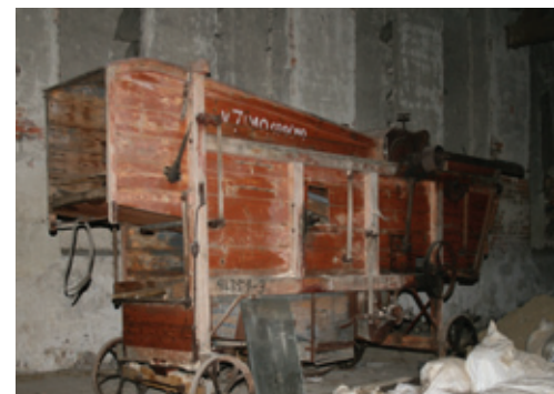
Objekt bývalé stodoly, která tvořila pravé křídlo sýpky, sloužil mimo jiné pro uskladnění zemědělských strojů.

uvažuje o vzniku muzea. Vedoucí volyňského muzea, archivář Karel Skalický řekl: „Líbí se nám představa, že kromě staré panské sýpky - tvrze, by Volyni sloužila i tato nová panská sýpka. Její prostory jsou vhodné ke zřízení expozic a depozitářů. Ty by přešly pod naši správu.“ Upozornil na to, že námětů je několik a definitivní stanovisko zatím nelze očekávat. Chátrající sýpka má tři podlaží, je ve dřevě,