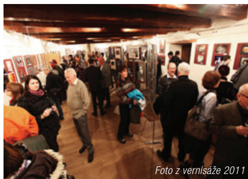
Foto z vernisáže 2011

Strakonice námět Žena uchopily poprvé v roce 1971, kdy s ním oslovily fotografický svět. A v letošním roce se profesionálové i amatéři