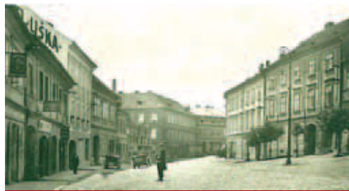
Pohled z roku 1920