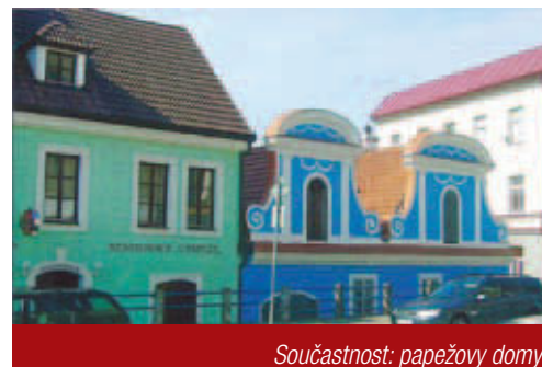
Současnost: papežovy domy