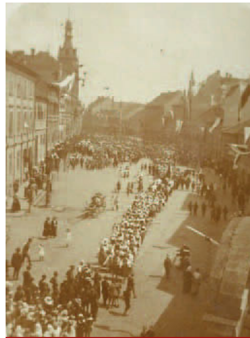
Pohled -církevní slavnost kolem papežových domů.