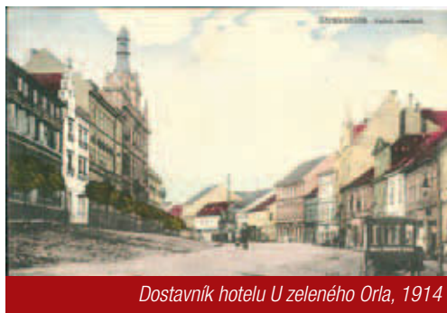
Dostavník hotelu U zeleného Orla, 1914