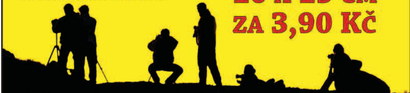
FOTO 10 X 15 CM ZA 3,90 Kč

AKCE PLATÍ OD 15.10. do 15. 11. 2014. POZNEJTE KVALITU NA VLASTNÍ OČI!