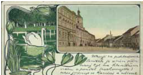
Koláž náměstí r. 1900