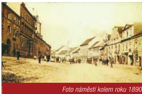
Foto náměstí kolem roku 1890