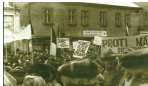
Vzpomínka na 17. listopad 1989 na náměstí

pekařství u Brejchů, v němž prodávají pečivo a výrobky z pekárny v Sušici.