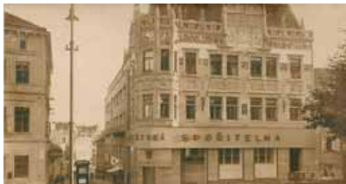
pohlednice z 1. republiky