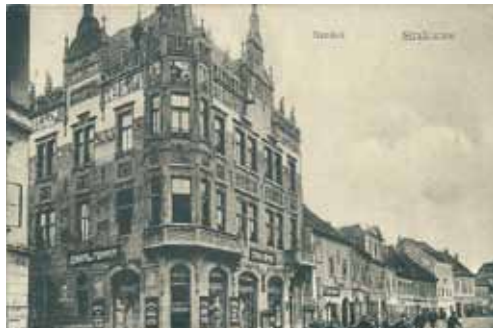
pohlednice z období R-U

1884 zahajuje 1.1. 1887 spořitelna činnost v nuzných poměrech. Teprve však roku 1906 staví spořitelna na náměstí vlastní dům, do jehož I. patra se v roce 1907 přestěhovala. Samozřejmě, že časem prostory