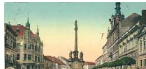
pohlednice z období R-U