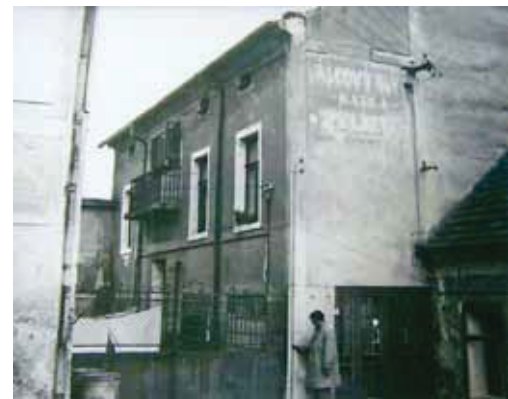
Zelenkuv válcový mlýn