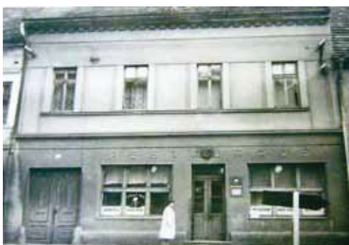
Restaurace U Vachtů

Než budeme pokračovat Siebertovo /Lidickou/ ulicí projdeme si dvě již neexistující ulice. Mlýnskou a Martinskou, které stály v místě obchodního centra Hvězda a Ellerovy ulice. Vedly směrem k ramenu Otavy