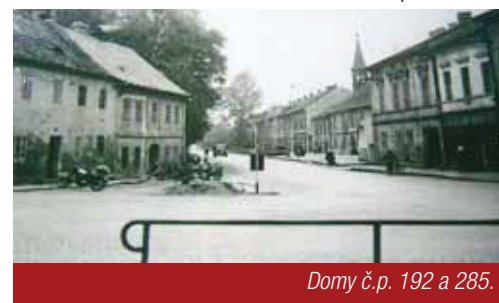
Domy č.p. 192 a 285.