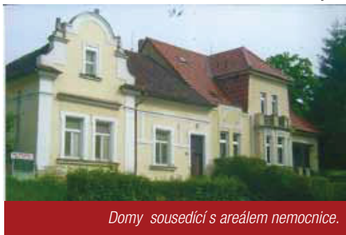
Domy sousedící s areálem nemocnice.