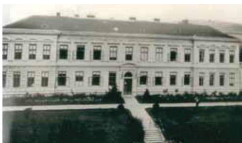
Původní vchod do nemocnice, dnešní dětské oddělení.