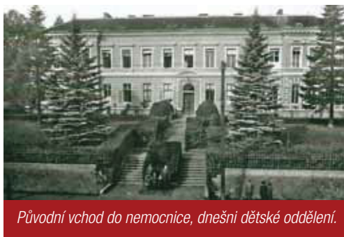
Původní vchod do nemocnice, dnešní dětské oddělení.