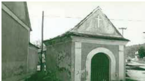
Kaplička sv. J. Nepomuckého před opravou