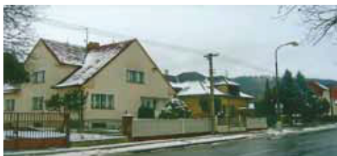
Domy č. p. 431, 500 a 518 rok 2015 v zimě