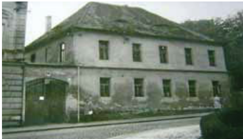
Foto domu č.p. 193 asi rok 1962