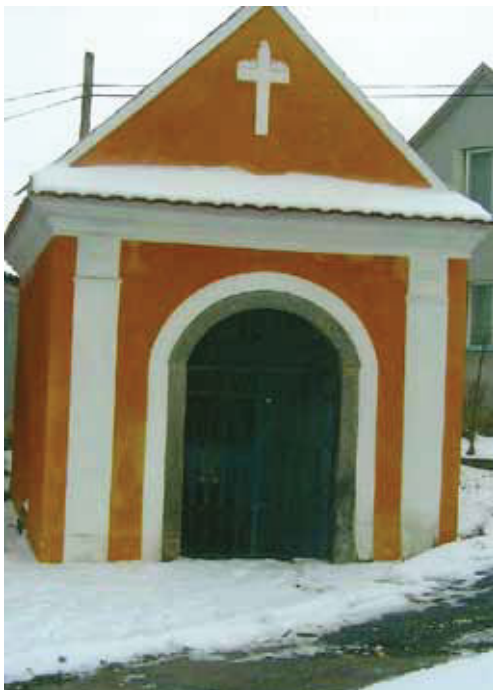
Kaplička sv. J. Nepomuckého po opravě r. 2014