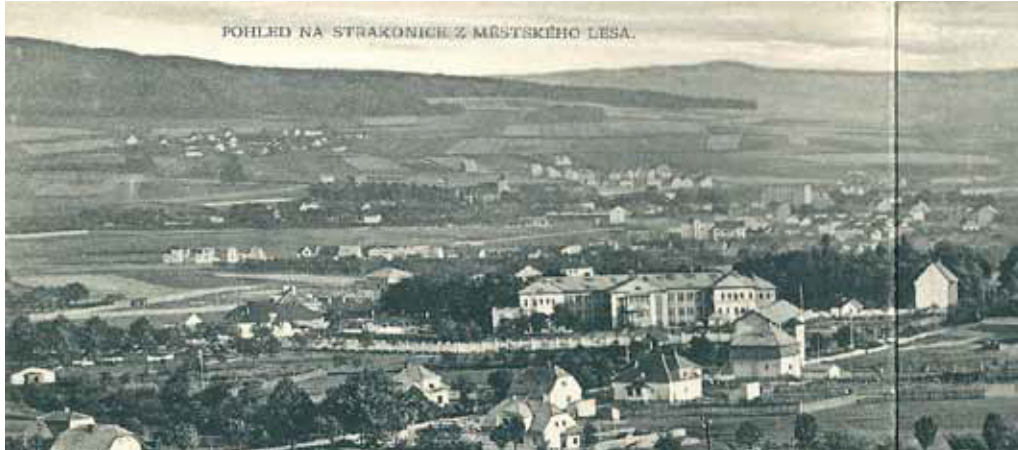
Pohled na město a Radomyšskou ulici asi 1920