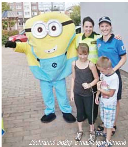
Záchranné složky s maskotem Mimoně

Žáci a studenti znovu míří do lavic a učitelé za katedru a před tabuli, aby předali své znalosti dalším generacím. Ne však všichni se tak z radostí vrhají zpátky do školy. Jak si ale zpříjemnit první školní den a další zážitky z těchto institucí plných vědomostí, než se zúčastnit akce, kterou pořádá obchodní dům Maxim.