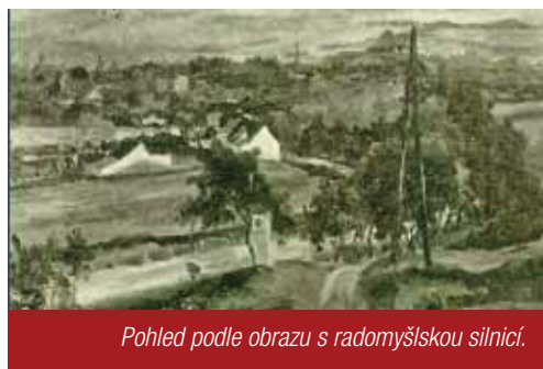
Pohled podle obrazu s radomyšlskou silnicí.

dolní části je odbočka k doleva k moštárně. Zde, za mých mladých let, bývala koroptvárna s mnoha voliérami s velkým množstvím koroptví pro mysliveckou společnost. Často jsem sem chodil, protože zde bydlel můj kamarád Jirka Zábranský, později vysoký důstojník a funkcionář vojenského letectva. My ale pokračujeme dál přes koleje trati Strakonice - Březnice a jdeme po hrázi Dolního řepického rybníka (zvaného též Podryšovský -