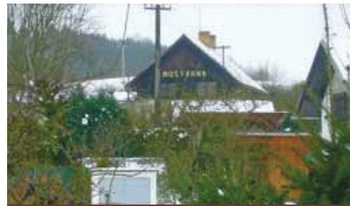
Moštárna, dříve koroptvárna u řepické zastávky.