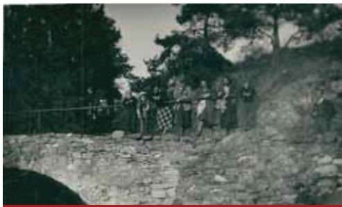
Kamenný můstek před Pravdů mlýnem.