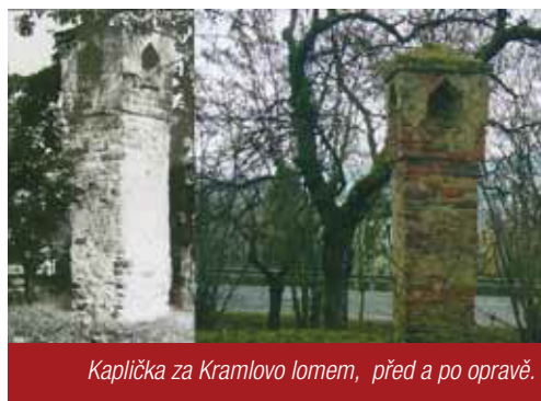
Kaplička za Kramlovo lomem, před a po opravě.