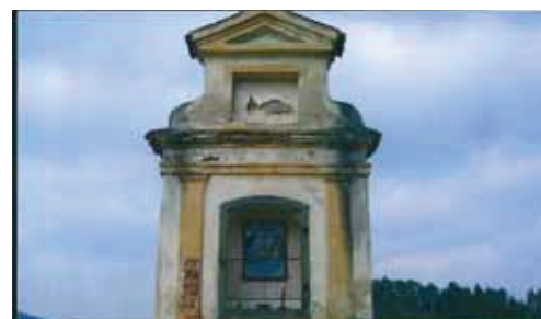
Kaplička nad Řepickým rybníkem.

podle kopce Ryšová). Dojdeme k odbočce k dalším rybníkům. První bude Pilský, na který jsme