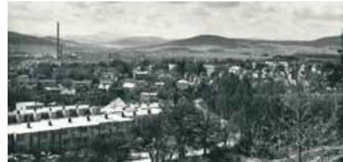
Řadová domky v Jiráskovo ulici

Od vrchu Ostrý se z kopce dostaneme ke křižovatce vedoucí vlevo do Řepice. Za křižovatkou jdeme kolem louky, kde růstávalo dřív velké množství pečárků polních / žampiony/. Mezi stromy se ukrývá lom