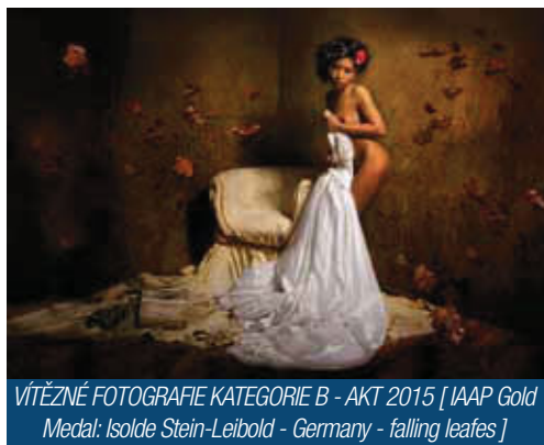
VÍTĚZNÉ FOTOGRAFIE KATEGORIE B - AKT 2015 [ IAAP Gold Medal: Isolde Stein-Leibold - Germany - falling leafes ]

Tato soutěž je značnou výzvou pro amatérské i profesionální fotografy z celého světa, kteří pracují s tématem ženy a ztvárňují je ve všech situacích, které v životě ženy mohou nastat. Letošní ročník je speciální tím, že vedle tradičních kategorií žena a akt jsou nově otevřeny i dvě