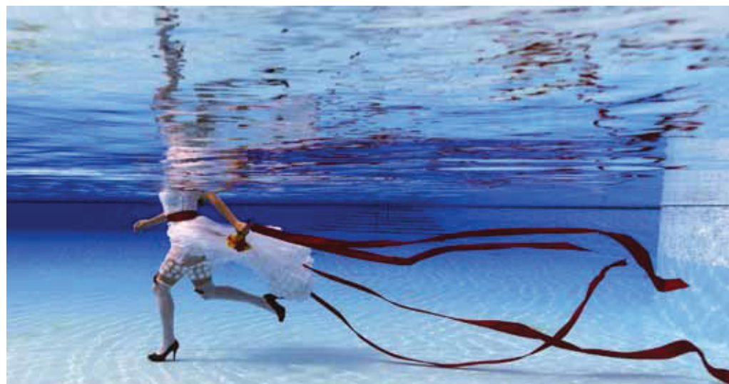
VÍTĚZNÉ FOTOGRAFIE KATEGORIE A - ŽENA 2015 [FIAP Blue Ribbon: Petr Kleiner - Czech Republic - Svatební]

16:00 do 20:00. Výběr nejlepších fotografií bude dále k dispozici v krásném prostředí Maltézkého sálu a sálu U Kata až do 30. 1. 2016.