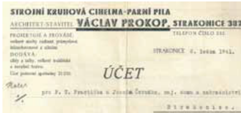
Starý účet z kruhové cihelny pana Prokopa