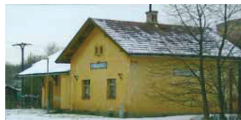
Vlaková zastávka Řepice