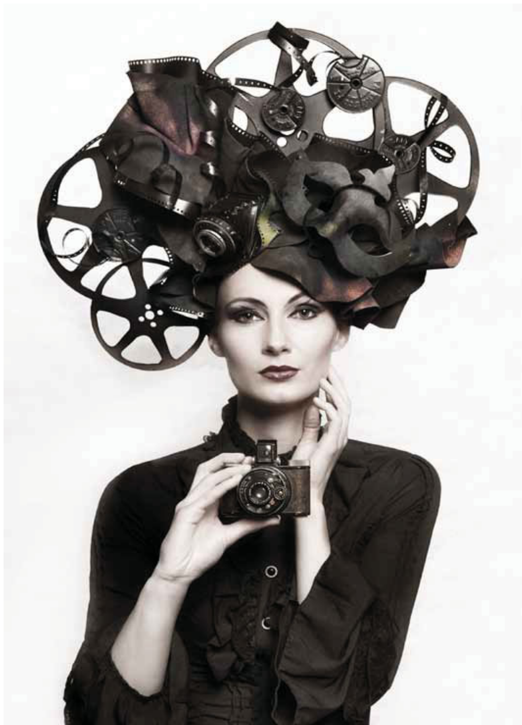
VÍTĚZNÉ FOTOGRAFIE KATEGORIE A - ŽENA 2015 [ FIAP Gold Medal: Isolde Stein-Leibold - Germany - Photographica ]

Přípravy patnáctého ročníku mezinárodního fotografického bienále „ŽENA / WOMAN STRAKONICE 2015“ ve Strakonících jsou opět v plném proudu. Jedná se o tradiční významnou mezinárodní akci, která má již za sebou dlouhou historii od roku 1970.