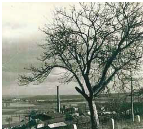
Foto staré do cihelny

Od vrchu Ostrý se z kopce dostaneme ke křižovatce vedoucí vlevo do Řepice. Za křižovatkou jdeme kolem louky, kde růstávalo dřív velké množství pečárků polních / žampiony/. Mezi stromy se ukrývá lom