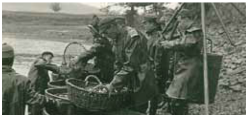
Výlov Dolejšího řepického rybníka