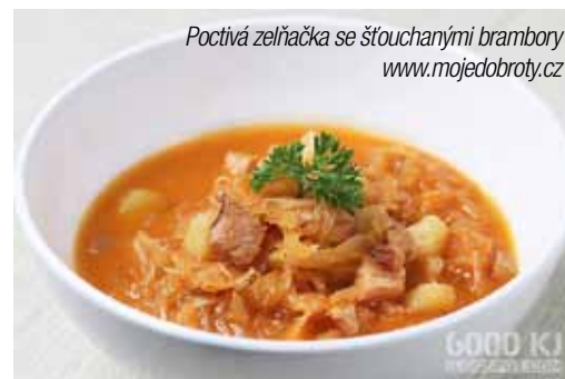
Poctivá zelňačka se šťouchanými brambory www.mojedobroty.cz