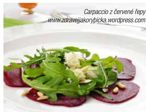
Carpaccio z červené řepy www.zdravejjakorybicka.wordpress.com