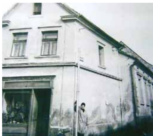
Dům č. p. 354 dnes zde stojí č. p. 1436

redakce@ocmaxim.cz Bezděkovská 30, Strakonice 386 01 727 818 359