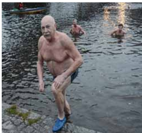
pokračování z titulní strany

Dalším otužovacím prostředkem může být sauna se studenou koupelí. Lidé, kteří se neotužují jinak, by ji kvůli zvýšení otužilosti měli navštěvovat alespoň jednou týdně.