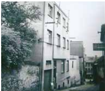
Dům v Hrnčířské ulici /dětské zubní/