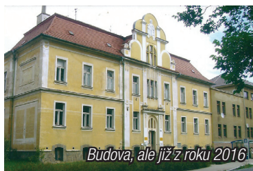
Budova, ale již z roku 2016