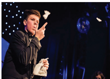
pokračování z titulní strany

Na soutěže nejedím, protože si myslím, že když je člověk v něčem dobrý, nemusí