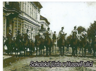
Sokolská jízdva v Husově ulici