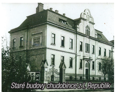
Staré budovy chudobince z I. Republiky

Na protějším rohu ulice Husovy a Plánkové stojí dům č. p. 353, bývalá Hospodářská odborná škola. Dříve do ní byl vchod i z ulice Husovy. Se stavbou