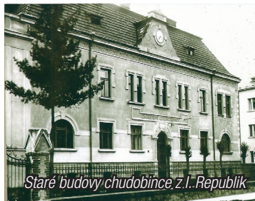
Staré budovy chudobince z I. Republiky

Na protějším rohu ulice Husovy a Plánkové stojí dům č. p. 353, bývalá Hospodářská odborná škola. Dříve do ní byl vchod i z ulice Husovy. Se stavbou