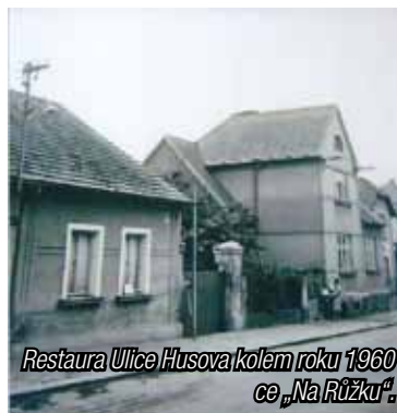
Restaura Ulice Husova kolem roku 1960 ce „Na Růžku“.

došlo ke kompromisu a vznikla jedna třída v budově odborného učiliště v Husově ulici. Ve druhém patře pak ředitelna, sborovna a kabinet. Na odpoledne si škola vypůjčovala 5 tříd od učiliště. Škola začínala s obory strojírenské technologie, elektro, stavebním