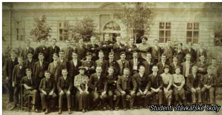
Studenti stávkářské školy

a textilním. Vedením školy byl pověřen Ing. František Chromý /v letech 1961-1971/, sbor měl tři stálé členy a 38 externistů. V prvním roce 1960/1961 bylo 12 tříd SPŠP s 287 žáky a dvě třídy 55 studenty. Rok na to již 469 studentů. Rozhodnutím z 31.10.1961, bylo povoleno zřízení střední průmyslové školy s denním studiem, které po 4 letech bylo zakončeno maturitou. Do školy s novým názvem Střední průmyslová škola strojnická ve Strakonících na-