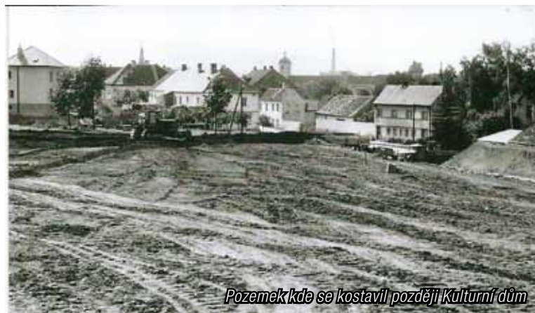
Pozemek kde se postavil později Kulturní dům

došlo ke kompromisu a vznikla jedna třída v budově odborného učiliště v Husově ulici. Ve druhém patře pak ředitelna, sborovna a kabinet. Na odpoledne si škola vypůjčovala 5 tříd od učiliště. Škola začínala s obory strojírenské technologie, elektro, stavebním