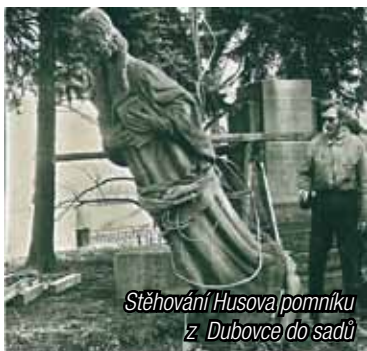
Stěhování Husova pomníku z Dubovce do sadů