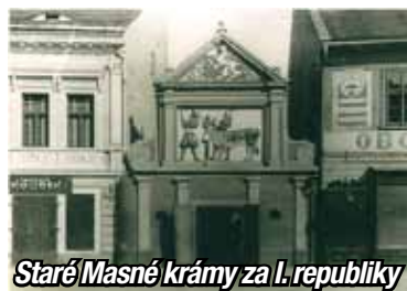
Staré Masné krámy za I. republiky