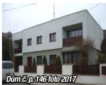
Dům č. p. 146 foto 2017