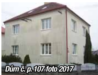
Dům č. p. 107 foto 2017