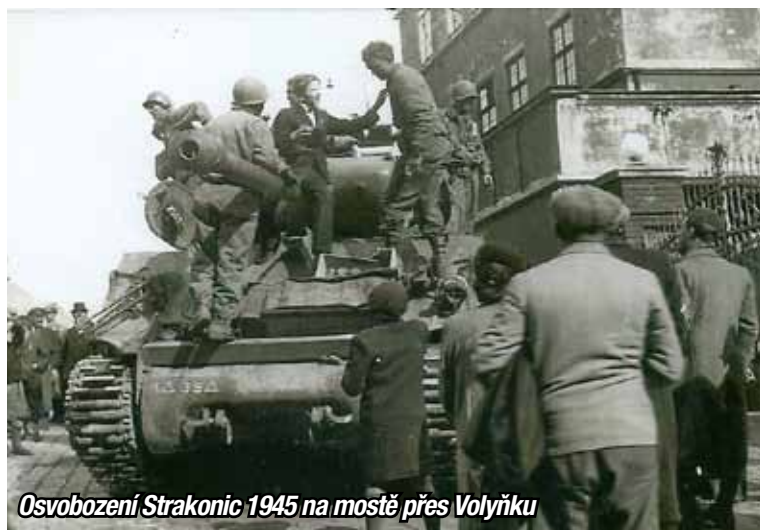
Osvobození Strakonice 1945 na mostě přes Volyňku