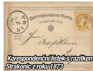
Korespondenční lístky s razítkem Strakonice z roku 1873