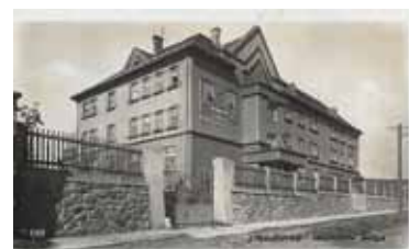
Pohlednice z roku 1934, hospodyňská škola.

se začalo v roce 1986 a otevřena byla slavnostně 26. října 1988 a má kapacitu 220 míst. Stávající Domov mládeže v Plánkovo ulici se začíná stavět v roce 1988 a v říjnu 31. roku