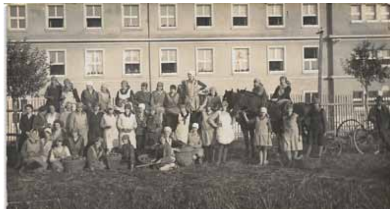
Chovankyně hospodyňské školy na zahradě /dnes parkoviště proti bývalému OÚ.

Svatopluka Čecha a Poděbradova. Dříve v těchto místech byla zahrada a políčka, která patřila k následujícím budovám s č. p. 430. Zde bývala Hospodyňská škola a o ní si něco povíme.