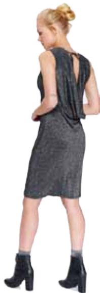
Černé šaty se stříbrnou nitkou Top Secret 899,-

Chystáte se na ples a nevíte co si vzít na sebe? Pořídte si nové šaty. Podívejte se, v jakých budete zaručeně královnou plesu! Jaké se vám líbí nejvíce? Jste spíše pro princeznovské, nebo pro sexy šaty? Na plese byste měla zazářit, ale zároveň se cítit pohodlně a dobře. S těmito šaty to jistě zvládnete.