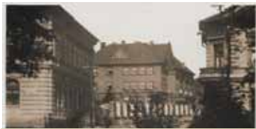
Hospodářská, hospodyňská škola a Protivínská restaurace

Pokračujeme ulicí Plánkova za křižovatkou s ulicí MUDr. Jiřího Fífy a to domem č. p. 921, jehož majiteli