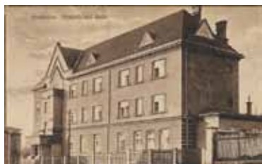
Pohlednice z roku 1926, hospodyňská škola.

Pokračujeme ulicí Plánkova za křižovatkou s ulicí MUDr. Jiřího Fífy a to domem č. p. 921, jehož majiteli