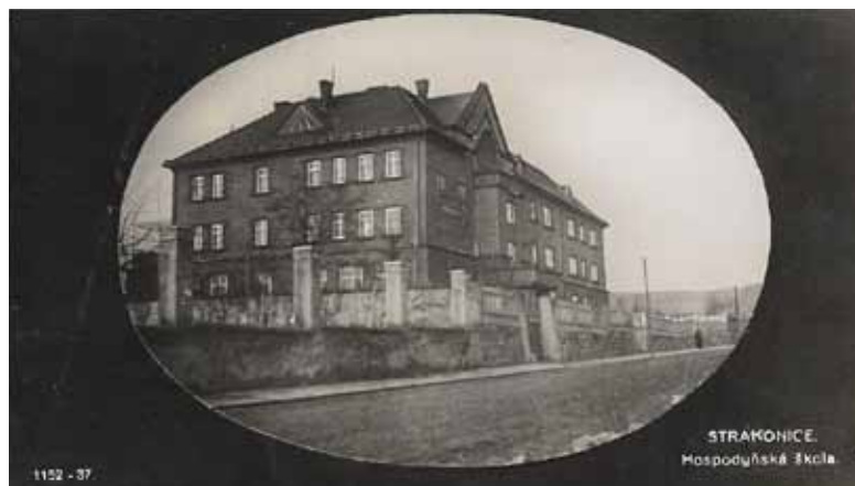
Hospodyňská škola na pohlednici z I. republiky.