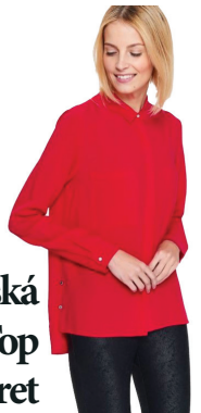
Dámská košile Top Secret 729,-