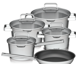
Sada nádobí G21 Gourmet Magic s cedníkem, 9 dílů, nerez