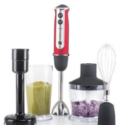
Tyčový mixér G21 VitalStick 800 W, Red/Black