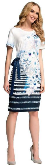
Ajso šaty 1890 Kč