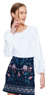
Dámská sukně Top Secret 1179 Kč