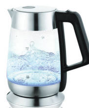
Rychlovarná konvice G21