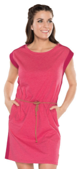
Dámské šaty 599 Kč