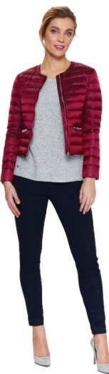
Dámská prošívaná bundička Top Secret 2079 Kč