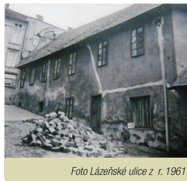
Foto Lázeňské ulice z r. 1961