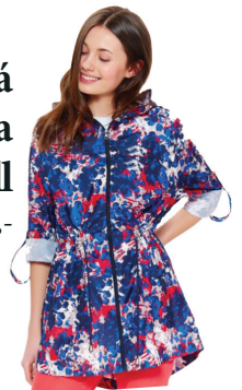
Dámská jarní bunda Troll 819,-