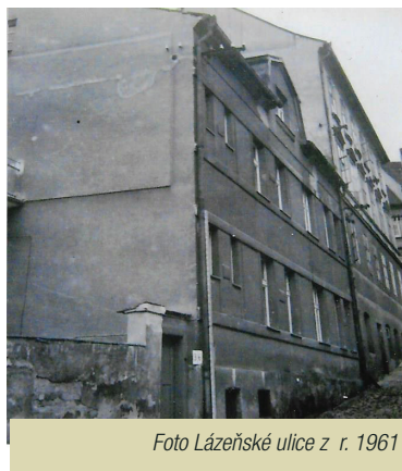
Foto Lázeňské ulice z r. 1961