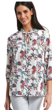
květovaná ENNY halenka 1290 Kč