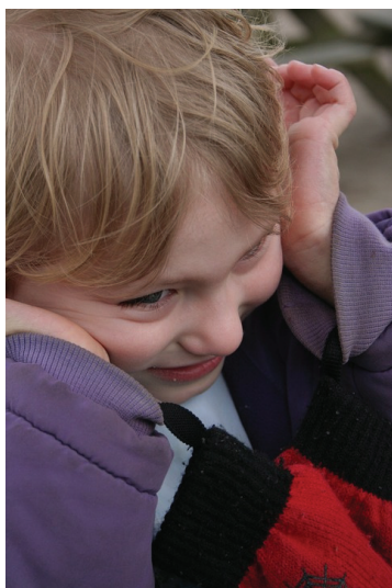
pokračování z titulní strany

specifická nadání a dovednosti jedinců s autismem. Jedná se o den, kdy jsou osoby s autismem vřele vítány a zahrnovány do společenských událostí po celé planetě, přičemž se často svítí barevnými světly – většinou modrými (barva komunikace a vyjádření) a zlatými (chemická zkratka „Au“ – první slabika slova „autismus“).