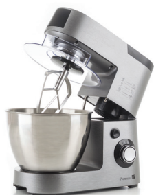
Kuchyňský robot G21 Promesso Iron Grey s mlýnkem a mixérem

Přeji dobrou chuť a ráda uvítám Vaše názory na email: svetreceptu@seznam.cz