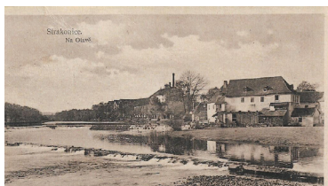
Pohlednice na Pětikolský mlýn z roku 1917