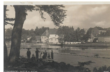
Pohlednice na Pětikolský mlýn z roku 1929