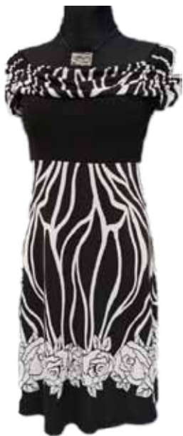
šaty MARIE 1630 Kč