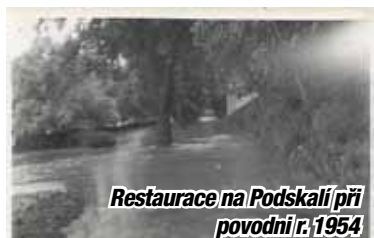
Restaurace na Podskalí při povodni r. 1954