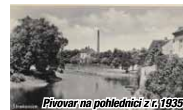
Pivovar na pohlednici z r. 1935