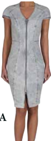
šaty KIARA 2290 Kč