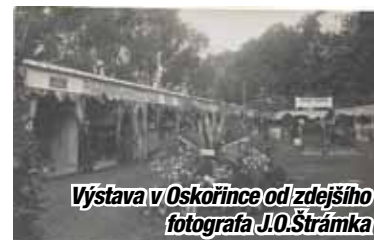
Výstava v Oskořince od zdejšího fotografa J.O.Štrámka

na zamrzlou Otavu a vyřezávali ledové kvádry, které koňskými povozy rozváželi po zdejších hospodách k chlazení sudů s pivem ve sklepích. Podobně i do Měšťanského pivovaru. Na město pivo vozili Lázeňskou ulicí, která měla značné stoupání a tak dole museli připrahnout ještě jeden pár koní, aby do náměstí mohli vyjet. Tehdy bylo náměstí na úrovni s ulicí