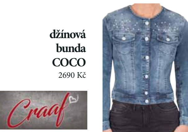
džínová bunda COCO 2690 Kč