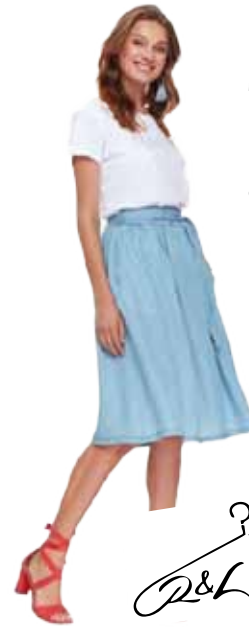
sukně Top Secret 949 Kč