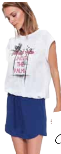
tričko s potiskem Drywash 359 Kč