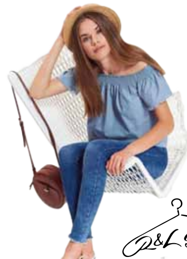
top na ramena Troll 649 Kč