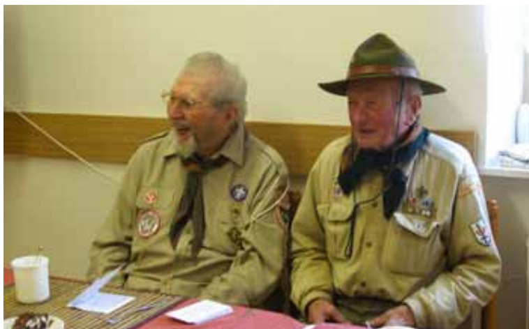
pokračování z titulní strany