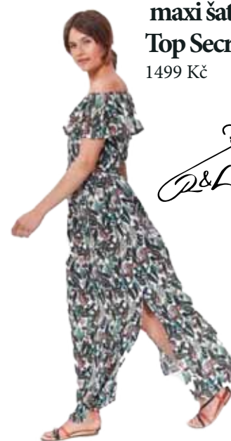
maxi šaty Top Secret 1499 Kč