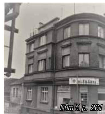
Dům č. p. 261