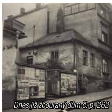
Dnes již zbouraný dům č. p. 262