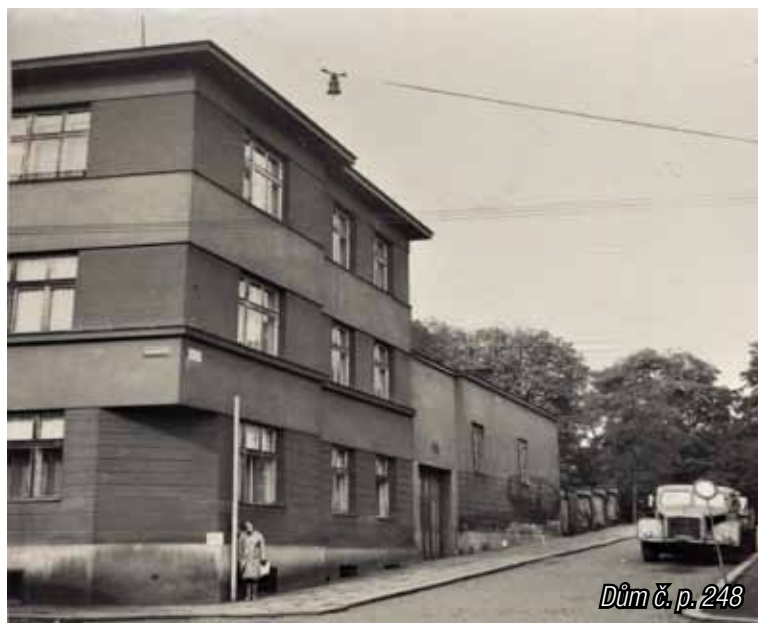
Dům č. p. 248

/1874, Račovice/ a dělník pracující ve stejné fabrice Václav Slavík /1890,