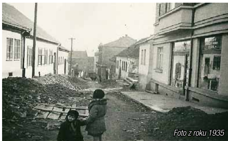
Foto z roku 1935