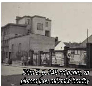
Dům č. p. 248 od parku, za plotem jsou městské hradby