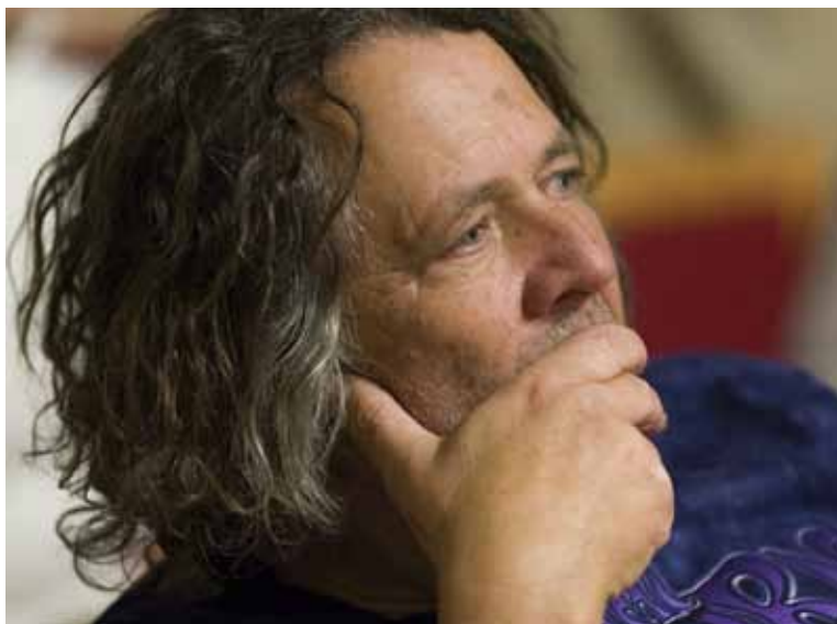
pokračování z titulní strany