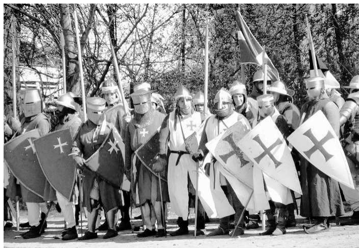
Ukázka bojovné formace Johanitů.

Slavnostní otevření výstavy k Rožmberskému roku dne 7. května 2011 Rožmberkové, řád sv. Jana Jeruzalémského a Strakonicko v Muzeu středního Pootaví