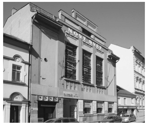
Současná podoba kina Svět.

Následovalo „Uvidíte v našem kině“ a upoutávky na připravované filmy. Poslední diapozitiv uváděl jména promítačů. Potom zazněl gong a zatímco hlediště pozvolna zhasínalo až do úplné tmy, na plátně se objevila obrazová znělka „Týdeníku“ nebo jeho slovenská verze nazvaná „Týždeň vo filme“. Po Týdeníku se někdy dělala kratší přestávka a následoval samotný film.