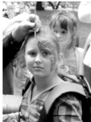
Malování na obličeji.