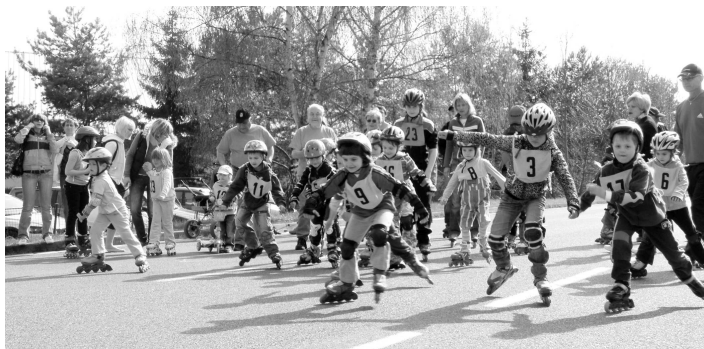
Okamžik z loňského Aprílového bruslení.