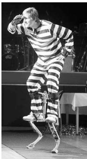
Show na skákacích botách.