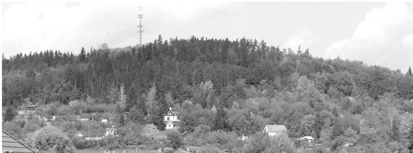
Pohled na Šibeniční vrch s vysílačem.