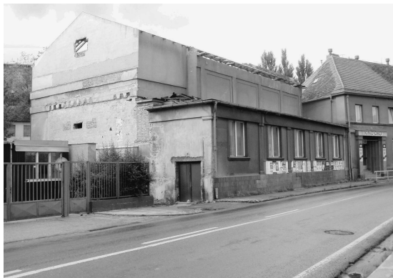
Kino Oko na začátku rekonstrukce v roce 2004.

Pro přiblížení tehdejší atmosféry v hledišti kina Oko připomenu: půl hodiny před začátkem představení hrála reprodukovatelná hudba, asi pět minut před promítáním se otevřela opona, světla mírně pohasla a na plátně se objevil nápis „Vítáme vás“.