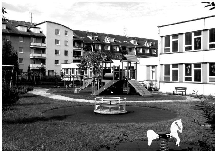
Děti z MŠ Stavbařů se těší z nového hřiště.

Ve všech mateřských školách se v uplynulých letech uskutečnila řada investičních akcí. Část byla realizována z finančních