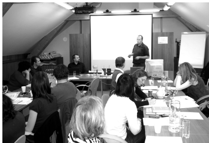
Okamžik ze školení.