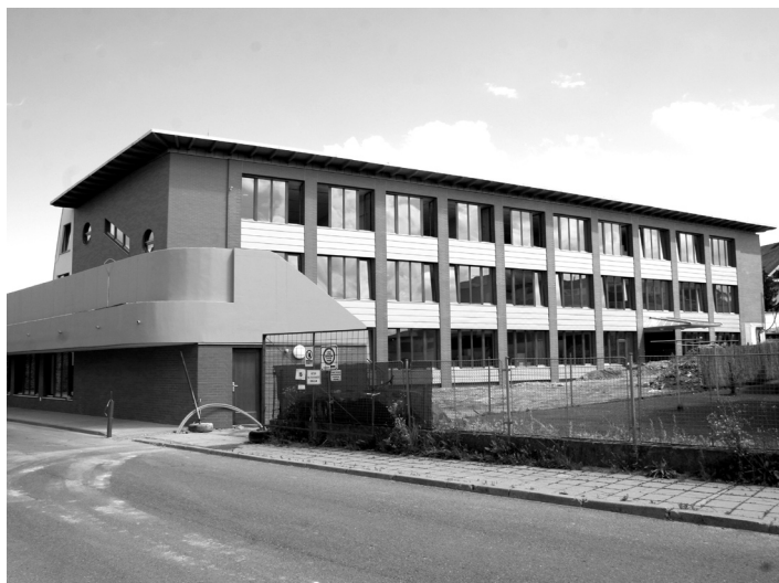
ZŠ Povážská je již připravena na své žáky.