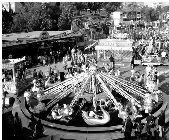
I letos vás čeká lunapark pod Hvězdou.