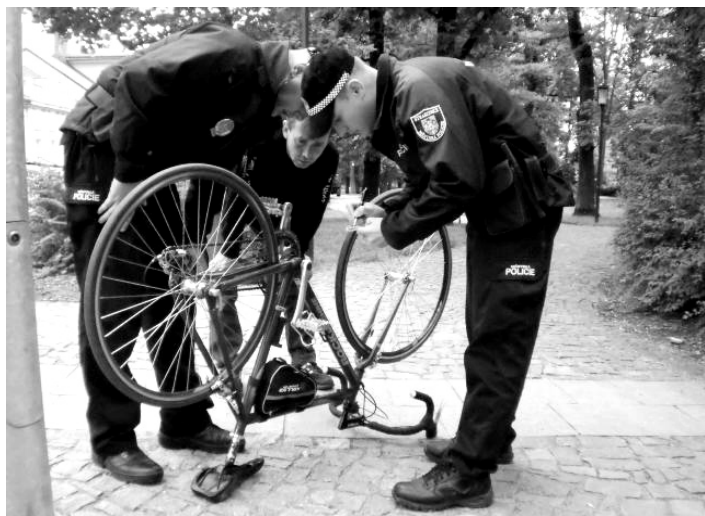
Kontrola továrních značek a výrobních čísel kol.

Jednou z činností, kterou se zejména v letních měsících strážníci městské policie zabývají, je dodržování pravidel silničního provozu cyklisty. Nejvíce prohřešků v této oblasti zaznamenáváme jízdu po chodnících, v místech, kde toto není povoleno dopravními značením. Dalším prohřeškem je nedodržování § 58, kde je stanoveno, že cyklista mladší 18 let je povinen za jízdy použít ochrannou přilbu. Nezůstáváme jen u represivní činnosti, ale řada akcí, které provádíme, směřuje ke kontrolám továrních značek a výrobních čísel kol. – „Na hřbitově u spodního vchodu je na prvním hrobu položena lidská lebka“. Takovéto oznámení přijal strážník městské policie ve večerních hodinách dne 5. 7. Na toto oznámení vyrazila naše hlídka, která místo zabezpečila a následně předala hlídce Policie ČR.