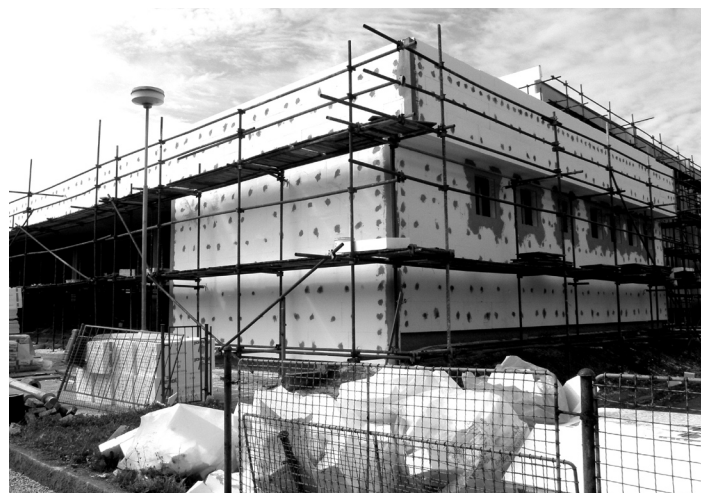
ZŠ J. z Poděbrad bude zateplena.

Současně škola intenzivně pracuje na přípravě žádosti do grantového projektu z Operačního programu Vzdělávání pro konkurenceschopnost Zvyšování kvality ve vzdělávání. Obsahem je zlepšování podmínek pro výuku technických, přírodovědných oborů a řemesel, včetně zvyšování motivace žáků ke