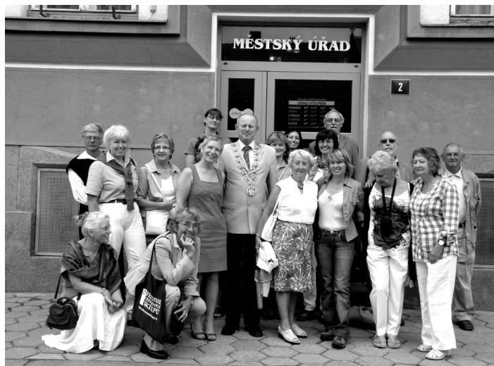
Návštěva strakonické radnice.

Doprovodem hostů byli členové občanského sdružení Calderdale-Strakonice Twinning Association, jehož hlavním cílem je upevňovat přátelství a porozumění mezi lidmi v Calderdale a na Strakonicku. Sdružení bylo založeno v roce 1994.