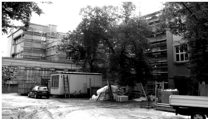
ZŠ F. L. Čelakovského prochází modernizací.

S možností rozšíření kapacity se proto počítá i pro školní rok 2012/2013. Rozhodnuto bude na základě výsledků zápisů do mateřských škol. S možností vy-