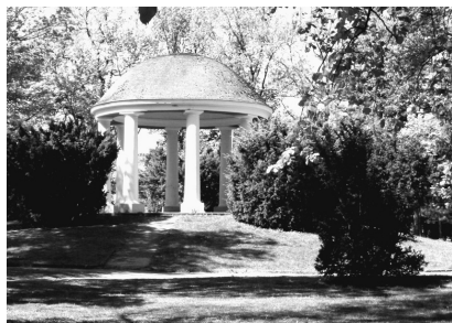
Altán v Rennerových sadech.

Pozdně empírový altán v Rennerových sadech projde opravou. Bude vyměněna dnes již nevyhovující střešní krytina za novou. Dále pak dojde k částečné výměně dřevěných prvků střechy (základu, případně podbití) a k opravě omítek většiny sloupů. Na závěr budou provedeny barevné nátěry. Na