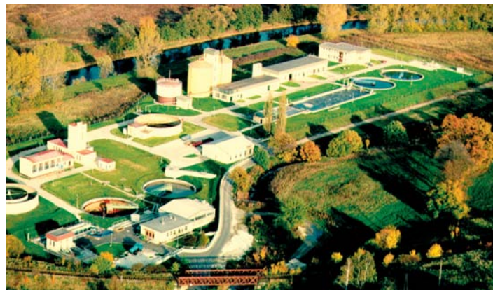
ČOV před zahájením rekonstrukce – letecký pohled.

První neúspěšné pokusy o získání finančních prostředků na realizaci tohoto gigantického projektu se uskutečnily ještě před začleněním ČR do EU – tehdy jsme chtěli rekordně vysokou dotaci získat z tzv. předvstupního fondu ISPA. Následný vstup do EU nám zpřístupnil nové zdroje financování, které s sebou bohužel nesly i větší administrativní náročnost. Přesto jsme se do boje s evropskými dotacemi pustili. Již na konci roku 2004 byl