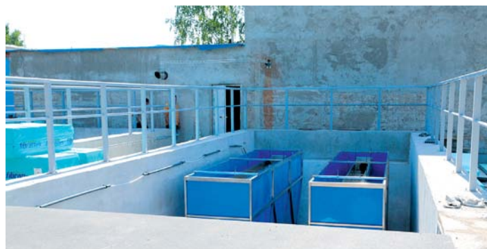
Usazovací nádrže v průběhu rekonstrukce.

Projekt rekonstrukce a modernizace úpravní vod Hajská, jakožto jednoho ze tří zdrojů zásobující město Strakonice a jeho okolí pitnou vodou, přispěje k zajištění větší stability vodohospodářského systému města Strakonice. V návaznosti na termín uvedení této úpravní do trvalého provozu je v současné době připravována rekonstrukce a modernizace další úpravní vody – tentokrát v Pracejovicích.