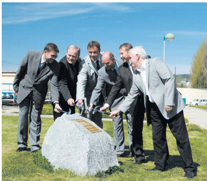
Slavnostní zahájení stavby.

Pro další, 3. výzvu OPŽP, vyhlášenou v následujícím roce, musel být dle požadavků poskytovatele finanční podpory projekt zásadně přepracován. Kvůli omezením tohoto dotačního titulu jsme upustili od velké části původně plánovaných prací. Zredukováný projekt s názvem „Strakonice – intenzifikace čistírny odpadních vod a doplnění kanalizace“ tentokrát dotaci získal a stal se tak jedním ze 443 projektů v ČR zaměřených na snížení znečištění vod, které Operační program Životní prostředí dosud podpořil celkovou částkou více než 35 miliard korun. Státní fond životního prostředí navíc městu umožnil čerpání zvýhodněného úvěru na spolufinancování vlastního podílu.