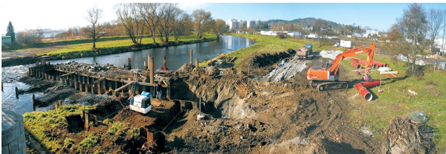
Sběrač E, budování shybky pod řekou Otavou.

Stavba byla slavnostně zahájena symbolickým poklepem na základní kámen na konci dubna 2010. Zatímco ostatní práce byly ještě v plném proudu, na počátku roku 2011 již byla uvedena do provozu zcela nová biologická linka ČOV. Čilý stavební ruch ustal v prosinci loňského roku. I když by se mohlo zdát, že je vše hotovo, projekt ještě zdaleka nekončí. Následovat bude desetiměsíční zkušební provoz, který prověří, zda se podařilo požadavky EU skutečně naplnit. Teprve na konci roku 2012 může být zahájeno kolaudační řízení, které bude tím skutečným završením projektu.