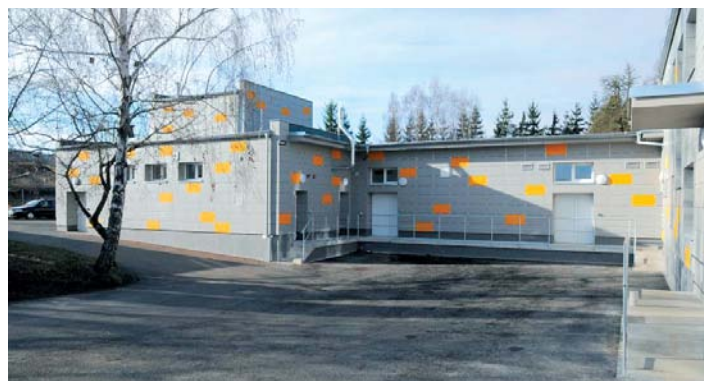
Úpravna vod Hajska po rekonstrukci.

Vodárna v Hajsce byla v provozu přes 70 let, tedy i stav dřívější většiny technologických a stavebních prvků byl na hranici jejich životnosti. Přesto produkovala neustále vysoce kvalitní pitnou vodu. Přípravovaná rekonstrukce měla vést k ještě vyšší kvalitě upravené pitné vody, ale rovněž ke stabilizaci a spolehlivosti technologie úpravy vody tak, jak vyžadují poměry poplatné moderní době. Město začalo projekt připravovat již v roce 2002, kdy byla zadána projektová dokumentace celkové rekonstrukce. Na základě vypracovaného projektu bylo v roce 2004 vydáno stavební povolení. Nicméně v letech 2004–2008 nebyly vyhlášeny žádné vhodné dotační tituly, které by umožnily na