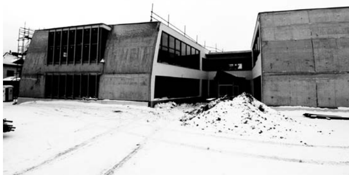
Stavba tělocvičny a pavilonu druhého stupně ZŠ Povážská.

zkušební provozu, chystá se oprava pracovnické úpravny vody. Již třetí etapa revitalizace by měla zpříjemnit život na Sídlišti 1. máje a také sídliště Mír se dočká úprav. Zatím to bude čtrnáct