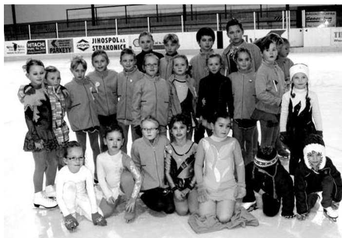
Strakonický krasobruslařský oddíl.