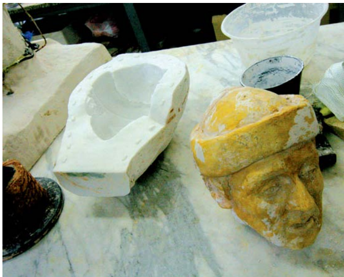
Sádrový odlitek sochy Švandy Dudáka.