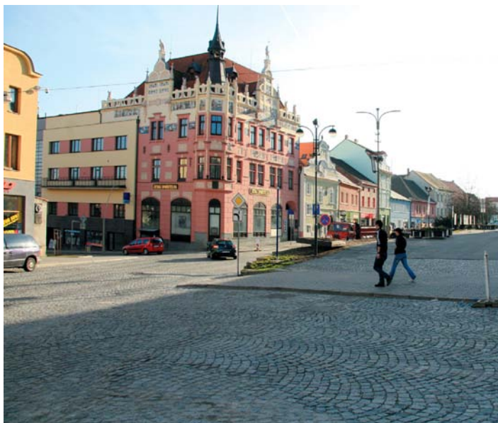
„Zlatý kříž“ před rekonstrukcí.

V zóně Velkého náměstí a navazujících prostor (ulice U Sv. Markéty, Lidická, Pionýrská, Sokolovská, Hrnčířská, Na Stráži) došlo ke kompletnímu odstranění povrchů komunikací a chodníků a k jejich celkovému předláždění; použity jsou převážně přírodní materiály – zejména žula mrákotínského typu. V rámci rekonstrukce komunikací byla rovněž provedena opatření pro zvýšení bezpečnosti a zklidnění dopravy. Zcela nový netradiční vzhled dostala centrální křižovatka umístěná v srdci náměstí – v tzv. „zlatém kříži“. Současně došlo k rekonstrukci a dobo-