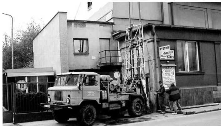
Jedna z posledních fotografií promítací kabiny.

„Vypněte prosím mobilní telefon“ – a potom následoval diapozitiv „Dnešní představení vám promítá...“ se jménem promítače. Zmíněné rekonstrukce elektroinstalace, kdy byly vysekány trasy pro položení nových kabelů, jsem využil k tomu, že jsem nechal vykabelovat trasu z promítací kabiny do hlediště a za promítací