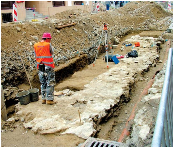
Torzo písecké brány.

kolize s historickými sklepy. Před zahájením realizace totiž panoval názor, že se právě v této lokalitě nachází velké množství nezmapovaných a historicky neevidovaných sklepních prostor. Při pracích v hloubkách pod úrovní terénu tak hrozilo vysoké riziko propadu, které by stavbu mohlo zpozdit, případně výrazně narušit. Naštěstí se tato obava nepotvrdila! Dalším specifickým této centrální plochy je výrazný příčný sklon. Proto bylo třeba soustředit se na odvodnění celé plochy a vymyslet a zrealizovat funkční systém proti prudkým a přivalovým dešťům tak, aby nedocházelo k zaplavování spodní části náměstí.