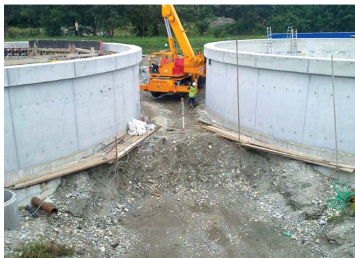
Dosazovací nádrže na ČOV Strakonice.