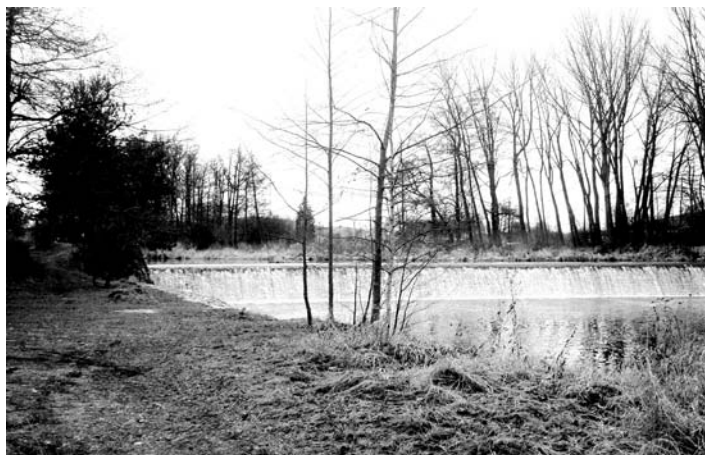
V rámci úprav okolí mutěnického jezů bude i odfrézování pařezu na pravém břehu řeky.

Nejen otužilci, ale také všichni ti, kteří se chodí koupat na řeku Volyňku, jistě přivítají vyčištění jejího břehu a rozšíření místa pro odpočinek a opalování.