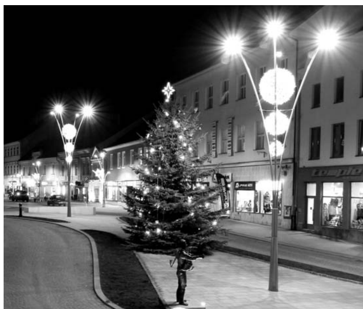
Strakonické náměstí rozzářila nová vánoční výzdoba.