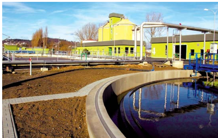
Dokončená stavba ČOV.

Stavba byla slavnostně zahájena symbolickým poklepem na základní kámen na konci dubna 2010. Zatímco ostatní práce byly ještě v plném proudu, na počátku roku 2011 již byla uvedena do provozu zcela nová biologická linka ČOV. Čilý stavební ruch ustal v prosinci loňského roku. I když by se mohlo zdát, že je vše hotovo, projekt ještě zdaleka nekončí. Následovat bude desetiměsíční zkušební provoz, který prověří, zda se podařilo požadavky EU skutečně naplnit. Teprve na konci roku 2012 může být zahájeno kolaudační řízení, které bude tím skutečným završením projektu.