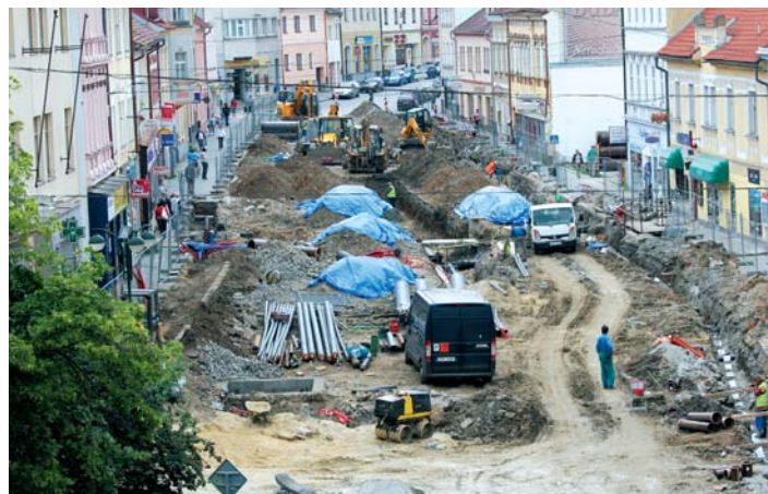
Čitý stavební ruch.

Zájemci o historii města se budou moci s některými z objevených artefaktů seznámit v rámci expozice Muzea středního Pootaví.