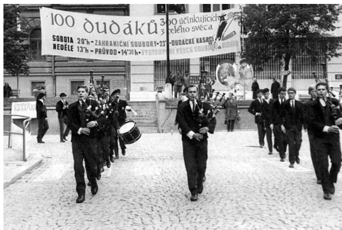
Francouzi – Bretaňci – při slavnostním průvodu městem.

v Českých Budějovicích. Pomáhaly obchodní organizace a nad jednotlivými zahraničními soubory si