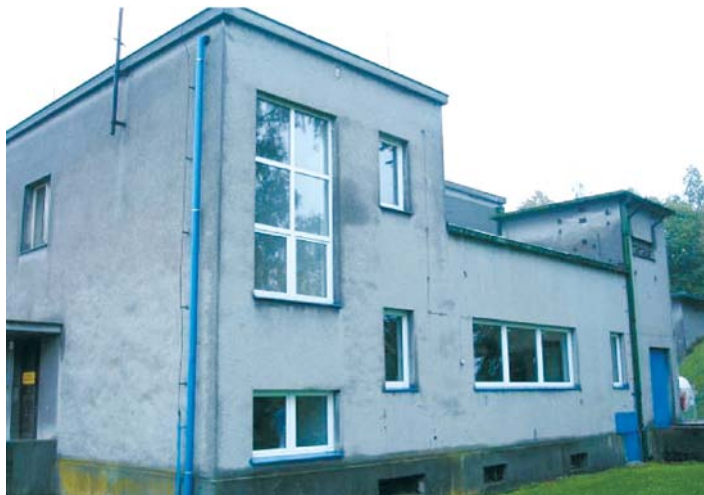
Úpravna vod Hajska před rekonstrukcí.

Do strakonické veřejné vodovodní sítě o délce 86 km je dodávána voda ze dvou vlastních vodních zdrojů, kterými jsou úpravna vody Pracejovice a úpravna vody Hajska, a z jednoho cizího zdroje – z Vodárenské soustavy jižní Čechy. Obě úpravní vod jak Hajska, tak Pracejovice byly trvale v provozuschopném stavu. Nicméně i přes značné úsilí a nemalé částky vynakládané na údržbu se oba provozy a jejich technologie stávaly poměrně zastaralými, a v jistých částech byly dokonce na hranici život-