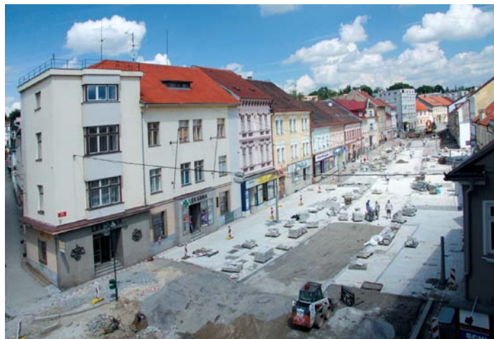
Pokládka finálních povrchů.

Závěrem ještě připomeňme, že na celou stavbu bylo vydáno celkem 11 dokumentů o předčasném užívání (tak jak byly dokončovány jednotlivé dílčí fáze projektu), a také to, že stavba je zkolaudována celkem 8 vydanými kolaudačními rozhodnutími. Přičemž první kolaudační rozhodnutí bylo vydáno 16. 12. 2011 a poslední 13. 1. 2012.