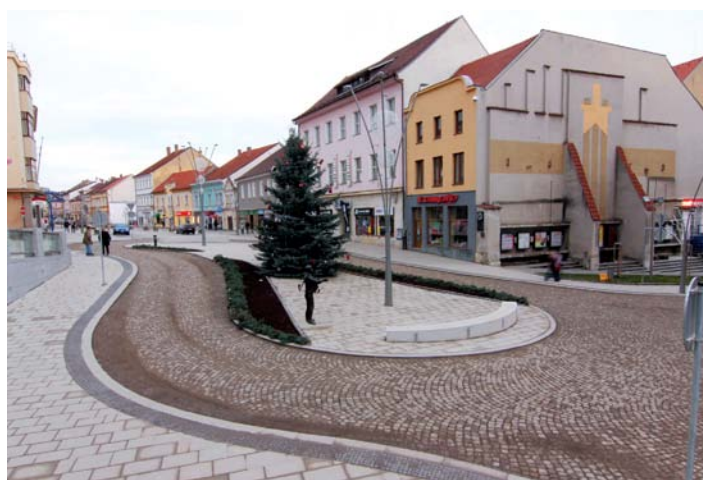
„Zlatý kříž“ po dokončení realizace projektu.

vání kanalizačního a vodovodního řádu a přeložení převážně většiny inženýrských sítí, dále pak k obnově veřejného osvětlení včetně instalace nové vánoční výzdoby, výsadbě vzrostlé zeleně, keřů a trvalek a doplnění drobného mobiliáře (lavičky, odpadkové koše, pítka a hodiny). Byla vytvořena celkem tři stanoviště pro podzemní kontejnerová stání na tříděný odpad – a to v ulici U Sv. Markéty, Sokolovská a Pionýrská.