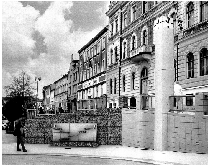
Plánovaná fontána na náměstí.

V průběhu letošního roku bude osazena fontána symbolizující soutok dvou řek – Otavy a Volyňky u nově provedené gabionové zdi na Velkém náměstí. Nyní je již připraveno technické zajištění pro osazení fontány.