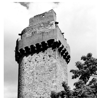
Obranná věž s břitem – Rumpál.

V prosincovém Zpravodaji 2011 jsme vás informovali o havarijním stavu Rumpálu. V současné době jsou již známy výsledky výběrového řízení a termín jeho opravy. Předpokládá se, že s opravou by se začalo začátkem března a dokončena by měla být do konce dubna letošního roku. V rámci opravy proběhne vyztužení ochozu, opravy trhlín podlahy, chrličů srážkových vod a dojde ke sjednocení povrchu stěrkovou omítkou. Opravu provede firma Vertigo Písek, s. r. o., za cenu zhruba 217 ti-