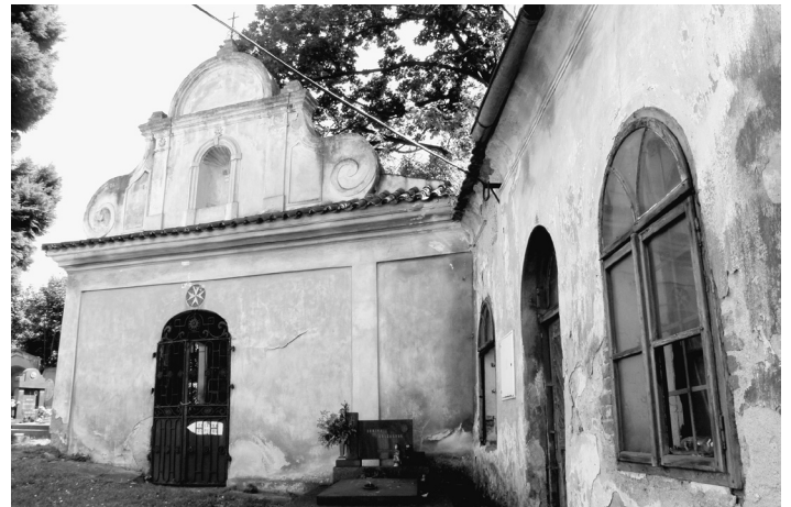
Nejstarší kaple – sv. Vojtěcha – ve městě.

V loňském roce se rekonstrukce dočkalo hned několik objektů sakrální architektury ve Strakonici. Kaplička sv. Jana zvaná též Brušákovice, na kterou přispěli také tři dárci, dále kaple sv. Václava v Předních Ptákoviciích. Na místě zbořených božích muk ve Starém Draževě byla podle fotografií postavena nová a na polní cestě