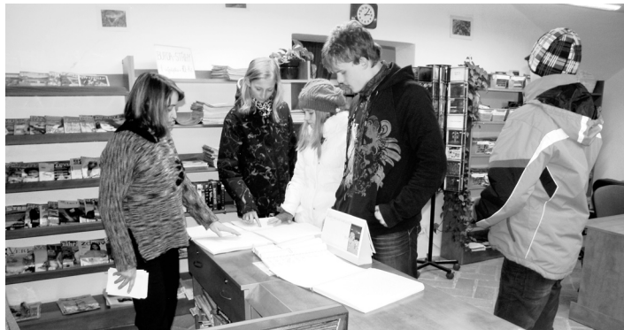
Dětszí zastupitelé se seznámili s oddělením pro nevidomé v místní knihovně.

Mladí zastupitelé se seznámili se zvukovými pomůckami pro běžný život, rozlišovali mince hmatem a bankovky pomocí šablony, seznámili se s Braillovým písmem