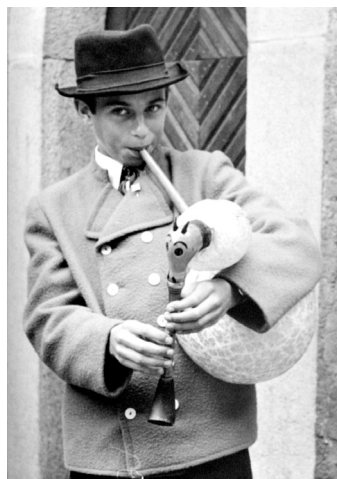
Malý polský dudák III. MDF 1972

a nekonalo se na hradním nádvoří, ale probíhalo před strakonickou radnicí, a to až v sobotu po hlavním večerním pořadu. Nově