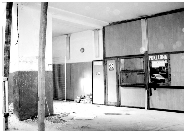
Jeden z posledních pohledů na původní vestibul.

tekla po svažitě podlaze voda. Příčinou byla koroze proděravěná trubka, která přiváděla topnou vodu do radiátoru a pod tlakem oběhového čerpadla byla dále hnána do topného systému. Rychle jsem běžel do výměníku uzavřít páru,