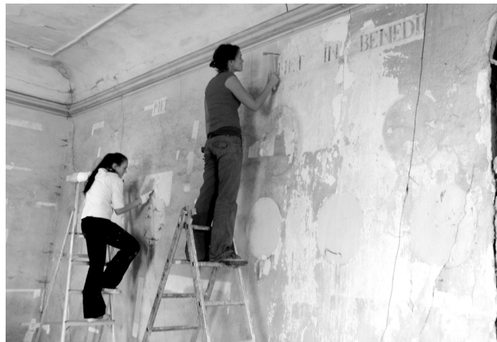
Restaurování nástěnných maleb v kapli sv. Vojtěcha.

Výstavba sběrného dvora, který leží v průmyslové zóně na severovýchodním okraji Strakonice, trvala přibližně rok. Celkové náklady činily bezmála 21 milionů korun, z toho téměř 15 milionů pokryla dotace z Evropské unie a necelý milion poskytl státní fond životního prostředí.