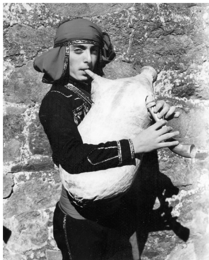
V roce 2000 se na festivalu poprvé představili Gruzinci.