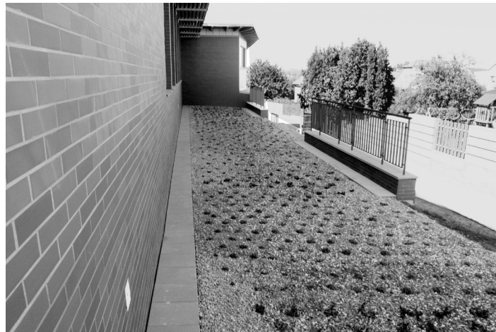
Okolí školy s nově vysazenou zelení.