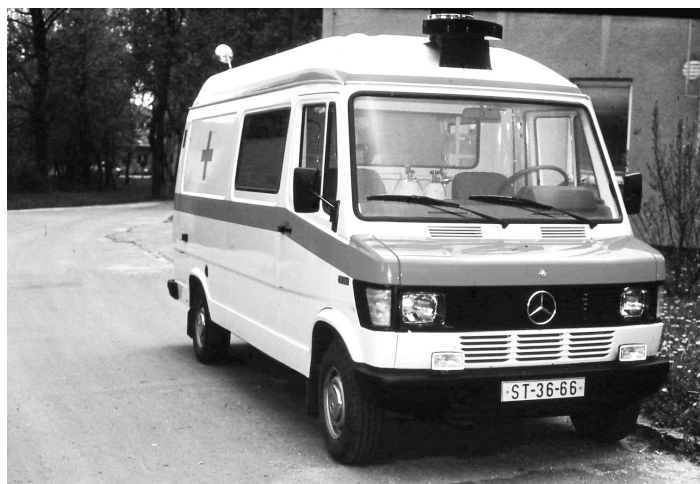
V roce 1980 získala nemocnice žlutočervenou, moderně vybavenou sanitku Reanimobil Mercedes.

Systém přestal vyhovovat, proto v roce 1977 vytvořili novou službu