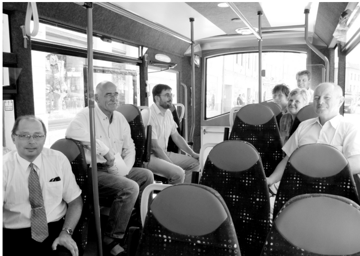
Jízdu minibusem si vyzkoušeli strakoničtí radní i tajemník MěÚ.

Vondrys. Uvažuje se například, že autobusy městské hromadné dopravy budou jezdit v pravidelných dvouhodinových intervalech tak, aby čas odjezdu byl pro cestující