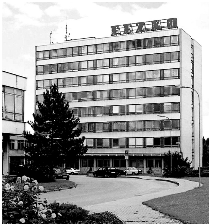
Administrativní budova akciové společnosti Fezko Strakonice.