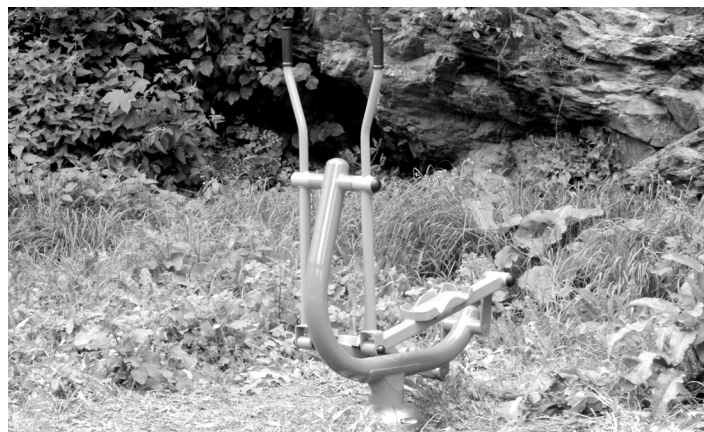
Během srpna byly na strakonickém Podskalí osazeny tři posilovací stroje nejen pro seniory.