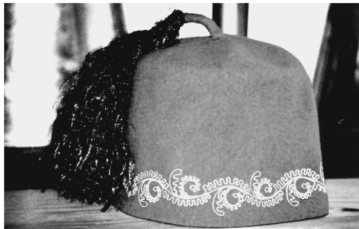
Pokrývka hlavy – fez.

ražďovicka a Prachaticka zřizovány malé dílny a výdejny domácí práce, která byla při výrobě pokrývek hlavy stále využívána. O rozvoji a modernizaci firmy se však ještě mnoho let po válce nedalo mluvit. V letech 1945–65 z důvodu nedostatku finančních prostředků nemohly být žádné větší akce realizovány, byť byly provozy