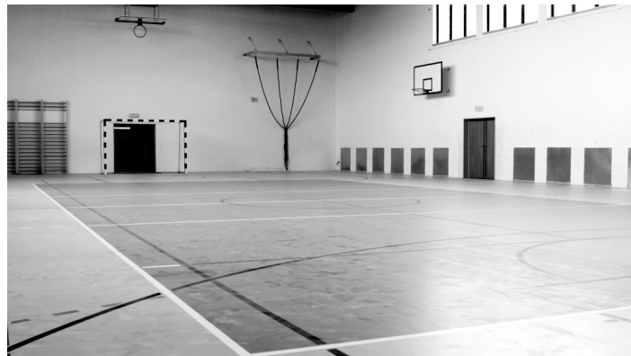
Pohled do tělocvičny.