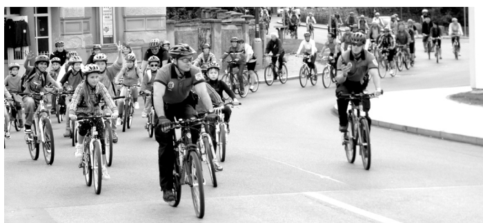
Jízda městem na dopravním prostředku poháněném vlastní silou.

prostředku poháněném vlastní silou, a to v úterý 18. 9. 2012. Hlavním cílem akce je v souladu s letošním tématem nabídnout možnosti a výhody alternativních druhů dopravy a podpořit využívání udržitelných způsobů dopravy. V průběhu týdne od 16. 9. 2012 do 22. 9. 2012 uspořádá odbor životního prostředí ve spolupráci s Městskou policií Strakonice, Policií ČR, Českým červeným křížem, STARZem Strakonice, HUSOTem, Občanským sdružením Cestou vůle a s žáky základních škol následující akce: