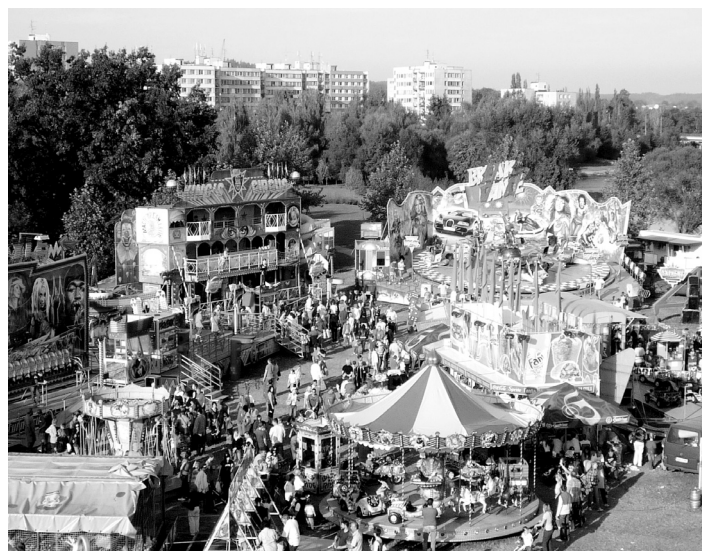
Lunapark pod Hvězdou potěší malé i velké.

Ochutnat budete moci domácí uzeniny, oblíbené smažené bramborové spirály, sýry, palačinky nebo třeba trdelníky. Děti se mohou těšit na malování na obličej nebo samoobslužný zmrzlinový automat. Svou hudební produkci by zde kromě oficiálního programu měla předvést také skupina jihoamerických indiánů. Nezapomeňte se při tom všem pouťovém veselí, nákupech a utrácení také zastavit u charitativních stánků nabízejících zboží z chráněných dílen. Letos by tu měly být nejméně dva – Madlenka, společnost při sdružení Fokus Písek a Hnutí Havlík. Obě organizace pomáhají duševně nemocným lidem.