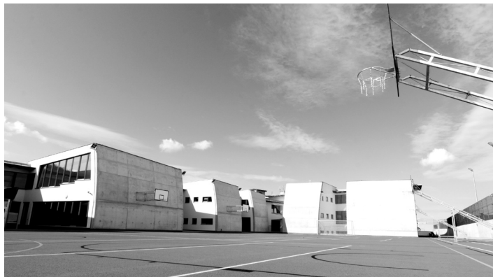
Sportovní hřiště na střeše jídelny.