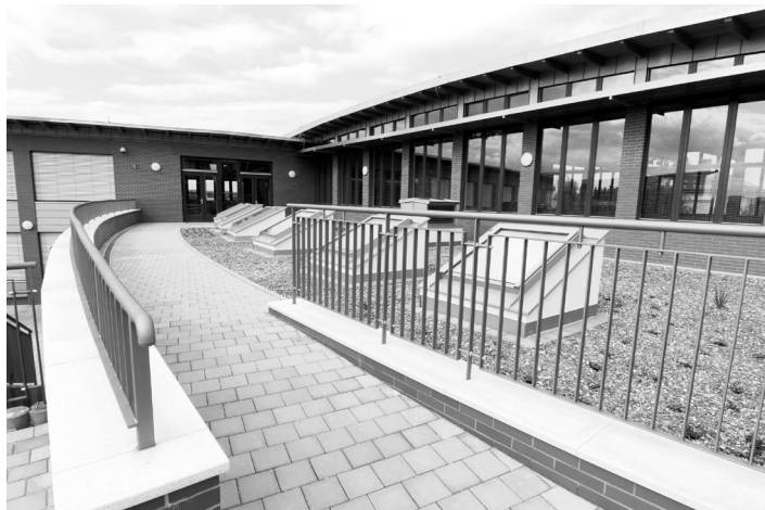
Vchod do II. stupně školy.