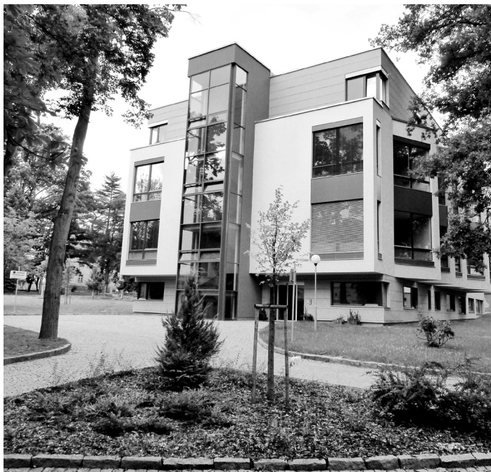
Přístavba chirurgického pavilonu otevřeného 30. srpna 2010.