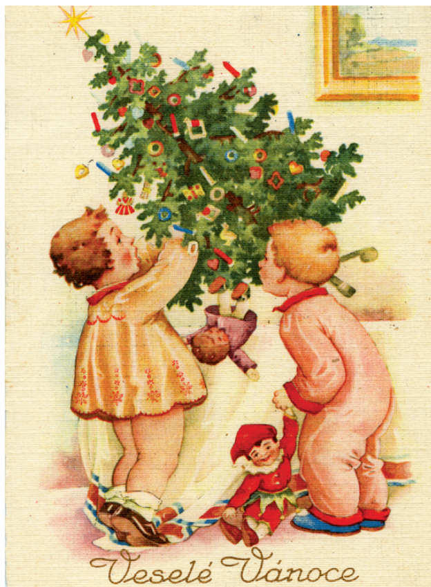
Vánoční pohled z roku 1931, autor kresby C. Kotysan

Zpočátku se zdobily výhradně malé jedle nebo smrky. Zdvěšovaly se ke stropu špičkou dolů, později nahoru. Jinde se stavěly na stůl nebo okno. Na venkově se do 1. světové války často zdobila jen smrková nebo jedlová větev. Po slavnostní večeři se stromeček obvykle odstrojil a dobroty se ještě ten den snědly. S nástupem trvanlivých ozdob se