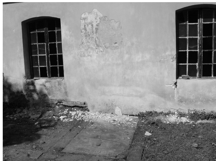
Objevený vstup do krypty.

v rámci stavebních úprav kaple sv. Vojtěcha s prodloužením termínu ukončení realizace a předání smlouveného předmětu díla do 20. 11. 2012 a s navýšením ceny