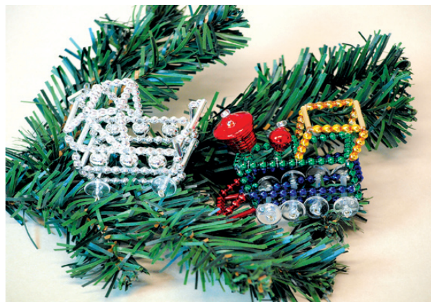
Perličkové ozdoby současné výroby, Rautis Poniklá