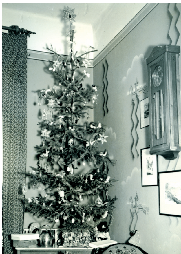
Vánoční stromek z městského prostředí, rok 1935

Již ve 2. polovině 19. století vyráběli foukači v Jizerských horách (okolí Smržkovky, Josefova dolu), Krkonoších (Poniklá, Vítkovice) a Podkrkonoší (Hořice, Doubravice, Bílá Třemešná) skleněné perly různých tvarů a velikostí. Jedna z neúspěšnějších dílen na výrobu perel byla založena v roce 1902 v Poniklé. Perle se stříbrily. Od 80. let 19. století se ve velkém vyvážely, především do Indie. V roce 1908 začala české zboží v Indii vytlačovat japonská konkurence. Během 4 let přišlo mnoho výrobců o práci. Tehdy se zrodil nápad sestavovat z perel vánoční ozdoby, které byly v Evropě i zámoří žádaným artiklem. Podoba ozdob se vyvíjela. Vznikaly nové tvary a používaly se i další materiály. Výroba skleněných perličkových ozdob probíhala podomácku. Do výroby se zapojila celá rodina. Otec nebo děda foukal perle, které se dál zpracovávaly. Každá rodina přísně střežila svá výrobní tajemství, zejména techniku stříbření. Původně se perle stříbrily roztokem olova a zinku,