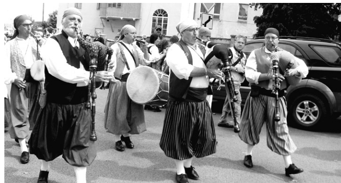
Malorští dudáci, XX. MDF

zaznamenaly dudácké dostavníčko s Jihočeskou filharmonií a koncert duchovní hudby. Regionální pořady se tentokrát zaměřily na Prácheňsko a Moravu se Slezskem. Na XIX. MDF se objevily