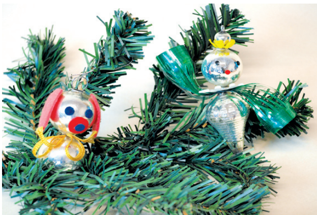
Amalgámové ozdoby kombinované s celofánem, 70. léta 20. století – Muzeum středního Pootaví Strakonice

Po roce 1925 postihla českou výrobu díky konkurenci Japonska opět krize. V roce 1931 uspořádal Sklářský ústav v Hradci Králové ve spolupráci se školou v Železném Brodě přeškolovací kurz pro 14 nezaměstnaných sklářů. Na kurz navázala 3 praktická školení věnovaná výrobě a dekoraci vánočních ozdob. Absolventi se zavázali vstoupit