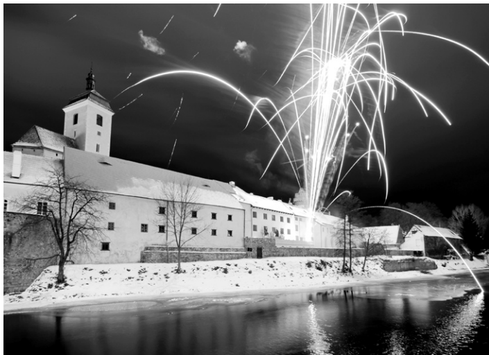
Novoroční ohňostroj nad strakonickým hradem.