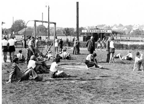
Tyršovy hry 1934, Křemelka – letní cvičiště Sokola.

V roce 1906 má restauraci po panu Kratochvílovi pan Václav Hurych. Od roku 1909 se ruší název Spolkový dům a užívá se Sokolovna. V roce 1910 učinilo ministerstvo války jednotám nabídku, aby se pěstovala střelba a dala na každých 20 členů pušku