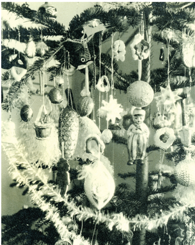
Vánoční stromek z městského prostředí, rok 1935

Na venkově se o Vánocích jedlo sušené ovoce a oříšky, vzácně čerstvé švestky uchované ve studni. Ve městech byla nabídka širší – exotické cukrovinky, kandované ovoce, rosoly, kompoty, bonbony a jiné sladkosti. Na stromek se věšely fondánové cukrovinky, figurky z nugátu a čokolády. Cukrářská hmota se lila nebo tlačila do plechových formiček – kadlubů, vymaštěných mandlovým olejem a vysypaných kukuřičným škrobem. Cukrovinky se balily do papírků, od 2. poloviny 19. století do staniolu. Ve vybraných pražských cukrárnách se na stromek vyrábělo sněhové pečivo, proslulé bylo Jiranovo.