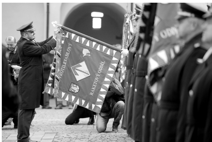
Žehnání bojových praporů ve Strakonici.