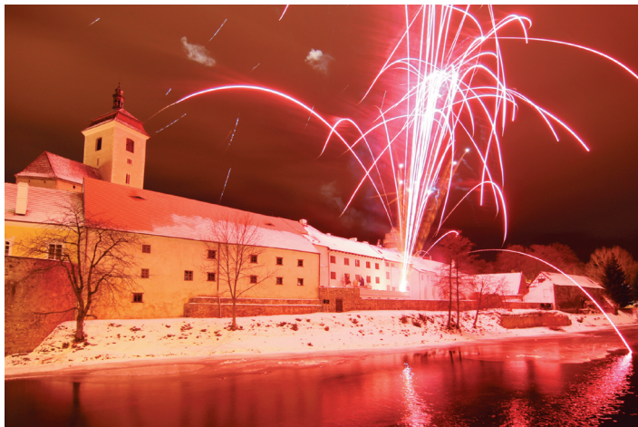
Tradiční novoroční ohňostroj.

15. ROČNÍK • ČÍSLO 1/2013 • VE STRAKONICÍCH • NEPRODEJNÉ • WWW.STRAKONICE.EU