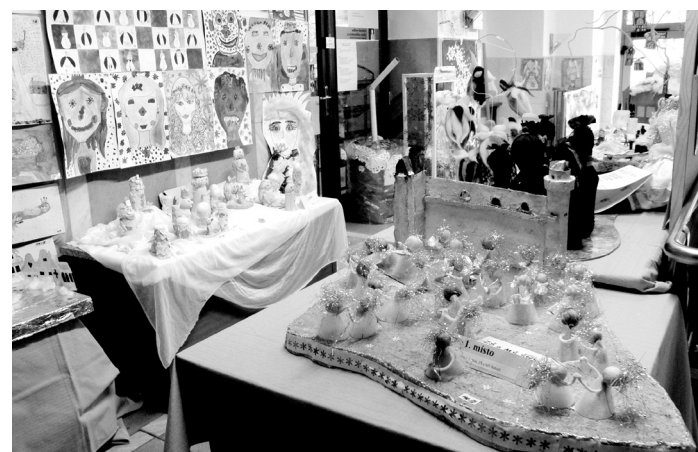
Výstava na téma Ledová krása.