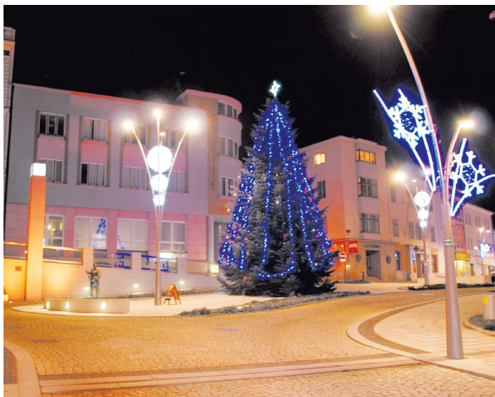
Vánoční výzdoba na Velkém náměstí.