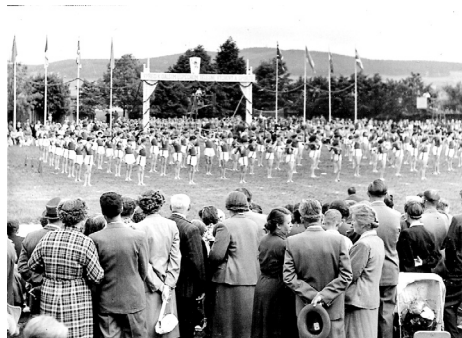
Celostátní spartakiáda Na Křemelce.

Již v průvodu při XI. všesokolském sletu proběhla protikomunistická demonstrace a následně je z řad Sokola vyloučeno 11 tisíc členů. Dne 4. března 1949 činnost zdejšího Sokola končí a činnost přechází pod TJ Jiskra později přejmenováno na TJ Fezko Strakonice. Řa-