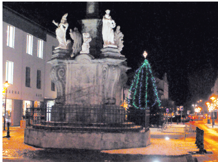
I Palackého náměstí má svoji výzdobu.