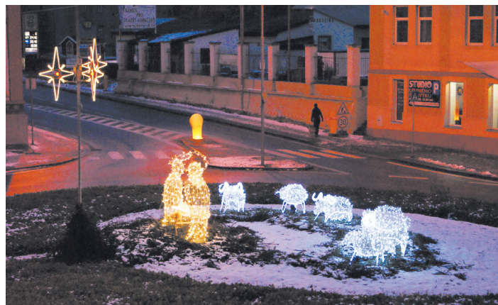
Kruhový objezd u sv. Václava zdobí betlém.

Vážení přátelé, příroda se zvolna uložila k zimnímu spánku a v nás ještě doznívá vánoční atmosféra. Touha po zklidnění běžného shonu je proto v tento slavnostní čas zcela na místě. Začátek nového roku nabízí také příležitost k zamyšlení a ohlédnutí. Je lidské a přirozené, že rádi vzpomene na dobré a hezké, co jsme za odcházející rok se svými blízkými, přáteli i ve městě prožili. Naplnujeme si tak přirozenou touhu po pocitu bezpečí a pocit sounáležitosti. Z ohlédnutí čerpáme i osobní sílu, naději a společnou víru ve věci příští. Víím, prožili jsme rušný rok. Ne vše bylo a proběhlo úplně podle našich představ a očekávání. Na druhou stranu jsme společně v našem městě prožili i chvíle radosti, pospolitosti a hrdosti na věci, které se podařily. To bychom si neměli nechat nikým a ničím kazit. Přeji Vám proto pevné zdraví, štěstí a mnoho naplněných tužeb v roce 2013.