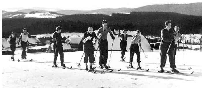
Cvičení na louce.

Josef Rössler–Ořovský. Již v roce 1887 se s nimi proháněl v Praze po Václavském náměstí, jistě k údivu ostatních přihlízejících. Rössler–Ořovský byl zajímavou postavou nejen českého lyžování, ale i celého sportovního hnutí. Byl aktivním sportovcem v různých sportech, dále působil jako funkcionář, diplomat, byl spoluzakladatel Mezinárodní lyžařské komise (FIS) a Českého olympijského