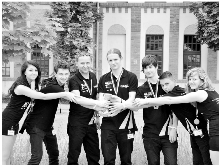
Strakonický tým získal v celostátním finále krásné třetí místo.