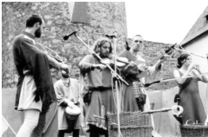
Strakonický hrad se ocitne ve středověku.

Historické slavnosti s netradičním programem v uzavřeném areálu hradu vás nadchnou svou atmosférou dávných časů. Středověkou náladu doplňují divadelní, taneční, hudební, šermířská a kejklířská vystoupení. Nezapomíná se ani na děti, pro něž jsou připraveny různé hry, dovednosti a soutěže.