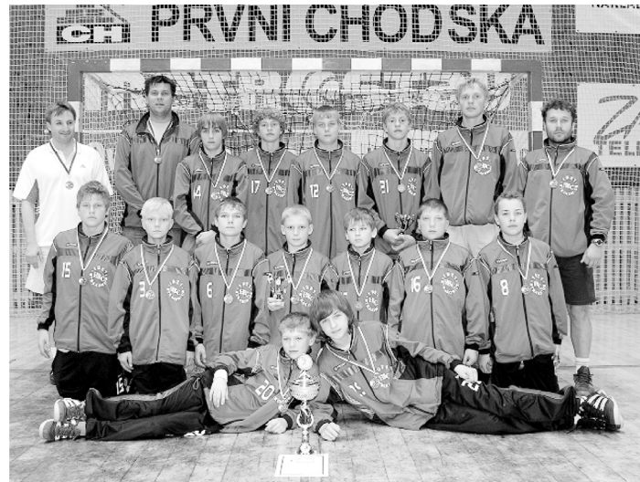
Nevím jak vy, ale já jsem na obrázku našel osm členů dnešního úspěšného prvoligového družstva mužů!

Přes toto zklamání pokračovala snaha oddílu o vylepšení házenkářských sportovišť. Byl získán grant z Jihočeského kraje na položení umělého povrchu na asfaltové házenkářské hřiště ve výši