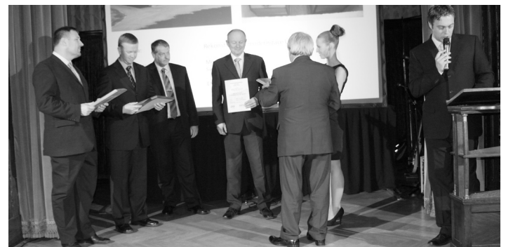
Úpravná vody v Hajské se stala Vodohospodářskou stavbou roku 2012.

kvalitu již tak velmi dobré pitné vody, jejímž zdrojem je prameniště Hajská a minimalizuje také negativní dopady provozu zařízení na životní prostředí. Náklady na rekonstrukci úpravní činily zhruba 70 milionů korun. Na realizaci díla se podařilo získat dotaci z rozpočtu Ministerstva zemědělství ČR a stavbu částečně podpořil také Jihočeský kraj. Polovinu cel-