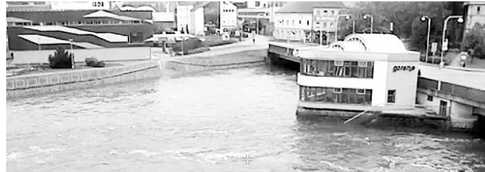
Strakonický soutok při letošních povodních.