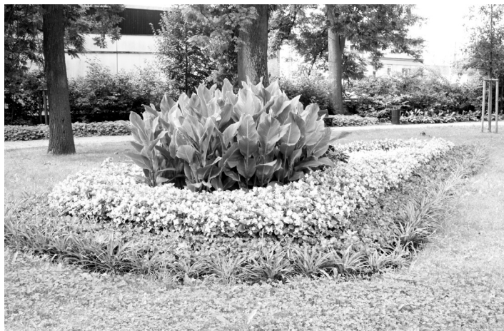
Květinové záhony ve strakonickém parku.

Kromě květin vyžadují pravidelnou péči také dřeviny. Za poslední dvě desetiletí jich bylo vysázeno více než dva tisíce. Samozřejmě se rovněž kácelo. Většinou šlo o stromy, které v městském prostředí stárnou rychleji než v přírodě – břízy, olše, topoly a rovněž jehličnany. Hodně stromů si lidé vysadili v okolí svých domů před lety svépomocí a patří jim za to dík, protože do panelákového města vnesli tenkrát alespoň trochu zeleně. Ovšem stromy buď zestály a staly se pro své okolí nebezpečnými nebo byly vysazeny na nevhodném místě. „V řadě případů jsme museli pokácet i zdravé stromy, které svým kořenovým systémem zasahovaly do inženýrských sítí,“ vysvětluje Ondřej Feit z odboru životního prostředí MěÚ, který má na starosti ochranu přírody a údržbu zeleně ve městě. Pokračování na další straně.