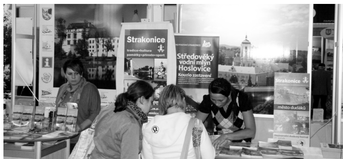
Strakonice lákaly k návštěvě vybraných atraktivit turisty na dalším ročníku turistického rozcestníku ITEP 2013 v Plzni.

Usnesení z jednání rady města naleznete na www.strakonice.eu .