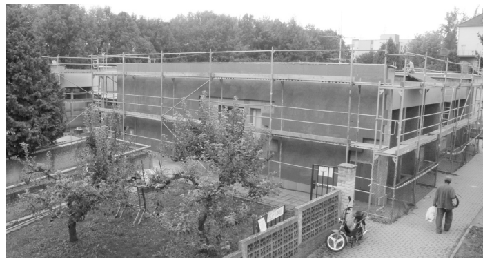
Fasádu MŠ Lidická budou zdobit kresby zvířátek podle motivů Josefa Čapka.

dařilo získat dotaci z Operačního programu životní prostředí, která pokryje 90 procent způsobilých výdajů. Stavební práce probíhají