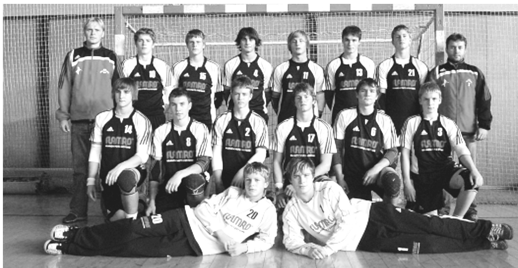
Úspěšné družstvo mladších dorostenců, které získalo 3. místo v republice. Osm hráčů je součástí současného prvoligového družstva mužů, to je vizitka...

Hlavním cílem v roce 2009 bylo probíjení se družstva mladších dorostenců na mistrovství ČR.