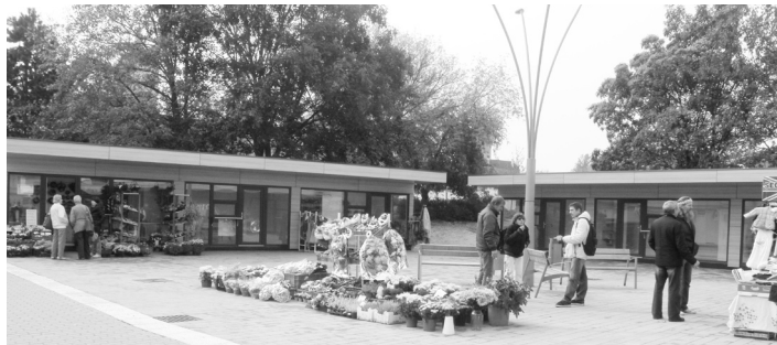
Ke kostelu sv. Markéty se opět vrací tržiště.

Prostor doplnily lampy veřejného osvětlení a mobiliář. Na tyto úpravy za 2,6 milionu korun (vč. DPH) se podařilo získat finanční podporu z Programu rozvoje venkova. Za výrobu a instalaci prodejních stánků, na jejichž vzhledu partici-