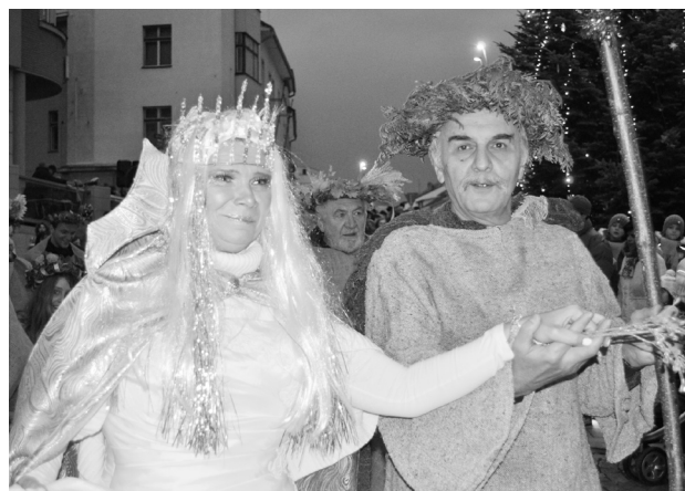
I v letošním roce rozsvítí vánoční strom Ledová královna.