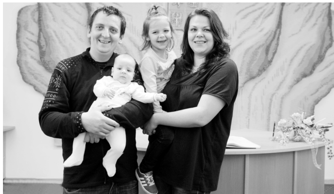
Vítání občánek na strakonické radnici.

Celkem 261 občánek bylo v roce 2013 přivítáno na strakonické radnici. Vítání občánek je zcela jistě jednou z nejpříjemnějších záležitostí, kterými se zabývá odbor vnitřních věcí Městského úřadu ve Strakonici. Celý lidský život od narození až do smrti zaznamenává oddělení matrik. Právě zde jsou nově narození zapsáni do matriční knihy a je jim vydán rodný list. Další setkání s matrikou nastává u vítání občánek. Strakoničtí rodiče pro své dítě při této příležitosti obdrží 5 000 korun jako dar. Matrika doprovází další důležité životní kroky občanů, svatby a jubilea. „Jubilantům, kteří dovršili 70 let, jsou zaslána blahopřání podepsaná představiteli města. Pětasedmdesátníci a osmdesátníci a všichni starší dostanou k narozeninám dárkový balíček v hodnotě 300 korun,“ říká Martina Kotrchová, vedoucí odboru vnitřních věcí MěÚ. Manželům, kteří společně oslaví výročí svatby (zlaté nebo diamantové), náleží od města balíček v hodnotě 600 korun.