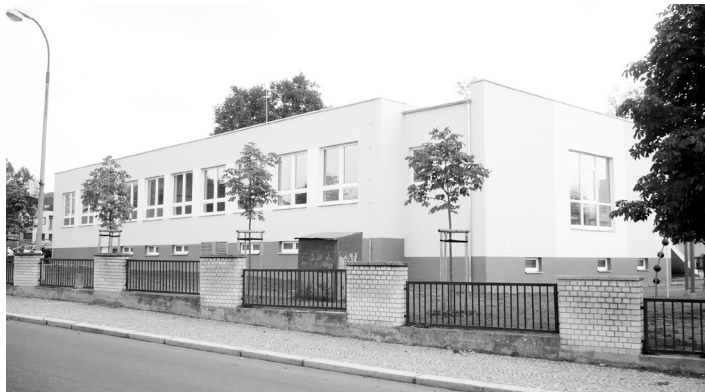
Objekt školní jídelny při Základní škole F. L. Čelakovského byl zateplen a byla vyměněna okna.

V rámci projektu byly zatepleny obvodové stěny a střecha, vyměněna okna a související konstrukce. Díky těmto úpravám dojde k významnému snížení energetické náročnosti budovy, včetně nákladů na vytápění. Celkové náklady byly 3,3 mil. Kč. Město Strakonice získalo dotaci ve výši 2,2 mil. Kč.