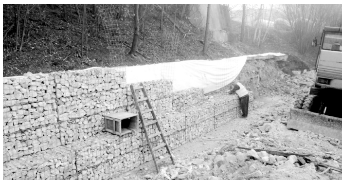
Výstavba gabionové opěrné zdi.

Rekonstrukce a modernizace úpravní vody v Pracejovicích, která zásobuje pitnou vodou čtyři obce v okolí a je jedním ze tří zdrojů pro město Strakonice, započala v září 2013. Jejím cílem je modernizace technologického procesu úpravy vody i zajištění dostatečné kapacity pitné vody. Jde o třetí velkou investici do vodohospodářského majetku města v posledních letech.