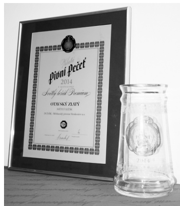
Otavský zlatý získal Zlatou pivní pečeti.

Tak jako Česká republika získala zlato na olympiádě, stejně tak vybojoval strakonický Otavský zlatý zlatou pozici v kategorii Prémiových ležáků na XXIV. ročníku Reprezentačních slavností piva v Táboře, který má mezinárodní zastoupení. Vítězové jednotlivých kategorií k titulu získají i právo užívat příslušné označení na etiketách a k propagačním účelům a tím označit prestiž svých piv.