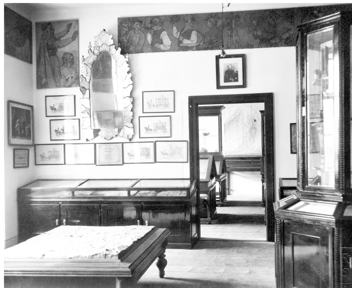
Instalace muzejních sbírek ve 30. letech 20. století ve staré školní budově na náměstí, dnes OD Maják.

V roce 1908 přišel okresní školní inspektor Jan Dyk s myšlenkou muzeum obnovit. Jeho snahy přerušila 1. světová válka, a tak až v roce 1923 začal muzejní sbírky shromažďovat ve dvou místnostech na strakonickém hradě, kam vnikal trhlinami ve zdech prach a vlhko. V roce 1926 Dyk zemřel. V započaté činnosti pokračoval okresní školní inspektor Josef Řehoř a po něm ředitel státního reálného gymnázia Vojtěch Novotný. Dne 4. května 1930 byl ustanoven Musejní spolek při městském muzeu v Strakonících. Z vděčnosti k zakladateli bylo nazváno Městské Dykovo muzeum. V roce 1930 poskytlo město muzeu místnosti v uprázdňené škole na náměstí (OD Maják). Přestěhování mělo být dočasné, než se uvolní a upraví místnosti v hradu a město vyjedná s majiteli smlouvu o pronájmu. V dubnu 1934 byly nově uspořádané sbírky zpřístupněny