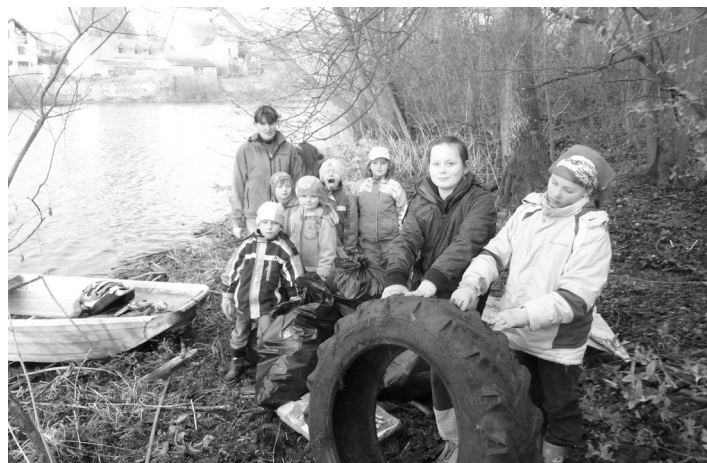
Úklid řeky Otavy.

městnanců Technických služeb Strakonice, dále při akcích dětského zastupitelstva, čištění řek Otavy a Volyněky i brigádách pořádaných společenstvími vlastníků, organizacemi či sdruženími. Zapojilo se téměř sedm stovek lidí.