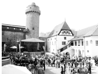
Za pozváním, sportem i kulturou přímo na strakonický hrad.